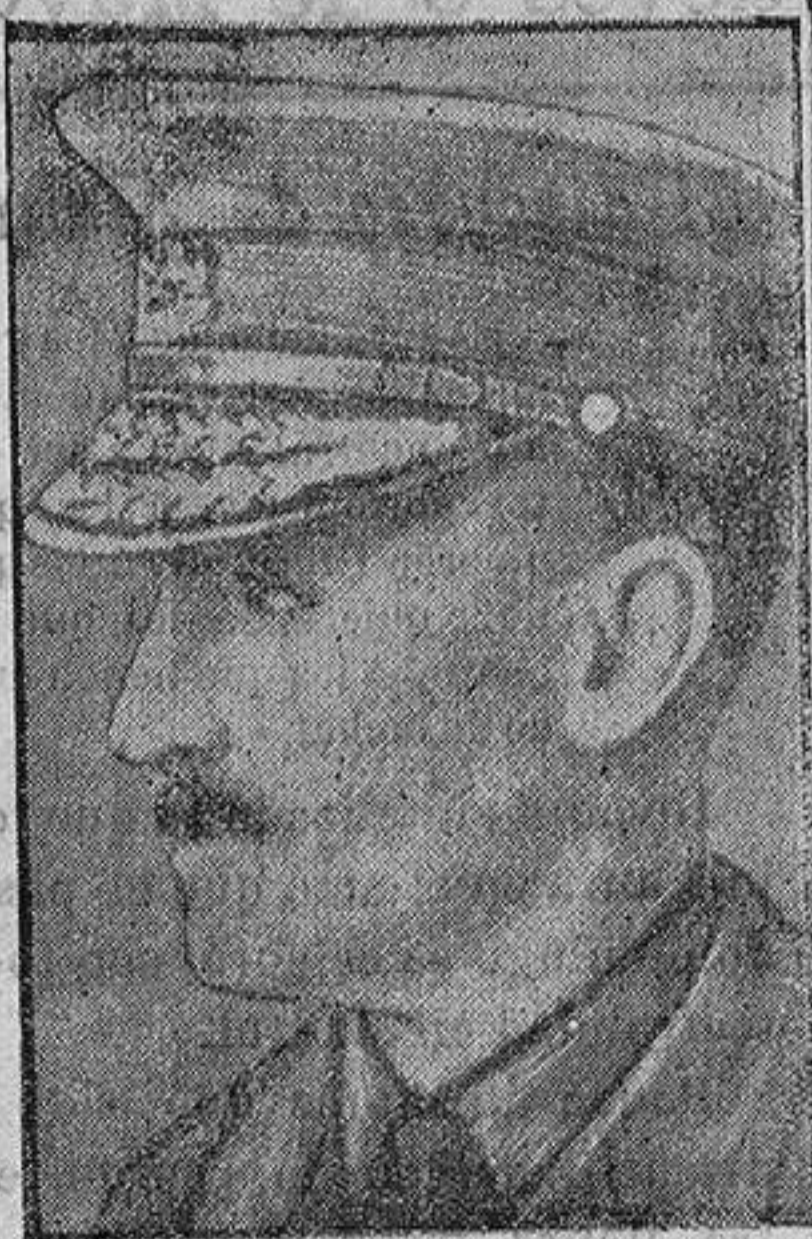
El general inglés Sinclair Horne

Medítense en todo esto, y si hoy no lo comentamos, habremos de hacerlo con la debida extensión.