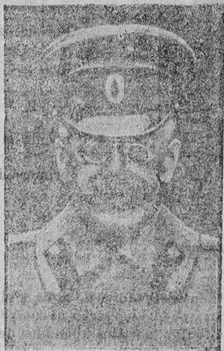
El general Relieff «Foto-Información»