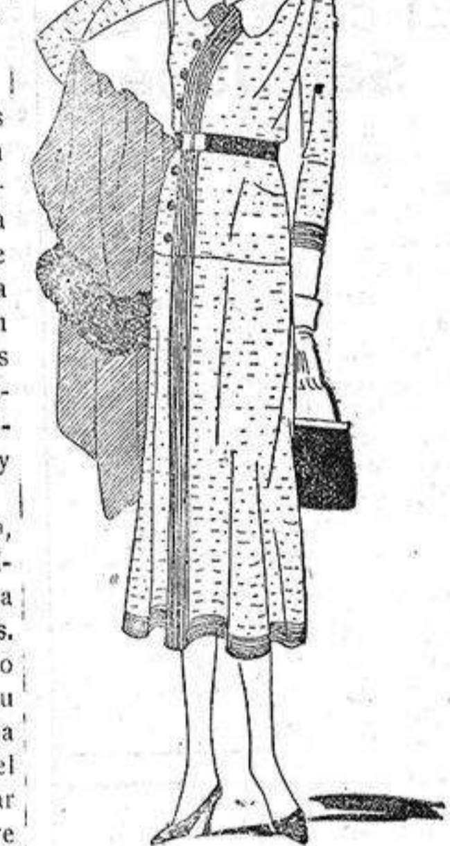
Vestido de jersey de lana de fantasía.

En una palabra, que no existe ningún oficio, situación, posición, estado o carrera que la mujer no desempeñe en el mundo. Y no ya en su aspecto femenino de acuerdo con las funciones que le están naturalmente encomendadas, sino que en todos los demás también, la moderna Eva no ha encontrado ningún oficio ni ocupación superiores o inferiores a sus capacidades.