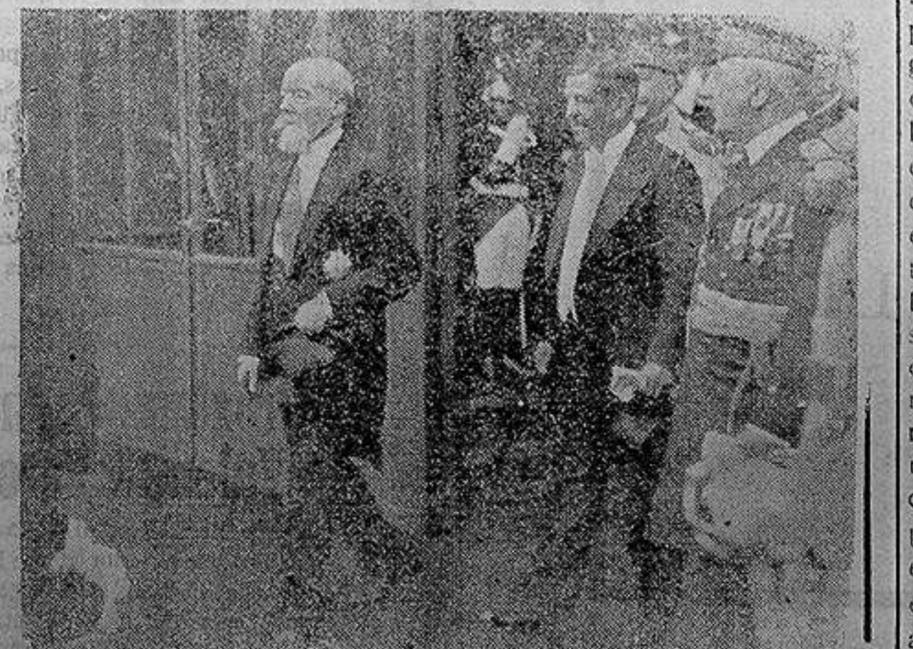
París.—El nuevo presidente de Francia, M. Doumer, saliendo del Eliseo, seguido del jefe del Gobierno, para visitar la Casa Consistorial.

Valencia no aspira en modo alguno a llevar a su seno, centralizándolo, el problema regional. Su aspira-