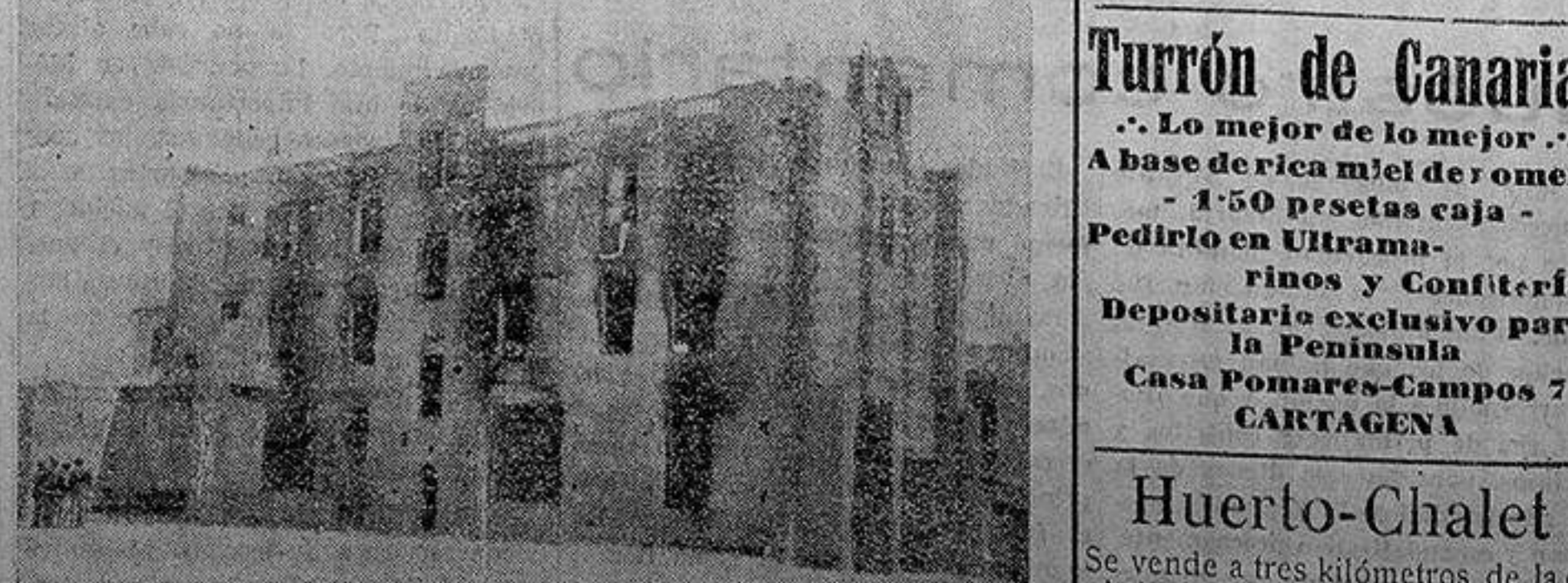
Esqueleto del convento de los frailes franciscanos