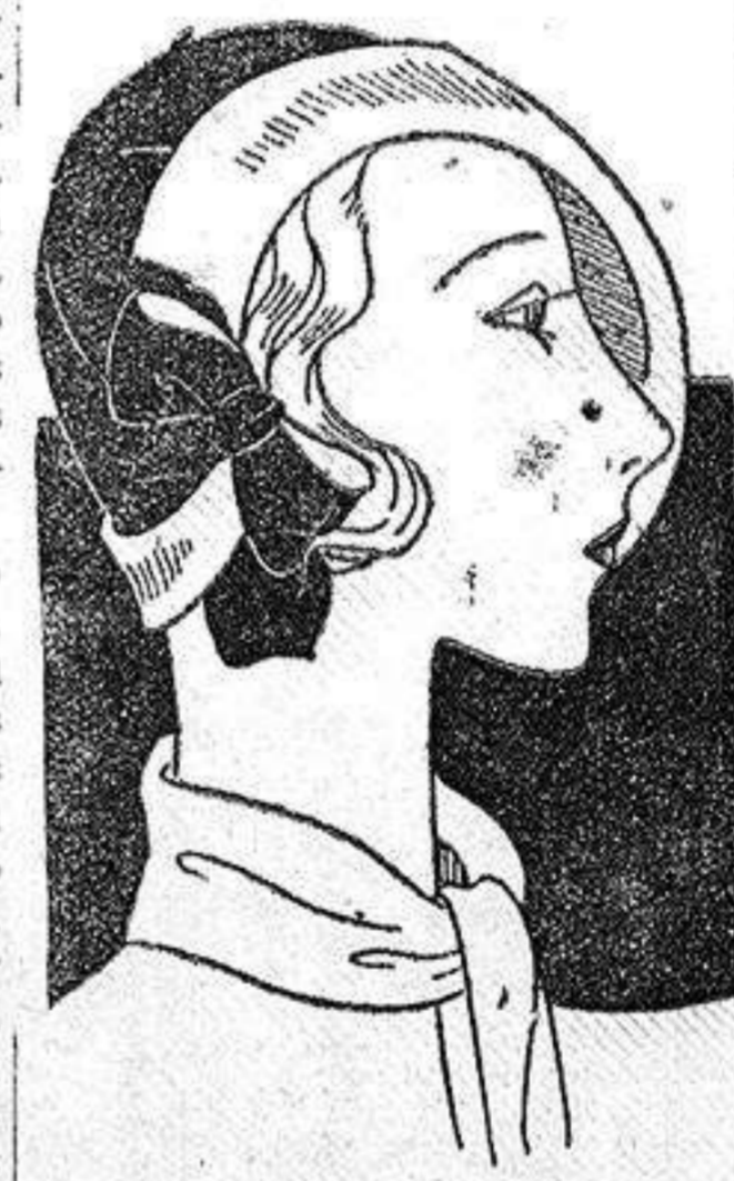
Sombrero de satén rojo, forrado con negro y blanco, adornado en el costado con un nudo.

MISS ANY (Reproducción prohibida). París, Abril de 1931.