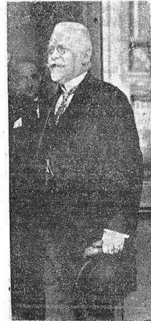
El Acuerdo Austriaco Austroalemán. —El señor Schoeber, chanciller de Austria.

Pedimos que se haga claridad sobre este asunto; por nuestra parte no dejaremos de contribuir a ello tan pronto como reunamos datos suficientes para señalar con más precisión a quienes tengan tanto descaro para aprovecharse de intereses ajenos.