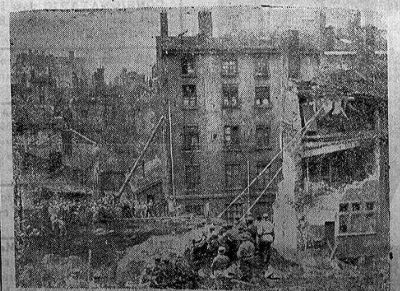
La catástrofe de Lyon.—Los soldados de ingenieros haciendo caer una techumbre que amenazaba derrumbarse.