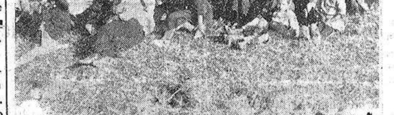
El Terremoto de Italia. —La comuna de Lacedonia ha sido muy perjudicada por la catástrofe. He aquí, acampando bajo una tienda, a los habitantes cuyas casas han sido destruidas.

ter todavía estas regiones peligrosas, en las que a cada momento están ex-uestos a hallar la muerte más horrible. A juzgar por los relatos de los supervivientes, en el momento de la catástrofe, poca importancia tiene la pérdida de la vida, pero en cambio, es horrible la sensación de angustia que se experimenta en estos casos. Y con la angustia el loco impulso de dejarse dominar por salvajes instintos. En esos momentos el hombre y la mujer olvidan los lazos de la familia, la existencia de los hijos y toda consideración sentimental. El hombre, excitado por el feroz impulso de salvarse, no piensa en nadie más que en sí mismo. En aquellos momentos de locura haría cualquier cosa, cometería el mayor crimen si éste había de darle la salvación. Este impulso instintivo es natural y explicable, pero no por eso menos sensible. Y en tales casos es cuando el hombre puede convencerse de su pequeñez y de que, realmente, en el mundo no tiene mayor importancia que un gusano que viva en un queso de bola. JULIO A. RÉBORA Paris Agosto 1930. (Prohibida la reproducción.) «La Maseran», el drama regional de Ferrándiz Torre-mocha está a la venta en kioscos y librerías.