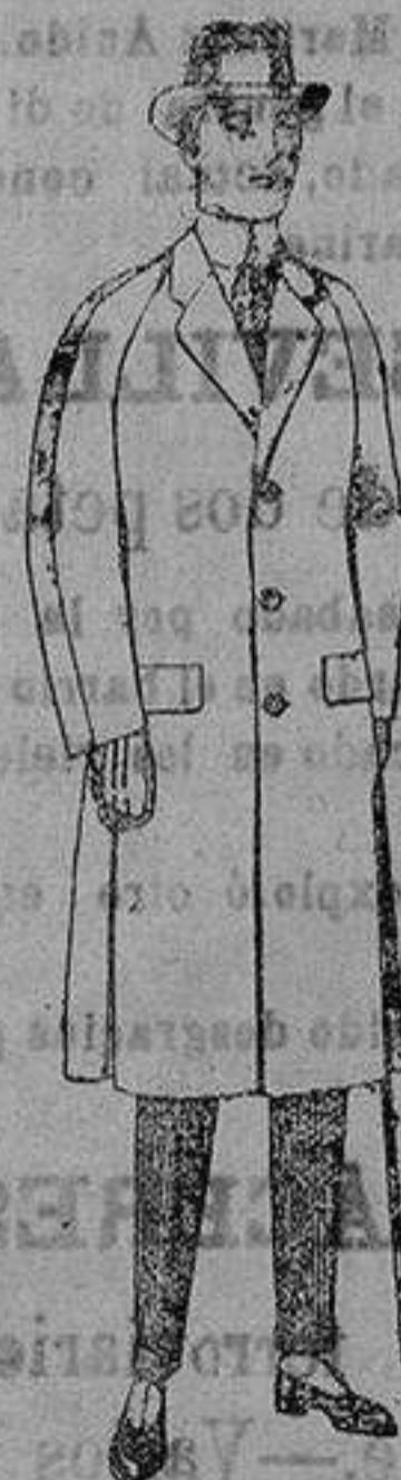
Gabanes de patén, melton, cheviot, con forro de stoned satén o escocés. de ptas. 62 a 115