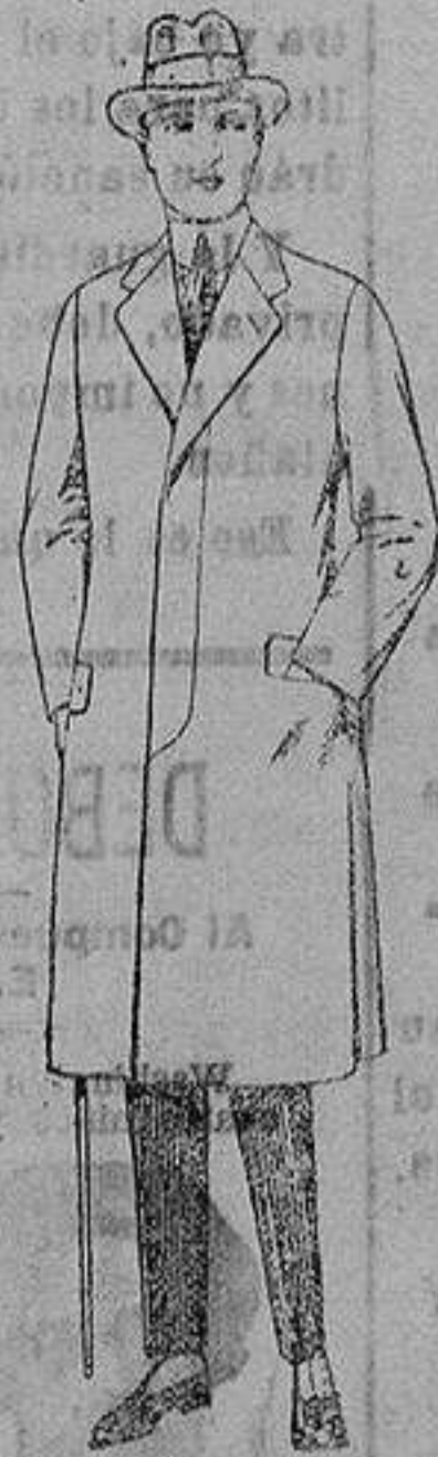
Gabanes de melton, gabardina, etc. de ptas. 70 a 175