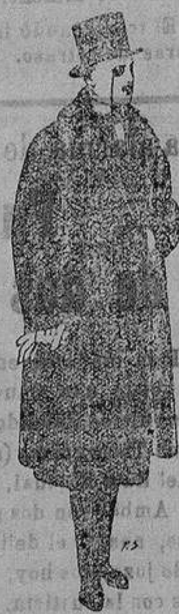
Gabanes de edredón negro, con cuello vistas de piel. de ptas. 220 a 250.