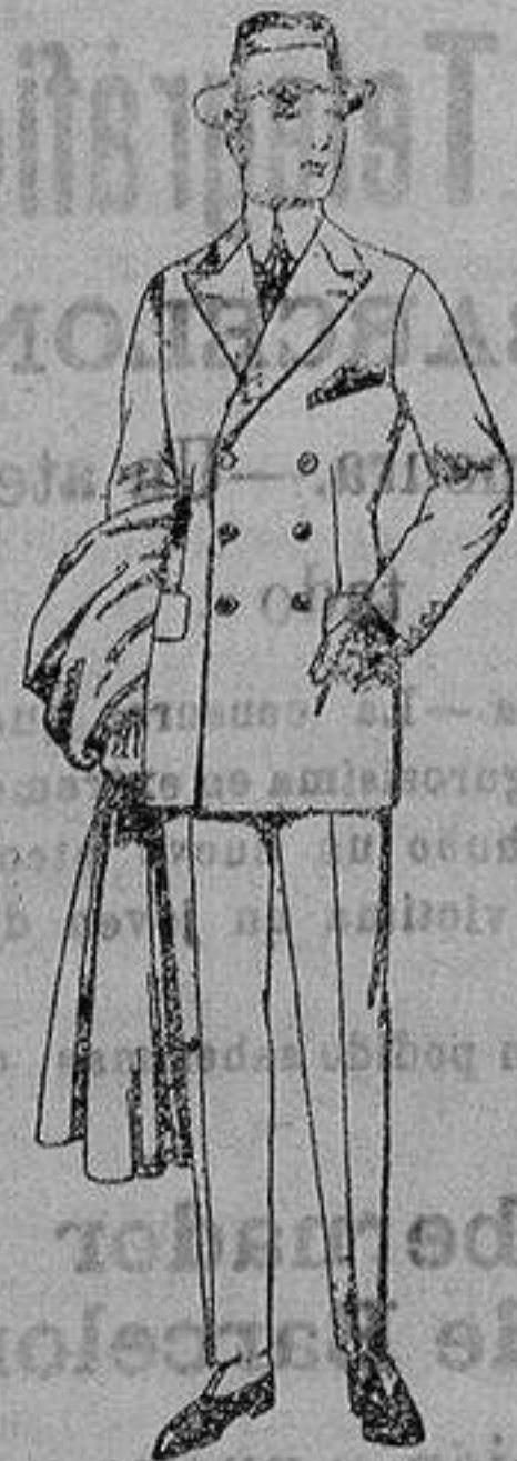
Trajes de cheviot, melton, vicuña o jerga. de ptas. 65 a 190.