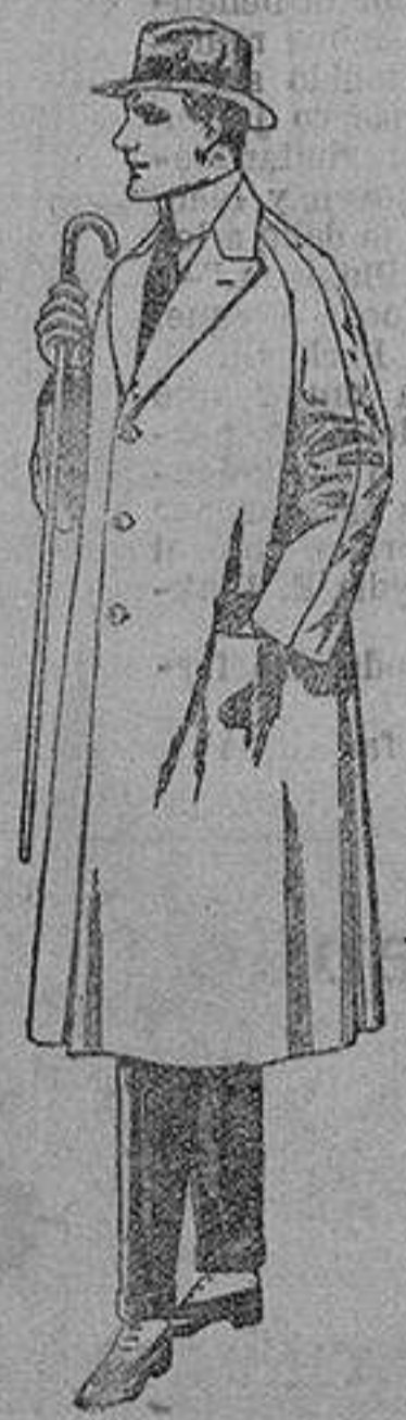
Gabanes de cheviot, gamuón, alpaca etc. de ptas. 55 a 60.