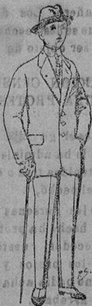
Trajes de patén, vicuña o jerga, para niños de 10 a 12 años. de ptas. 37 a 83. Los mismos para jovencitos de 13 a 16 años. de ptas. 40 a 85