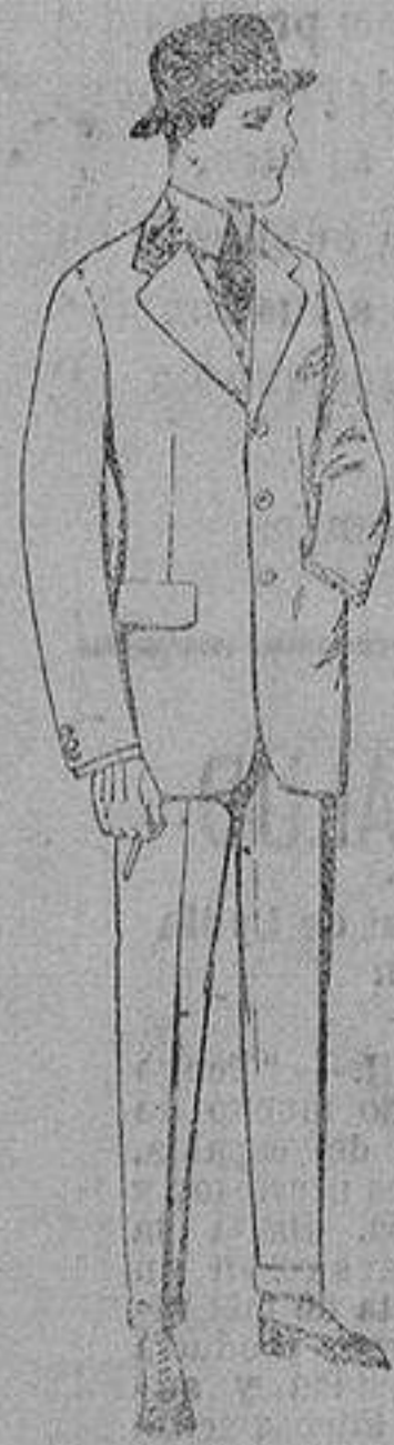
Trajes de cheviot, melton, vicuña o jerga. de ptas. 47 a 190.

Princesa, 2 :: Alicante :: Victoria, 1 Sucursales: Madrid, Barcelona, Almeria, Bilbao, Cádiz, Cartagena, Gijón, Granada, Málaga, Palma de Mallorca, Santander, Sevilla, Valencia, Valladolid, Zaragoza