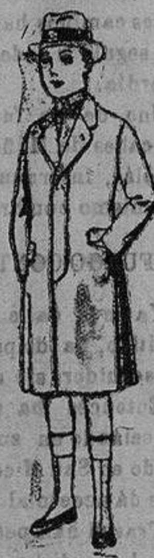
Gabanes de patén, para niños de 10 a 12 años. de ptas. 35 a 42.

— FIDASE EL CATALOGO GENERAL — PRECIO FIJO VENTAS AL CONTADO