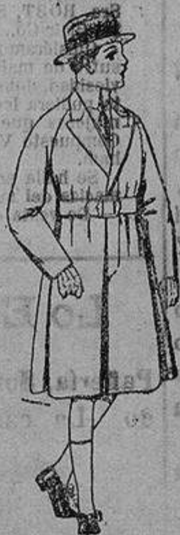
Gabanes de patén, para niños de 4 a 9 años. de ptas. 30 a 52.

Ropas confeccionadas para Caballero, Señora, Niños y Niñas Peletería, Camisería, Géneros de punto, Corbatería, Guantería, Sombrerería, Zapatería, Paraguas, Bastones y Artículos de Viaje