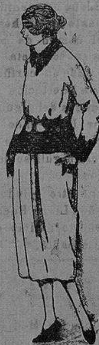
Paletots de punto de lana, hechos a mano. de pta. 17/50 a 25

Ropas confeccionadas para Caballero, Señora, Niño y Niña