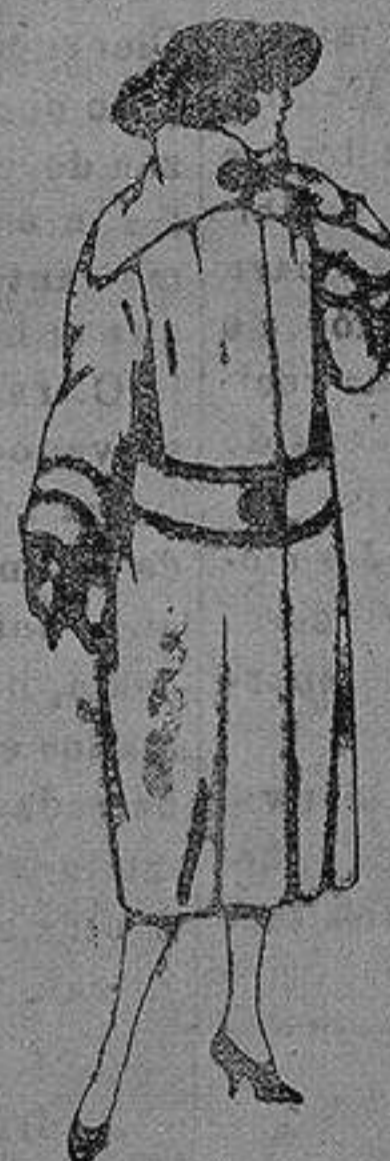
Abrigos de terciopelo de lana, ratina, etc. en negro, azul color, adorno pespunte seda de pta. 120 a 200