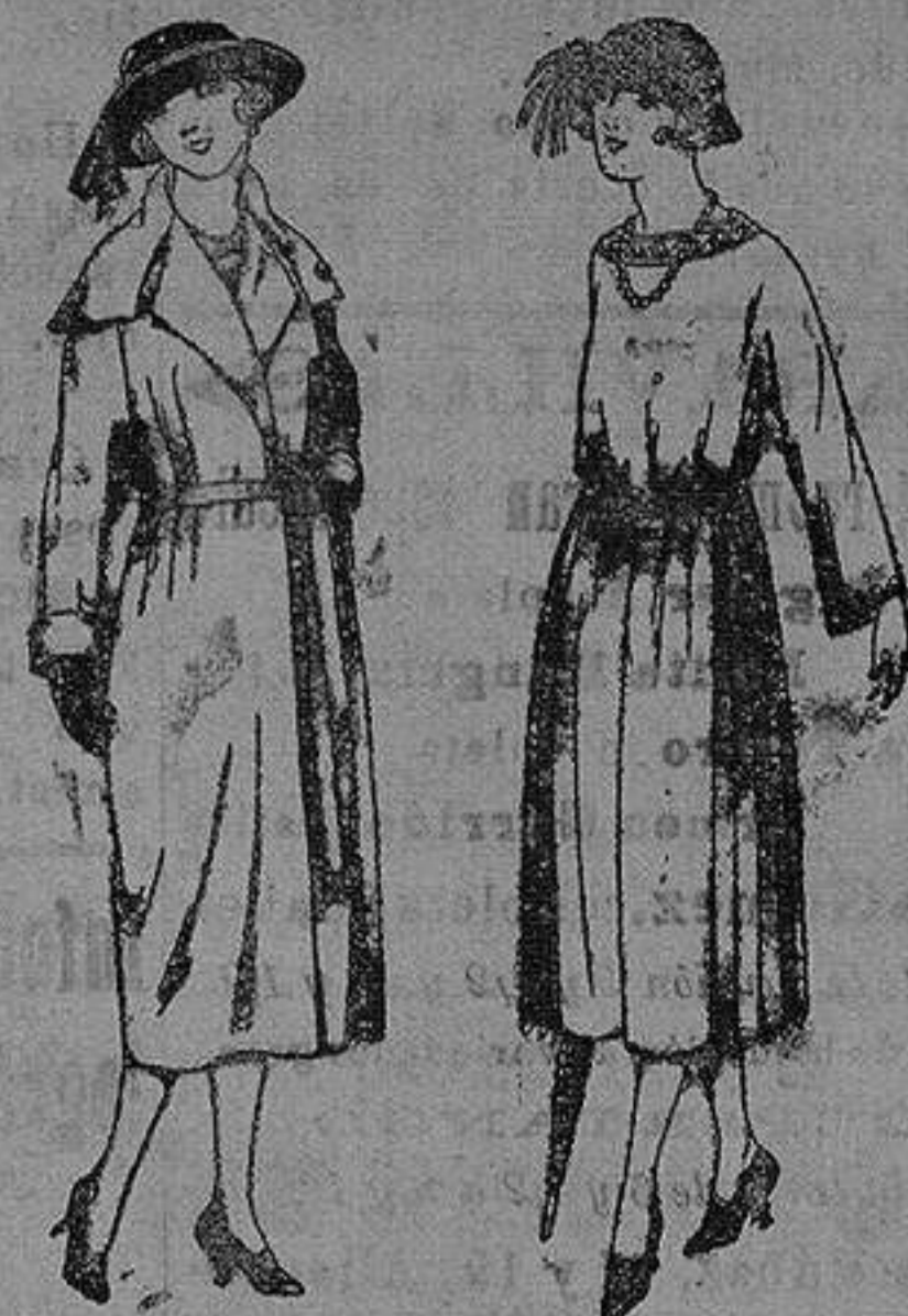
Abrigos de gamuza, cheviet, etc., en negro, azul y color. de pta 50 a 100