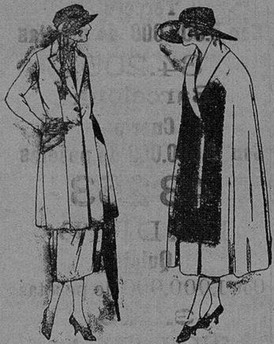
Trajos de sarga inglesa, haviot, en negro azul y color. de pta 140 a 200.

Altamira, 2 :- Alicante :- Victoria, 1 Sucursales: Madrid, Barcelona, Almeria, Bilbao, Cadiz, Cartagena, Gijón, Granada, Málaga, Palma de Mallorca, Santander, Sevilla, Valencia, Valladolid, Zaragoza