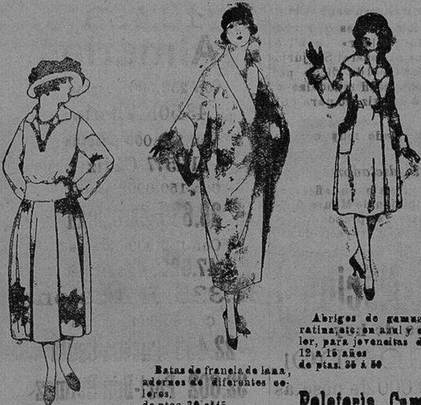
Abrigos de gamuza ratina, etc. en azul y color, para jovencitas de 12 a 15 años de pta. 25 a 50