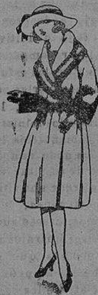
Abrigos de terciopelo de lana, gamuza, etc., en negro, azul y color, para jovencitas de 12 a 15 años. de pta. 55 a 95