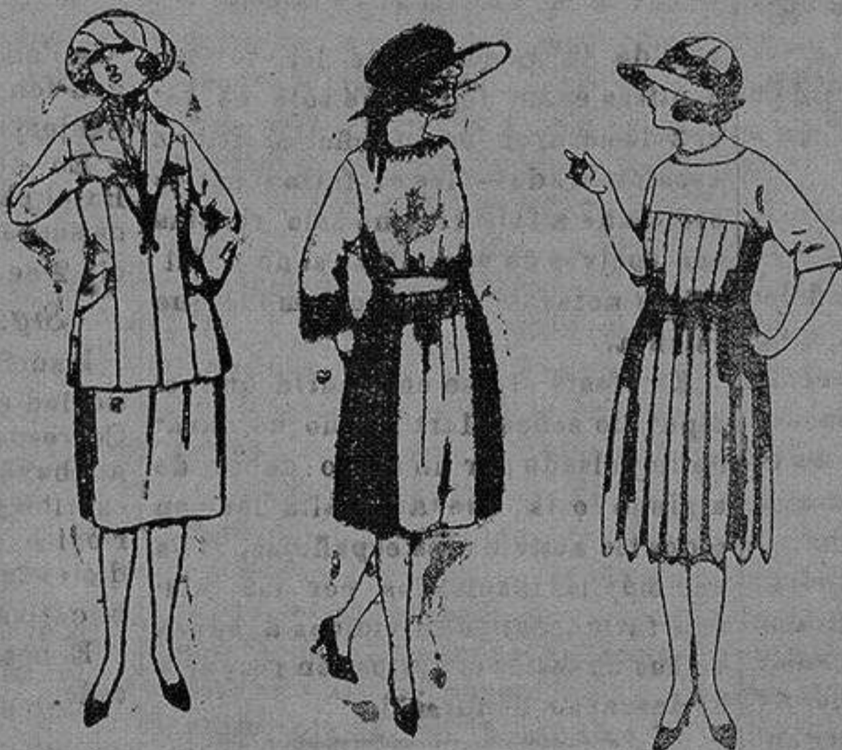
Trajos de sarga inglesa, gabardina etc., en azul y color. de pta. 55 a 150