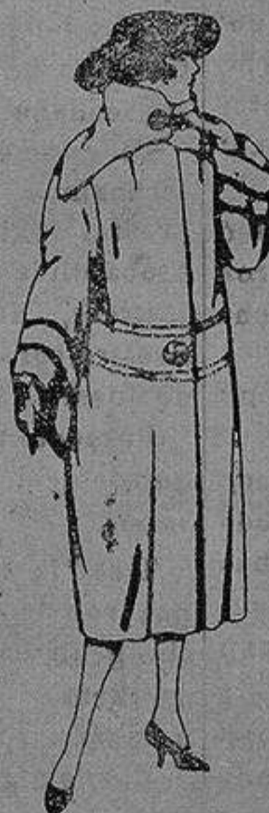
Abrigos de terciopelo de lana, ratina, etc. en negro, azul y color, adornos pespunte seda de pta. 120 a 200