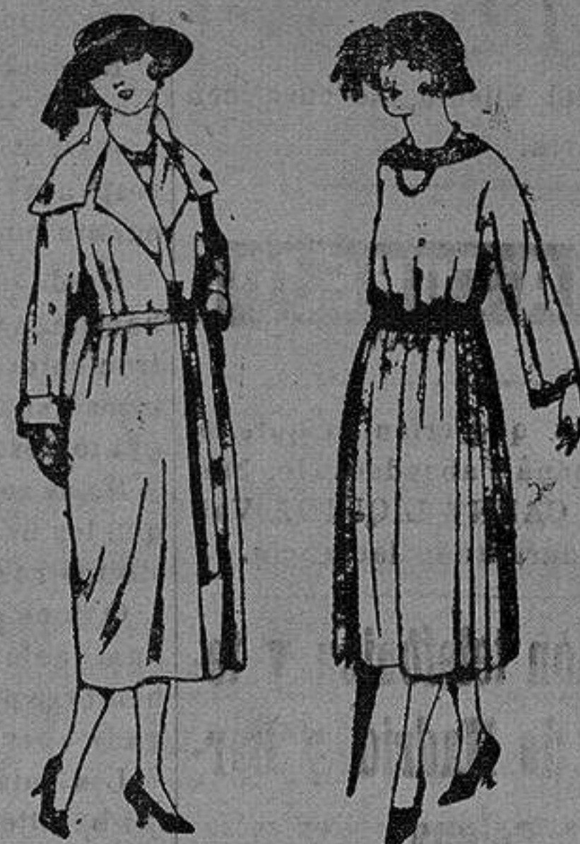
Abrigos de gamuza, cheviot, etc., en negro, azul y color. de pta 50 a 100