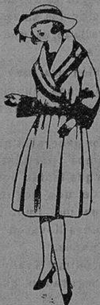
Abrigos de terciopelo de lana, ratina, etc. en negro, azul y color, para jovencitas de 12 a 15 años. de pta. 55 a 95