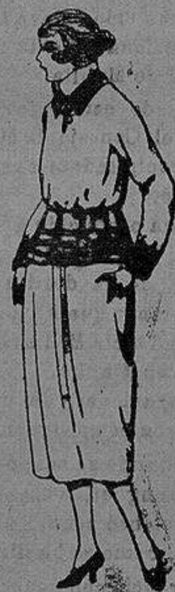
Paletots de punto de lana, hechos a mano. de pta. 1750 a 35

Ropas confeccionadas para Caballero, Señora, Niño y Niña