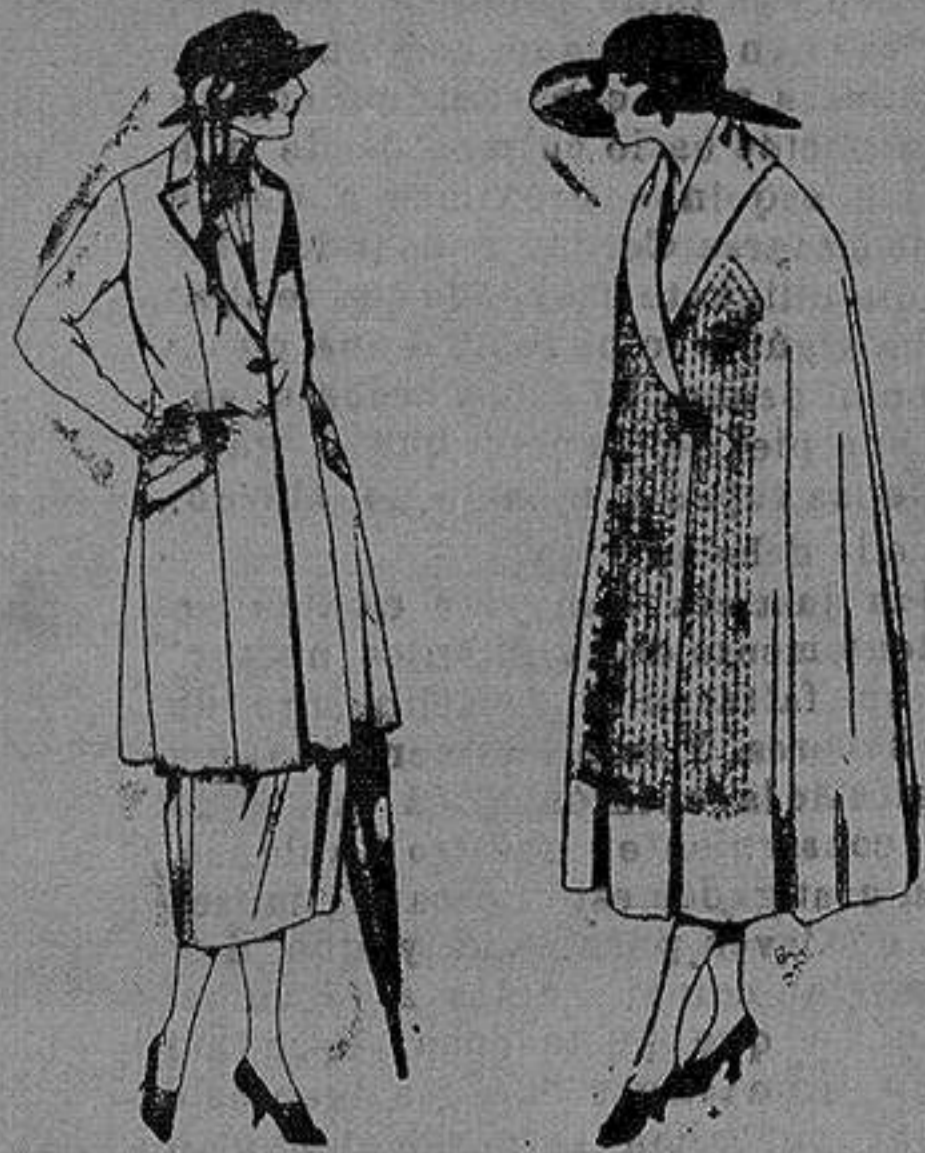
Tresjes de sarga inglesa, cheviot, en negro azul y color. de pta 140 a 200.

Altamira, 2 :: Alicante :: Victoria, 1 Sucursales: Madrid, Barcelona, Almeria, Bilbao, Cadiz, Cartagena, Gijón, Granada, Málaga, Palma de Mallorca, Santander, Sevilla, Valencia, Valladolid, Zaragoza