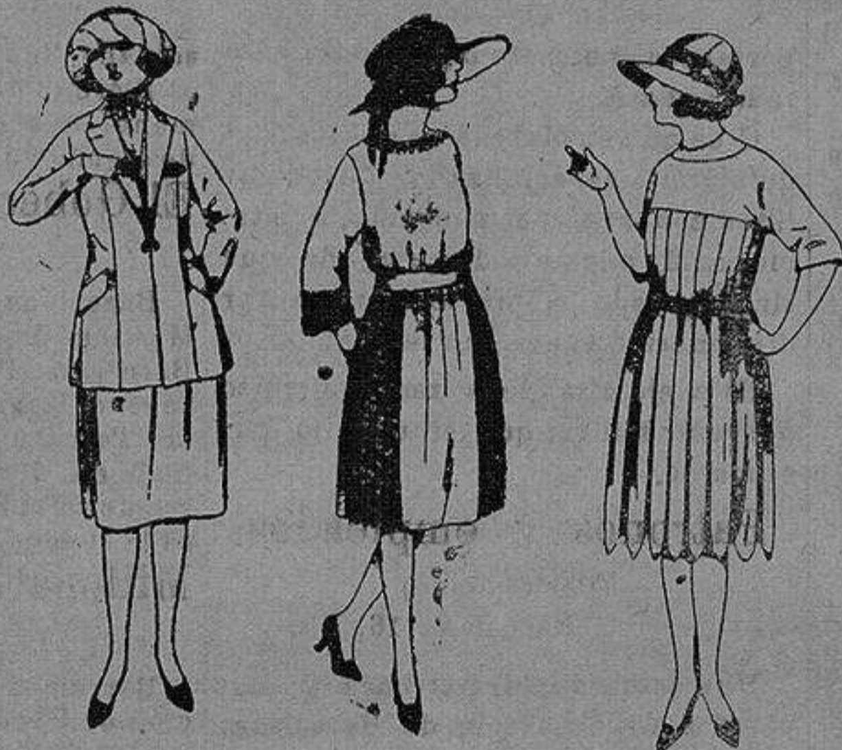
Trajes de sarga inglesa, gabardina etc., en azul y color. de pta. 35 a 100