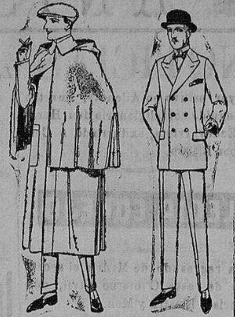
Impermeables mackintosh en negro y azul de ptas. 85 a 157 Trajes de melton, cheviot, estambre, vicuña o jerga. de ptas. 50 a 175