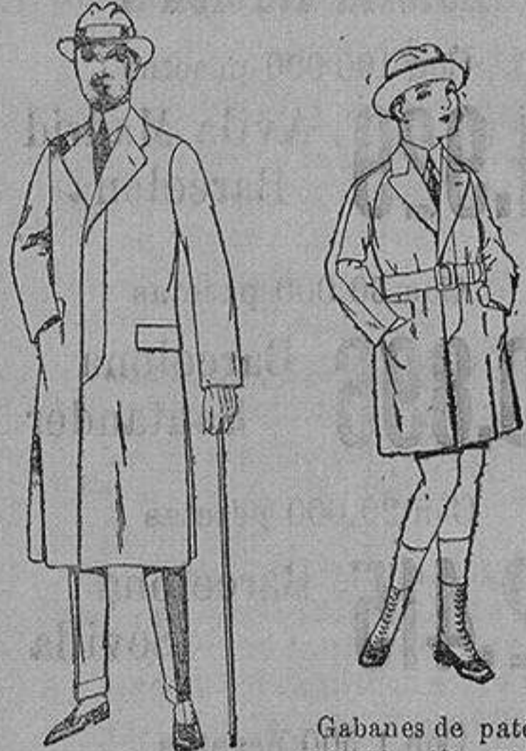
Gabanes de patén gamusa, etc. para niños y jovencitos de 10 a 16 años. de ptas. 30 a 7 Gabanes de cheviot gamusa o patén etcétera. de ptas. 45 a 140