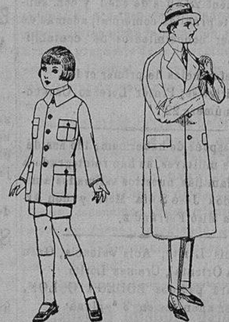
Trajes de patén modelo Sport, para niños de 4 a 9 años. de ptas. 22 a 35. Gabanes raglán de patén, melton, cheviot, con forro de seda o satén. de ptas. 60 a 160

Ropas confeccionadas para Caballero, Señora, Niño y Niña