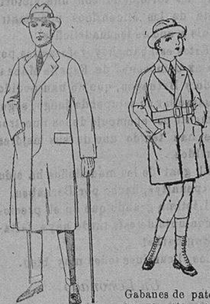
Gabanes de patén gamusa, etc. para niños y jovencitos de 10 a 16 años. de ptas. 30 a 7 Gabanes de cheviot gamusa o patén etcétera. de ptas. 45 a 140.