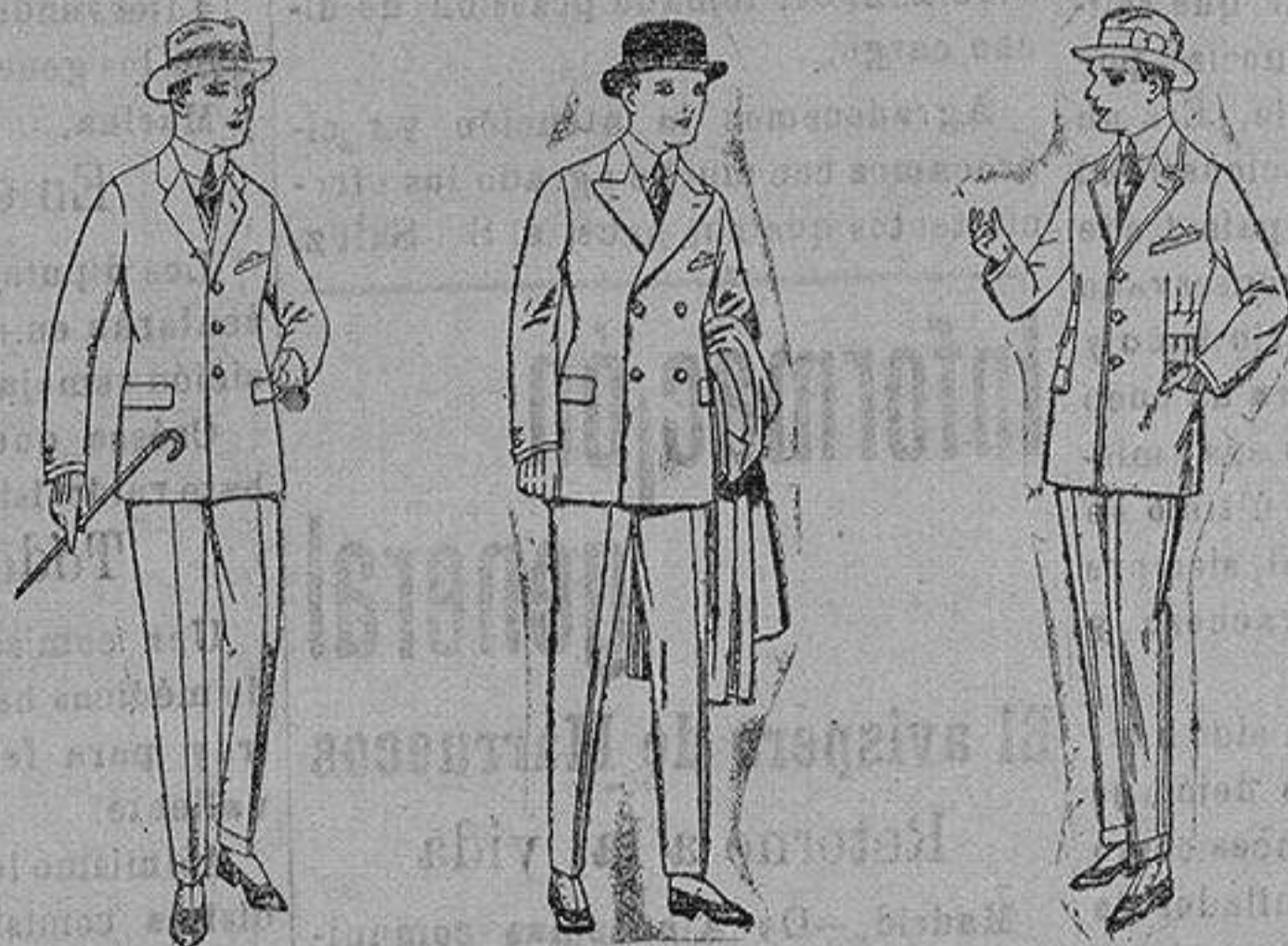
Trajes de patén vicuña o jerga, para niños y jovencitos de 10 a 16 años. de ptas. 30 a 85. Trajes de patén, vicuña etc. para niños y jovencitos de 10 a 16 años. de ptas. 32 a 85. Trajes de patén, vicuña o jerga forma Sport, para niños y jovencitos de 10 a 16 años. de ptas. 40 a 85.