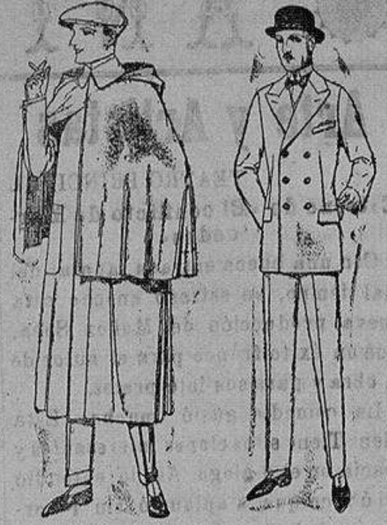
Impermeables mackintosh en negro y azul de ptas. 85 a 157 Trajes de melton, cheviot, estambre, vicuña o jerga. de ptas. 50 a 175.