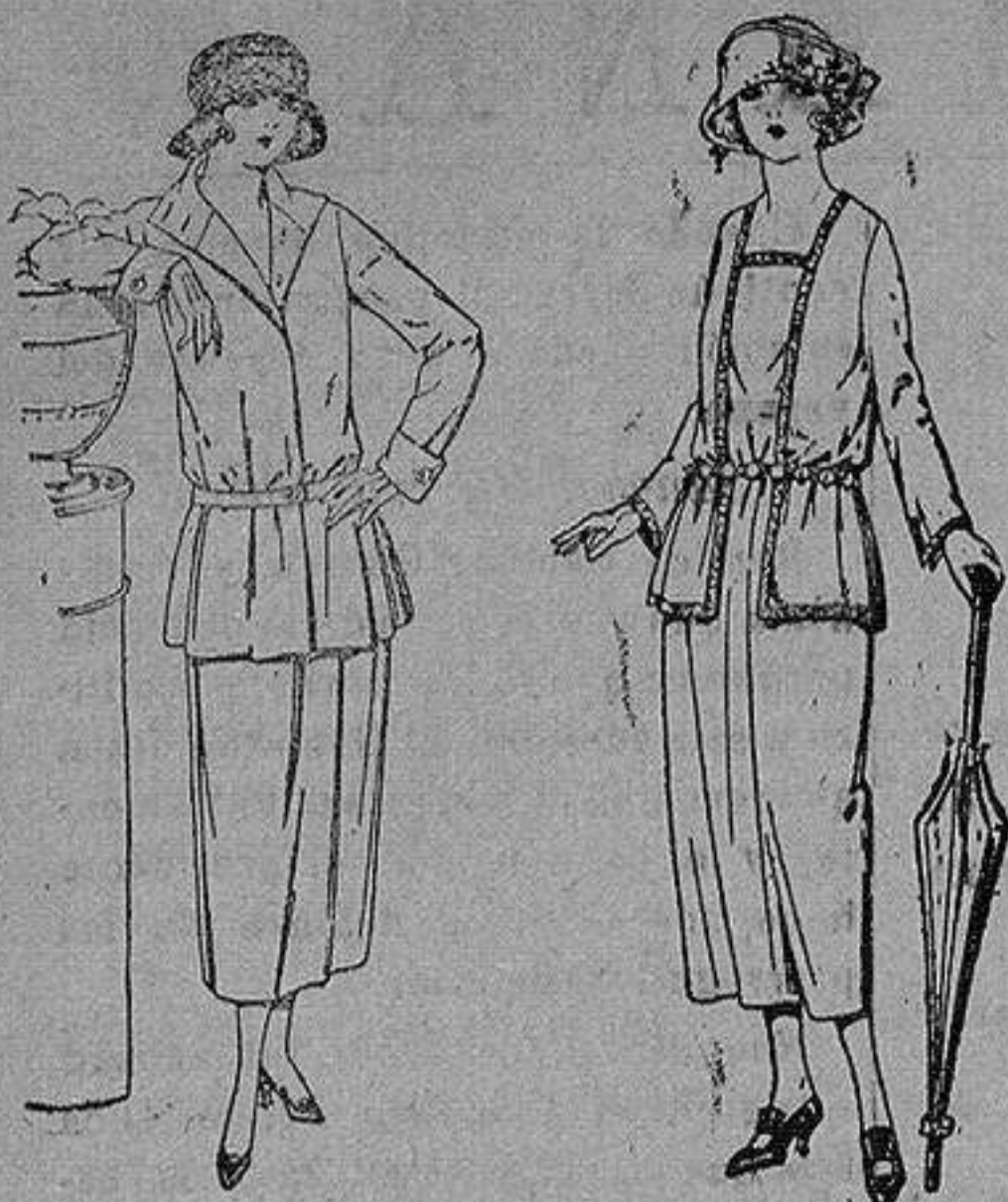
Traje sastre de estambre gabardina, etc., chaqueta forrada de seda, en negro marino y colores moda. de ptas. 115 a 145

Sucursales: Madrid, Barcelona, Almeria, Bilbao, Cadiz, Cartagena, Gijón, Granada, Málaga, Palma de Mallorca, Santander, Sevilla, Valencia, Valladolid, Zaragoza