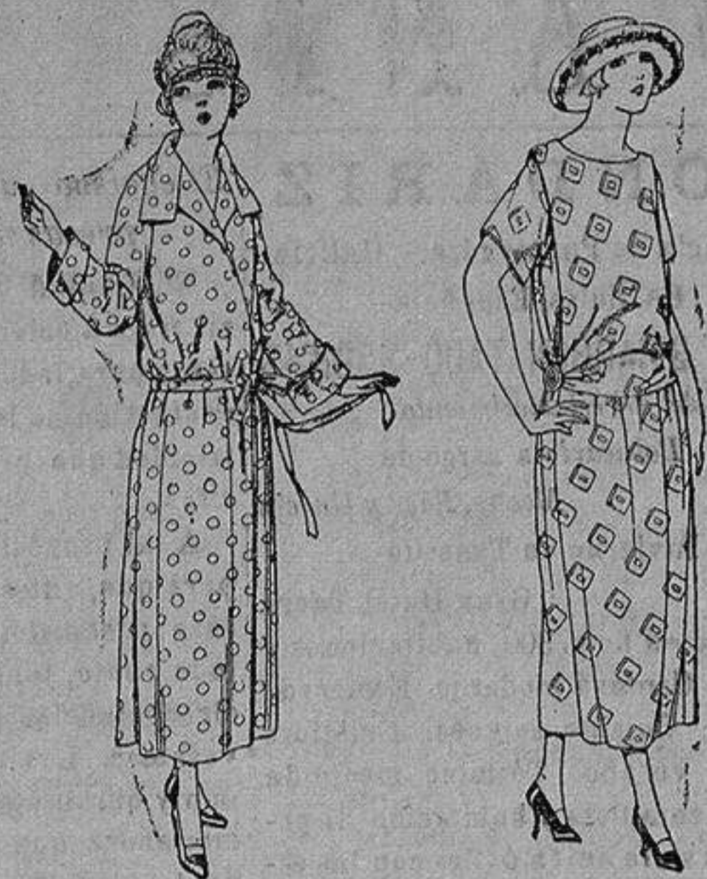
Batas de percal, voile listado, etcétera. de ptas. 16 a 28