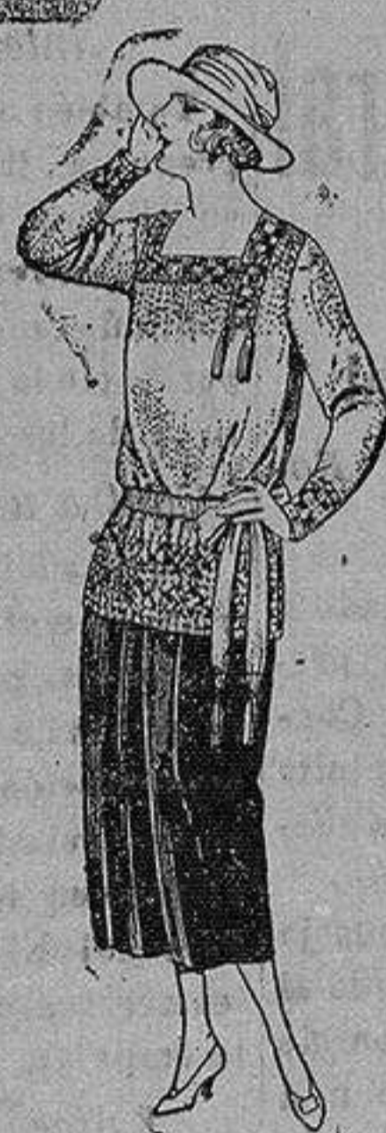
Paletots de punto de lana, en negro y colores. de ptas. 22 a 110