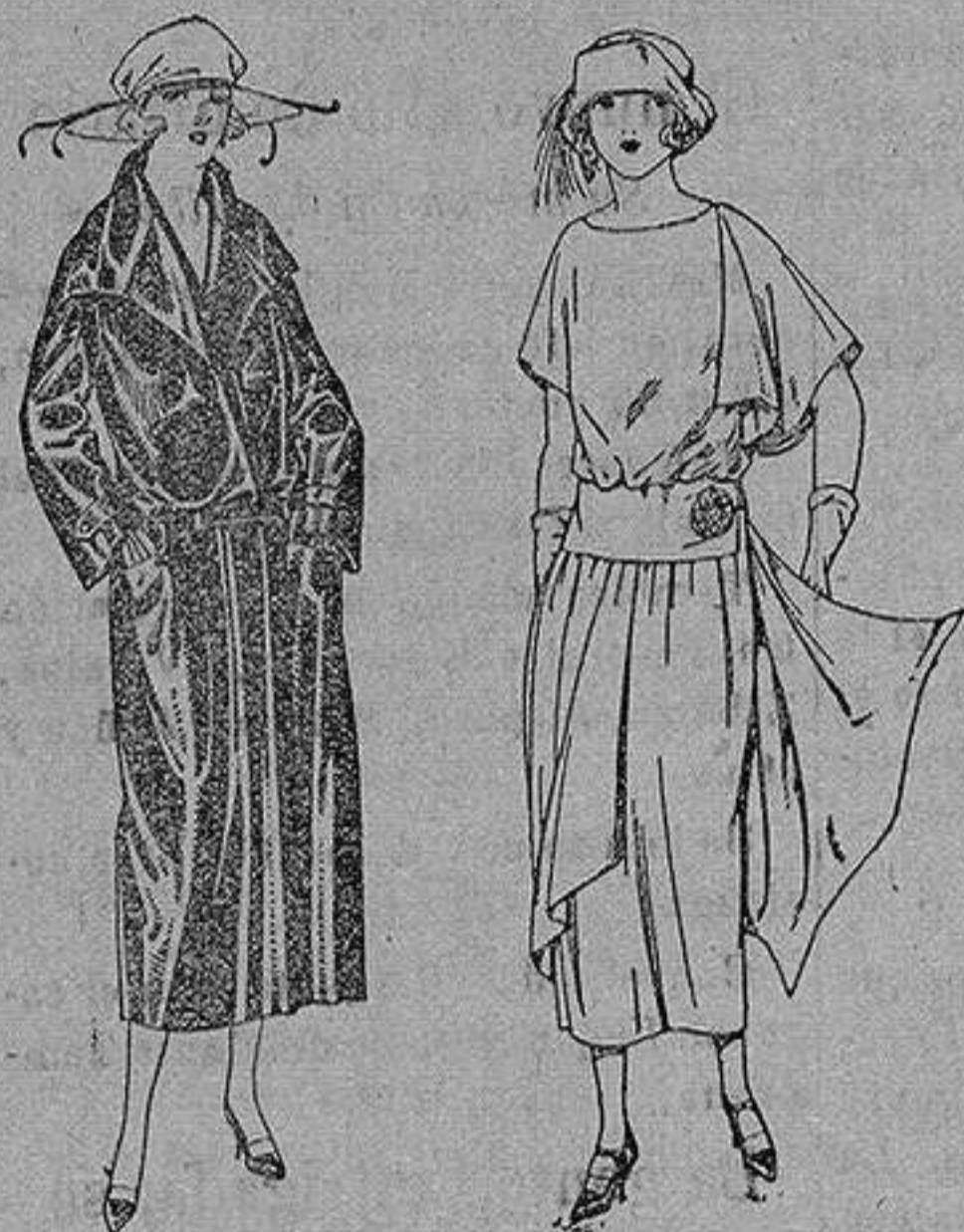
Abrijo de seda impermeables, en negro, azul y color. de ptas. 130 a 225