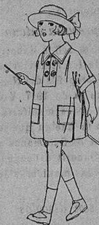
Vestidos de batistablanca, adornos bordados, para niñas de 3 a 6 años de ptas. 6 a 8

Boas, Camisería, Géneros de punto Corbatería, Guantería, Sombrerería Zapatería, Paraguas Bastones y Artículos de Viaje