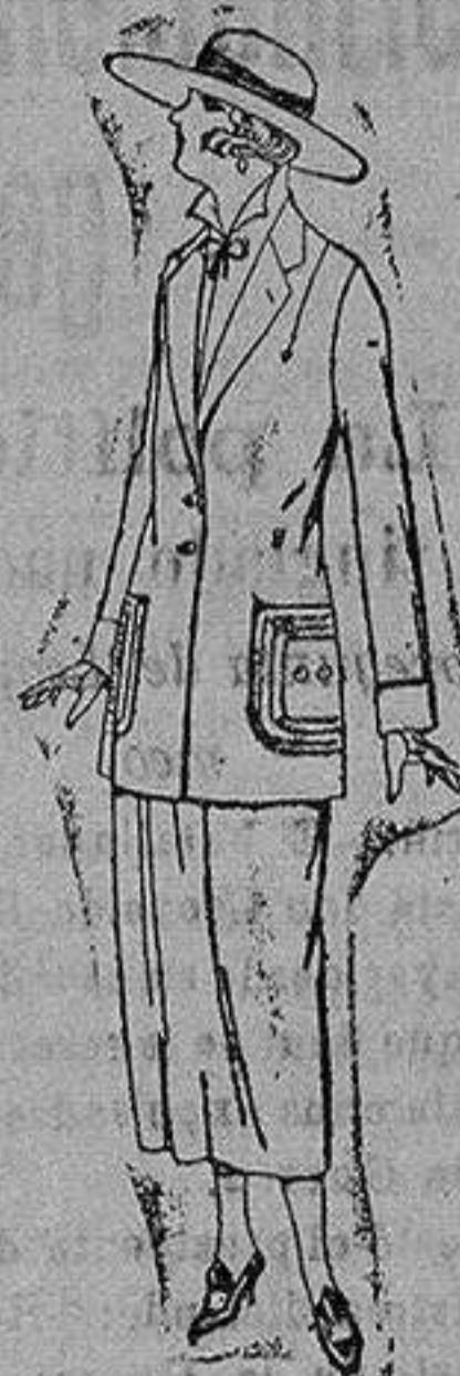
Trajes sastre de popelina gabardina etc. adornos respuntes seda, chaqueta forrada de seda en negro, marrón decolorada moda. de ptas. 120 a 140.