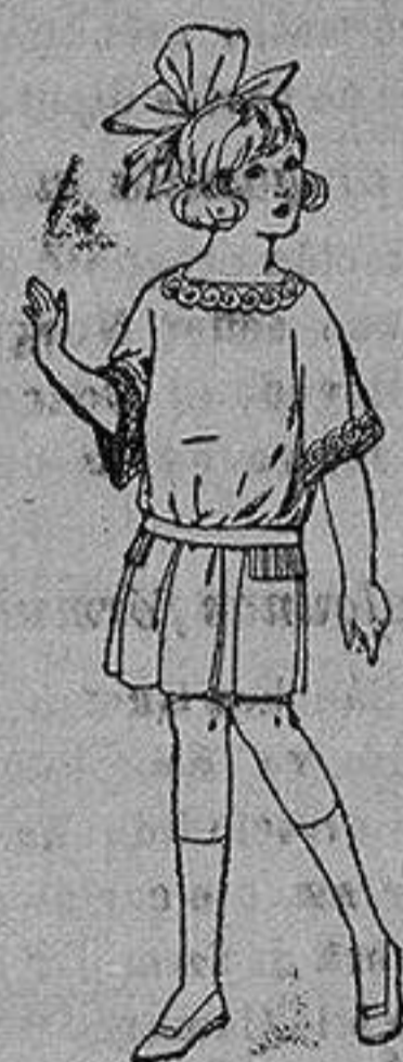
Vestido de sarga popelina inglesa, en azul y colores moda, para niñas de 4 a 9 años. de ptas. 33 a 38

Ropas confeccionadas para ¡Caba- llero, Señora, Niño y Niña