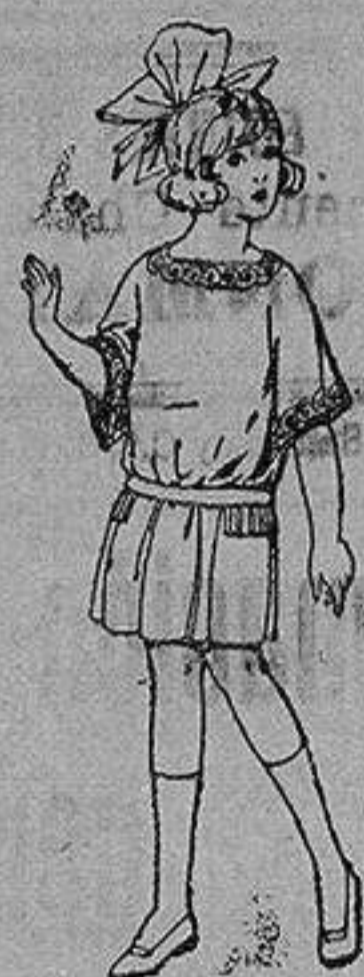
Vestido de sarga papeline inglesa, en azul y colores moda, para niñas de 4 a 9 años. de ptas. 35 a 88

Ropas confeccionadas para Caballero, Señora, Niño y Niña