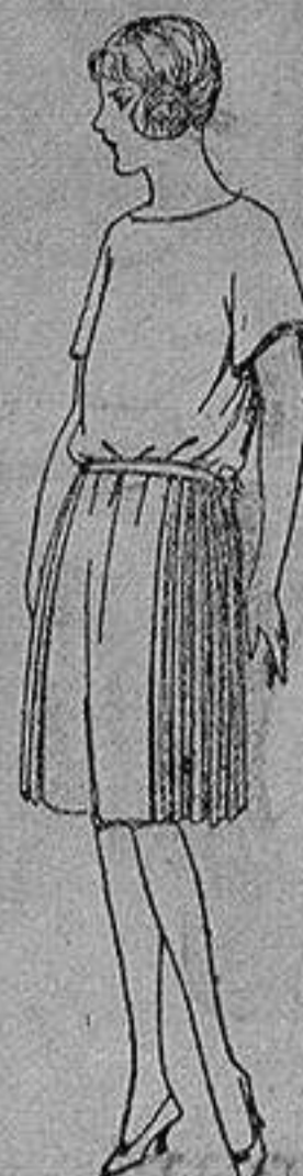
Vestido sarga inglesa gabardina, etc., en azul y color, adorno de pespunte seda. de ptas. 55 a 110