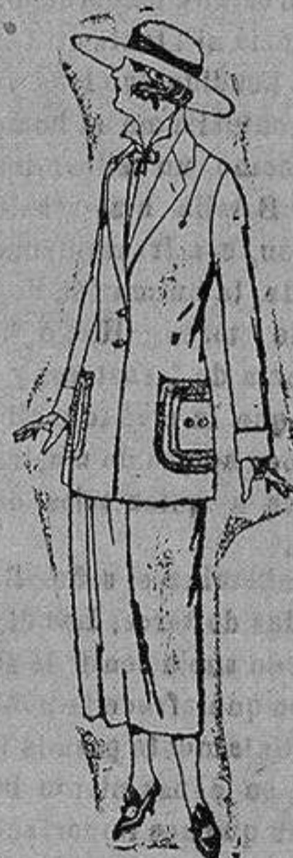
Trajes sastrero de popeline gabardina etc. adorno y pespunte seda, chaqueta forrada de seda en negro, marrón decolores moda. de ptas. 120 a 140.