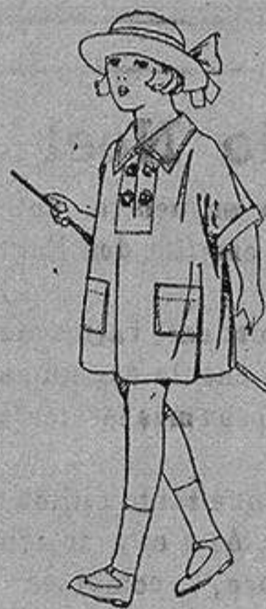
Vestidos de batista blanca, adornos bordados, para niñas de 3 a 6 años de ptas. 6 a 8

Boas, Camisería, Géneros de punto Corbatería, Guantería, Sombrerería Zapatería, Paraguas Bastones y Artículos de Viaje