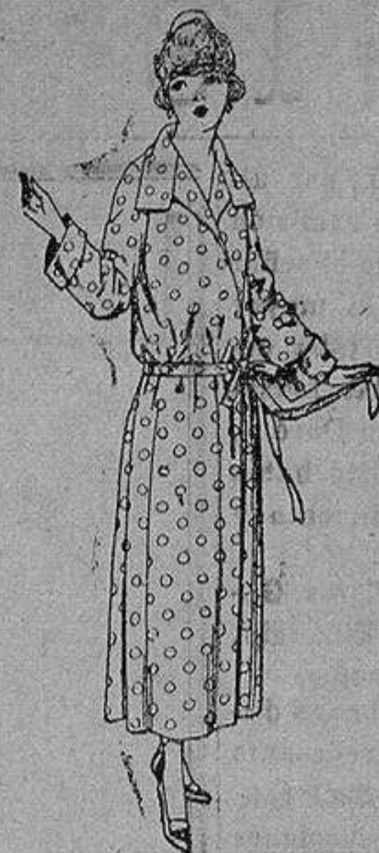
Batas de percal, voile listado, etcétera. de ptas. 16 a 28