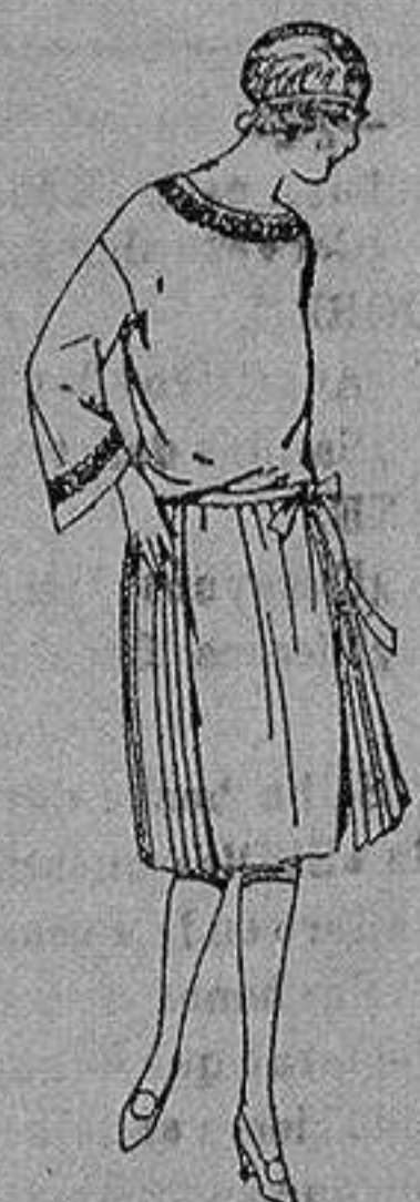
Vestidos de papeline, sarga, etc., en azul y color adornos bordados para jovencitas de 13 a 15 años. de ptas. 60 a 78