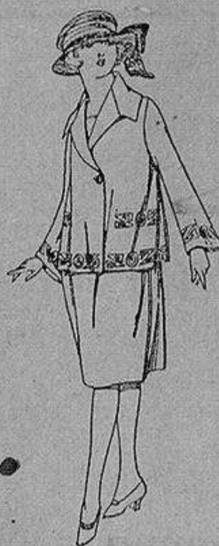
Vestido gabardina sarga inglesa etc. en azul y color, adornos bordados para jovencitas de 13 a 15 años de ptas. 98 a 100