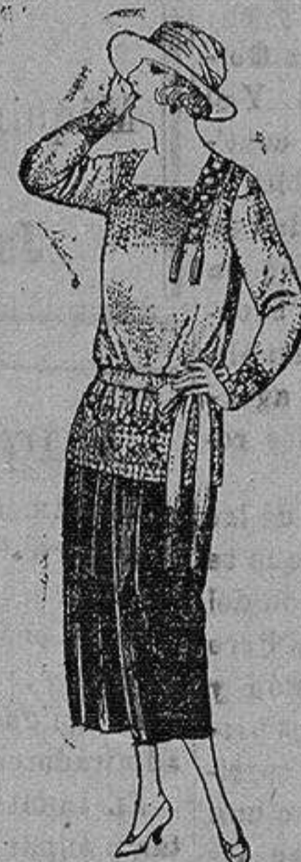
Paletots de punto de lana, en negro y colores. de ptas. 23 a 110