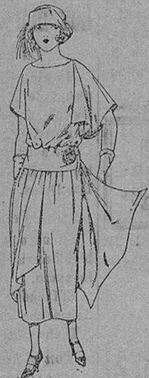
Vestido de crepón de china, en negro, azul y colores moda, adornos bejillas de metal. de ptas. 185 a 160