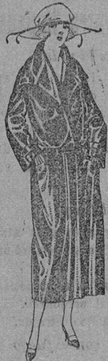
Abrijo de seda impermeables, en negro, azul y color. de ptas. 130 a 225