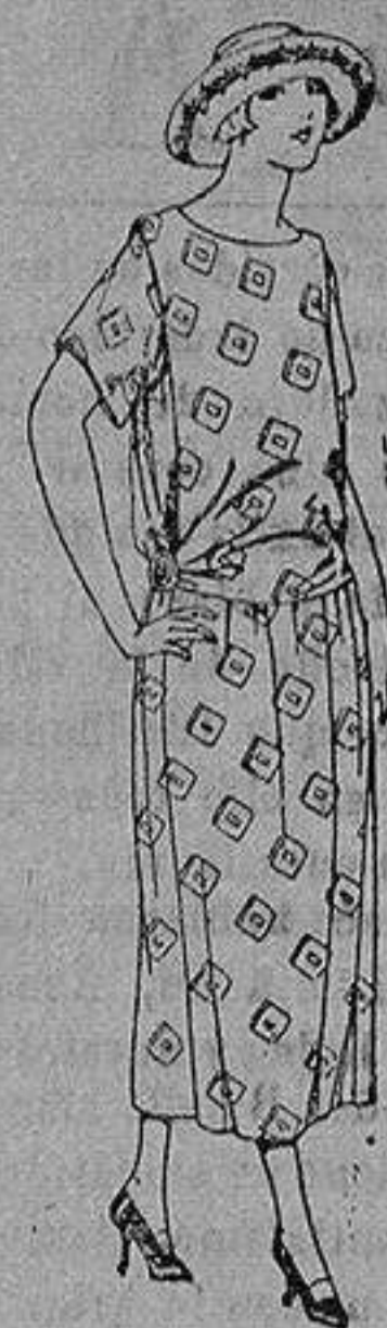
Vestido de foulard de la godón dibujo fantasía. de ptas. 35 a 50