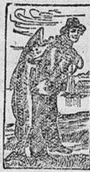
Marca de fábrica.

no descuidar un catarro pues puede ser precursor de pulmonías, de la Tisis, ó de otras graves enfermedades. La Emulsión de Scott cura el catarro, sana la irritación de la garganta y los pulmones, fortifica y robustece el organismo. Es una combinación de los dos agentes curativos, aceite de hígado de bacalao ó hipofosfitos, reconocidos universalmente por los médicos como los más poderosos en las enfermedades extenuantes y especialmente para los Niños. Exijase la legítima