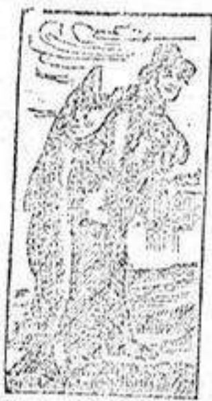
Marcas de fábrica.

no descuidar un catarro pues puede ser precursor de pulmonías, de la Tisis, ó de otras graves enfermedades. La Emulsión de Scott cura el catarro, sana la irritación de la garganta y los pulmones, fortifica y robustece el organismo. Es una combinación de los dos agentes curativos, aceite de hígado de bacalao ó hipofosfitos, reconocidos universalmente por los médicos como los más poderosos en las enfermedades extenuantes y especialmente para los Niños. Exijase la legítima