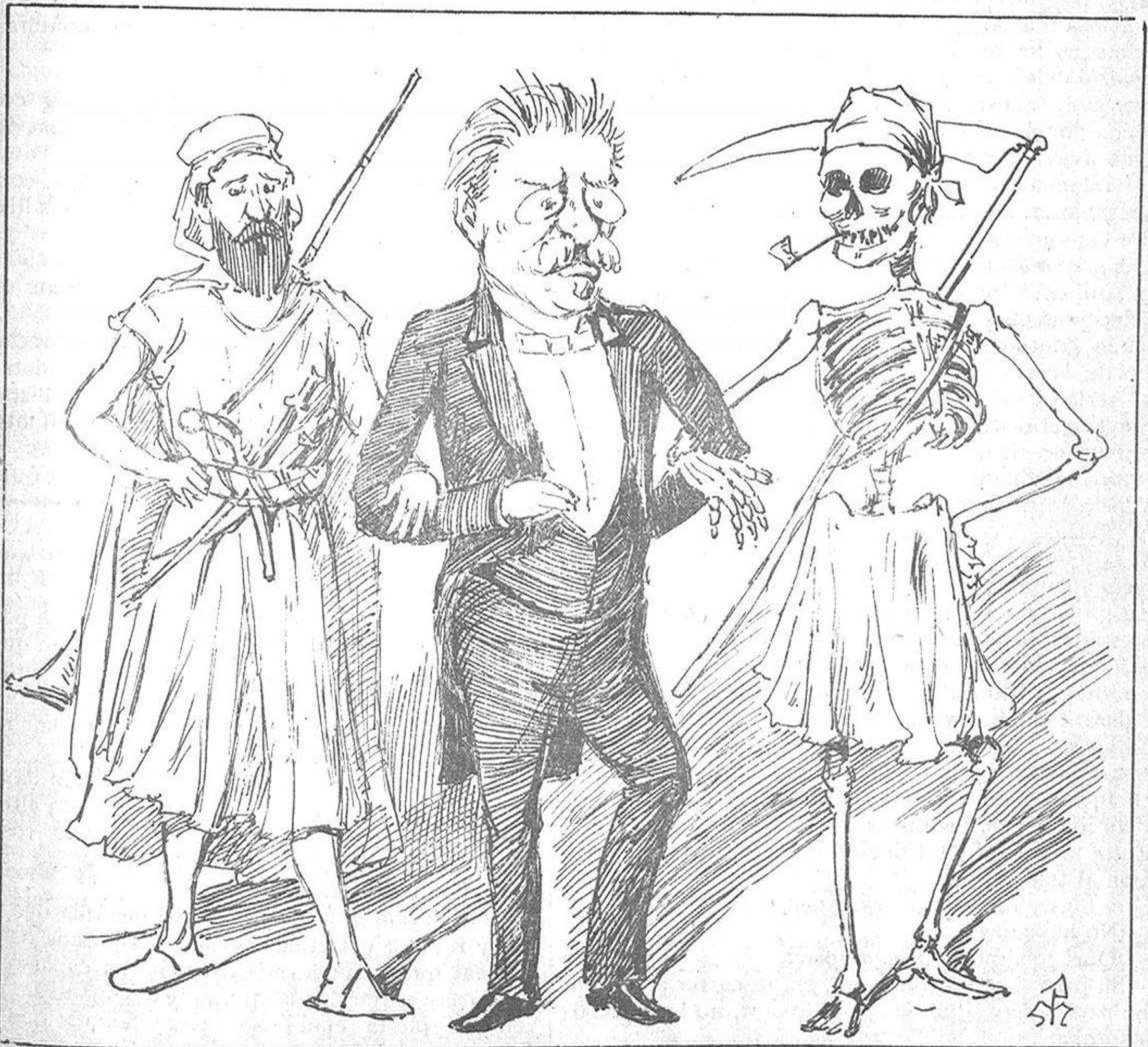
LAS TRES PLAGAS