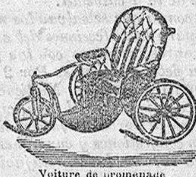
Voiture de promenade avec ou sans tablier et capote