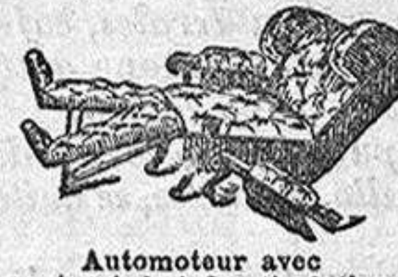
Automoteur avec porte-pieds à 2 articulations