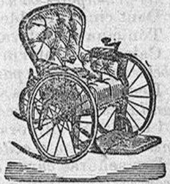
Fauteuil à grandes roues caoutchoutées Mu par 2 manivelles