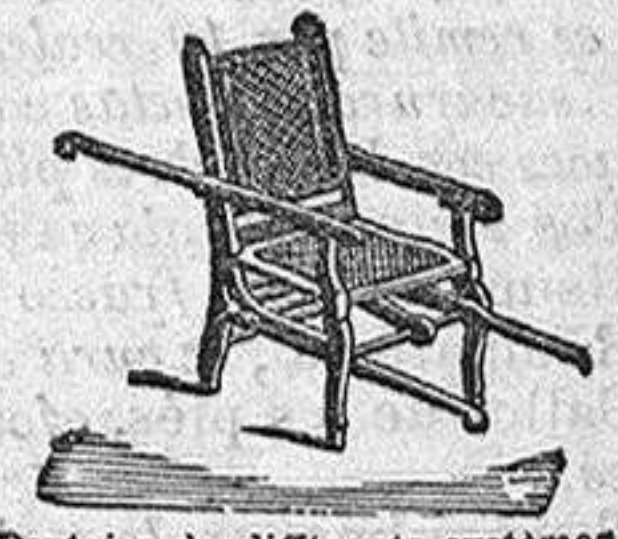
Portoires de différents systèmes

Envoi Franco du Catalogue illustré sur demande affranchie.