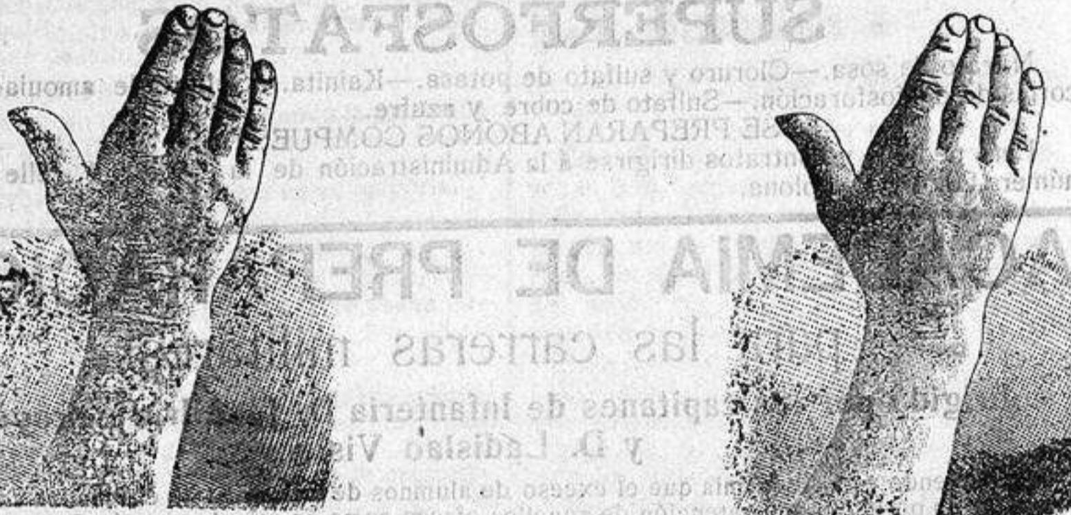
Antes de la curación Después de 15 días de tratamiento

DESCUBRIMIENTO SENSACIONAL Curación de las enfermedades de la piel y también de las llagas de las piernas