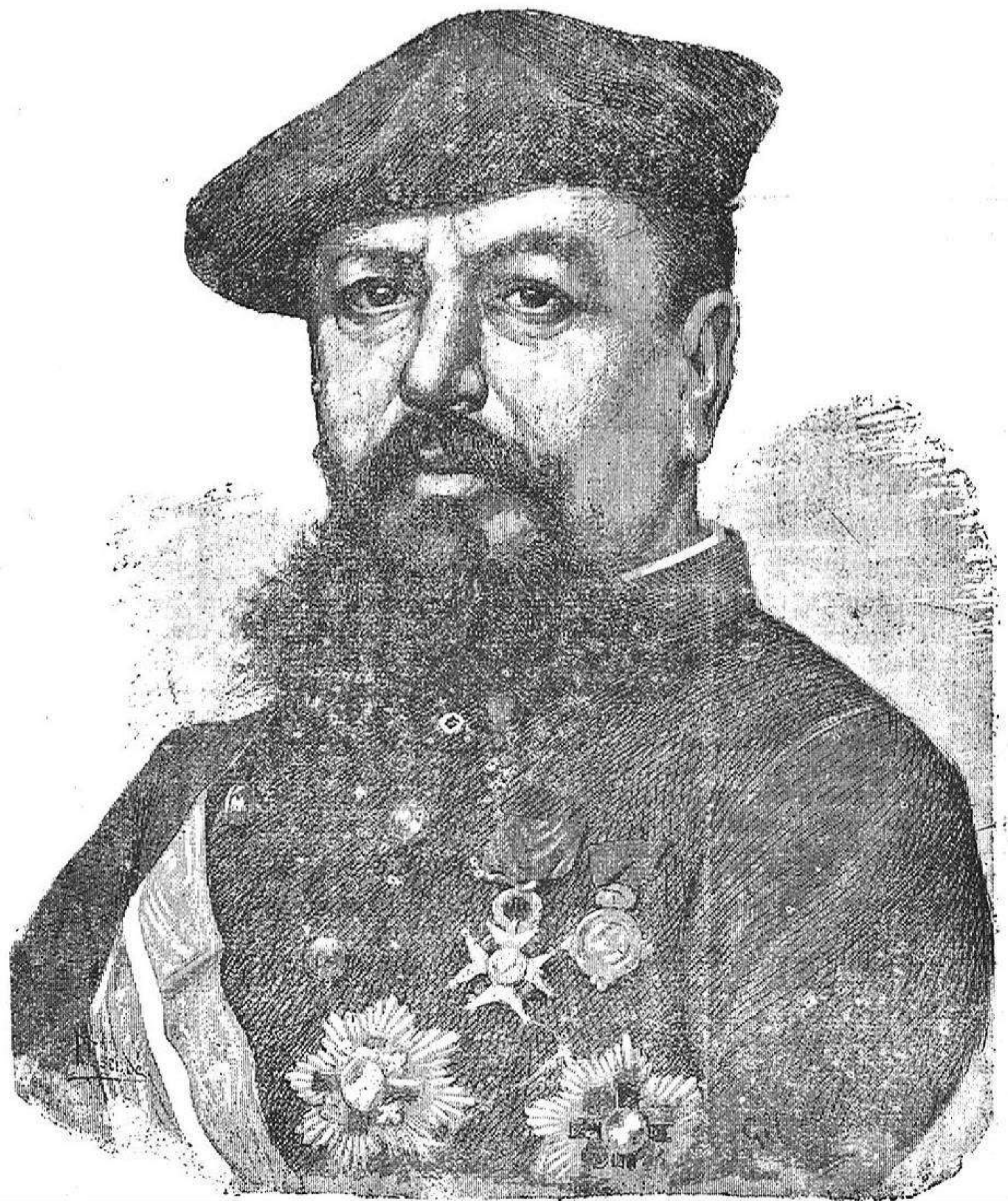
El general Cavero

Alégris, Mestre aymat; gosi alegría, que l'hora benhaurada ja s'atansa y podrém ovirar la nostra aymia gosant lo qu'era avants, sols esperansa.