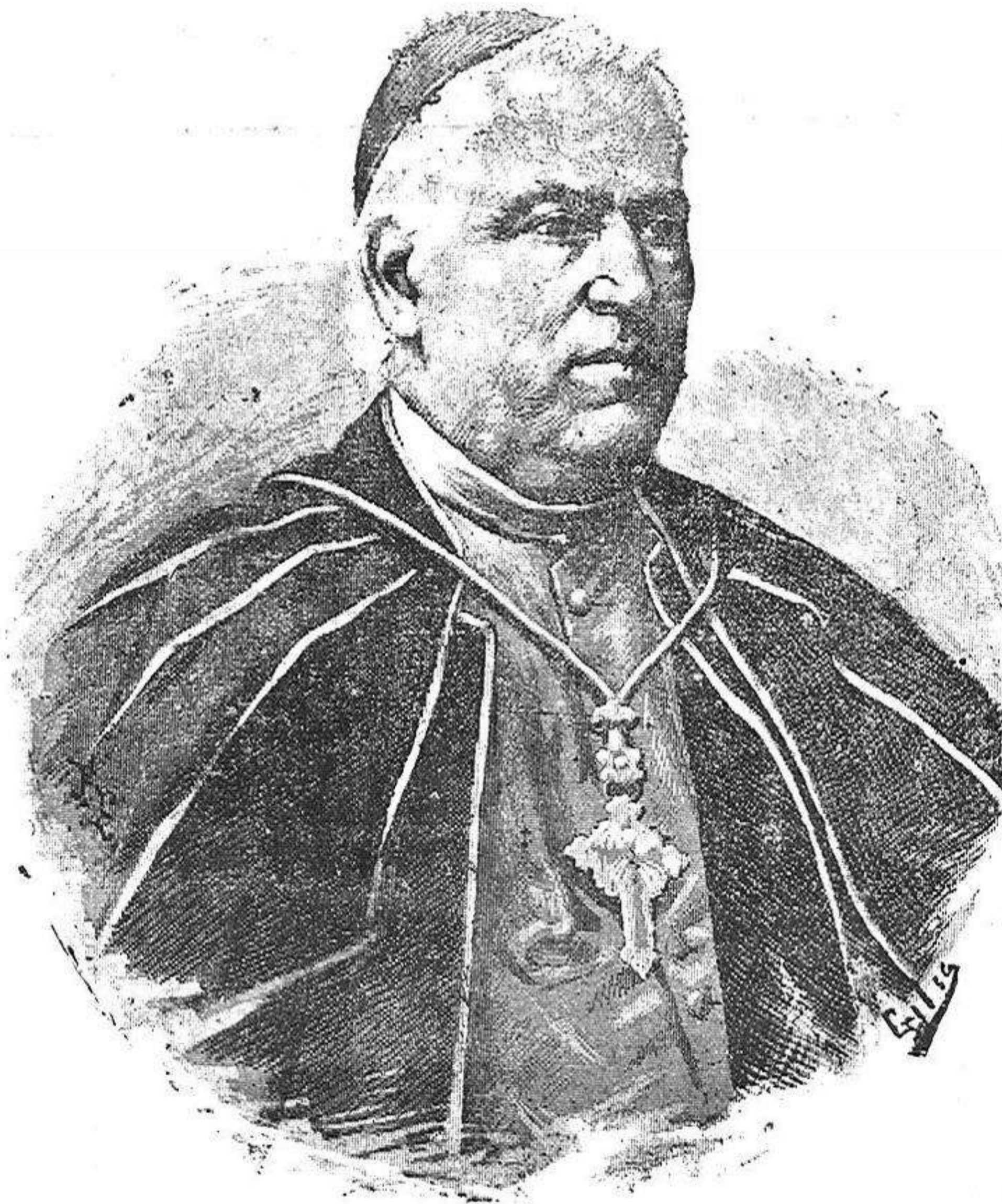
Excm. é Ilm. Sr. Dr. D. Joseph Caixal

Nasqué en 9 de Juliol de 1803. † en 26 d'Agost de 1879.