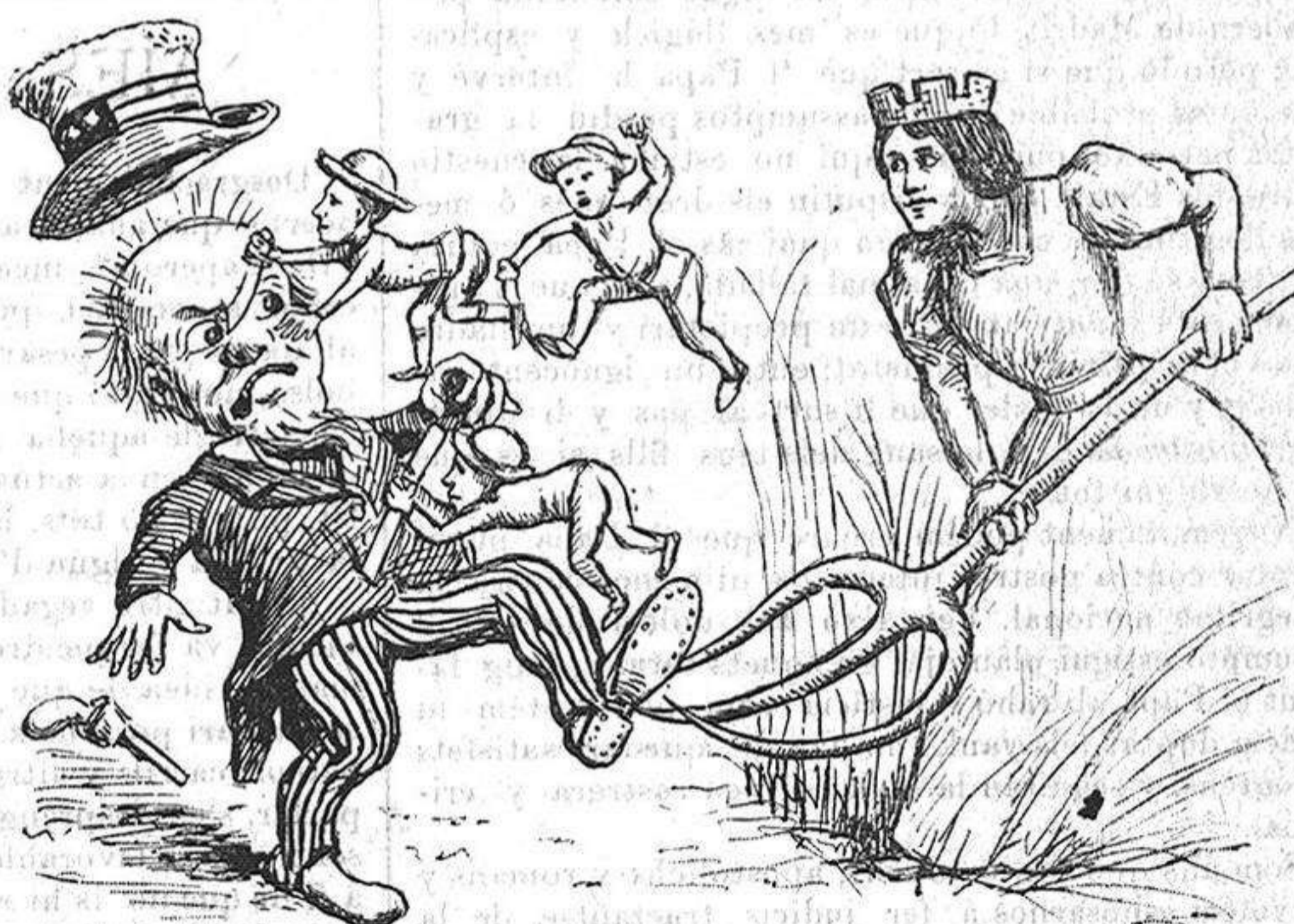
Si Espanya 'ls dona una empenta, Deu t' ampari, oncle Sam....!