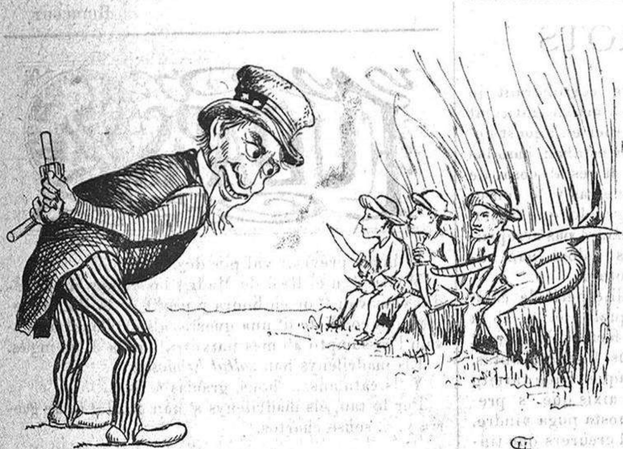
—Ustedes ser cuatro gatos medio esmortuidos de fam.....

Administració: Fontanella, 5, entressol, 1. a — La correspondencia al Administrador