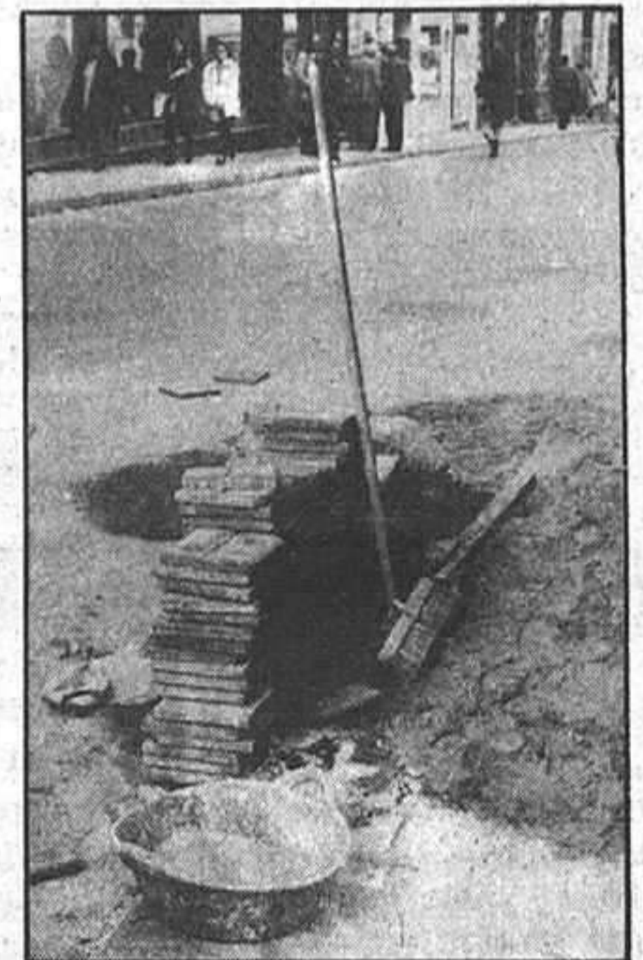
Una vez concluidas estas obras, se asfaltarán la plaza de Santa María.

El barrio del Alamián también está siendo objeto de acondicionamiento de carreteras y acerado, habiéndose procedido a levantar el acerado que se encontraba en mal estado, desde el puente hasta la torre del Alamián, que coincide con el número 26 de la calle. La parte izquierda de la calzada está prácticamente acerada, habiéndose vertido ya el conglomerado asfáltico.