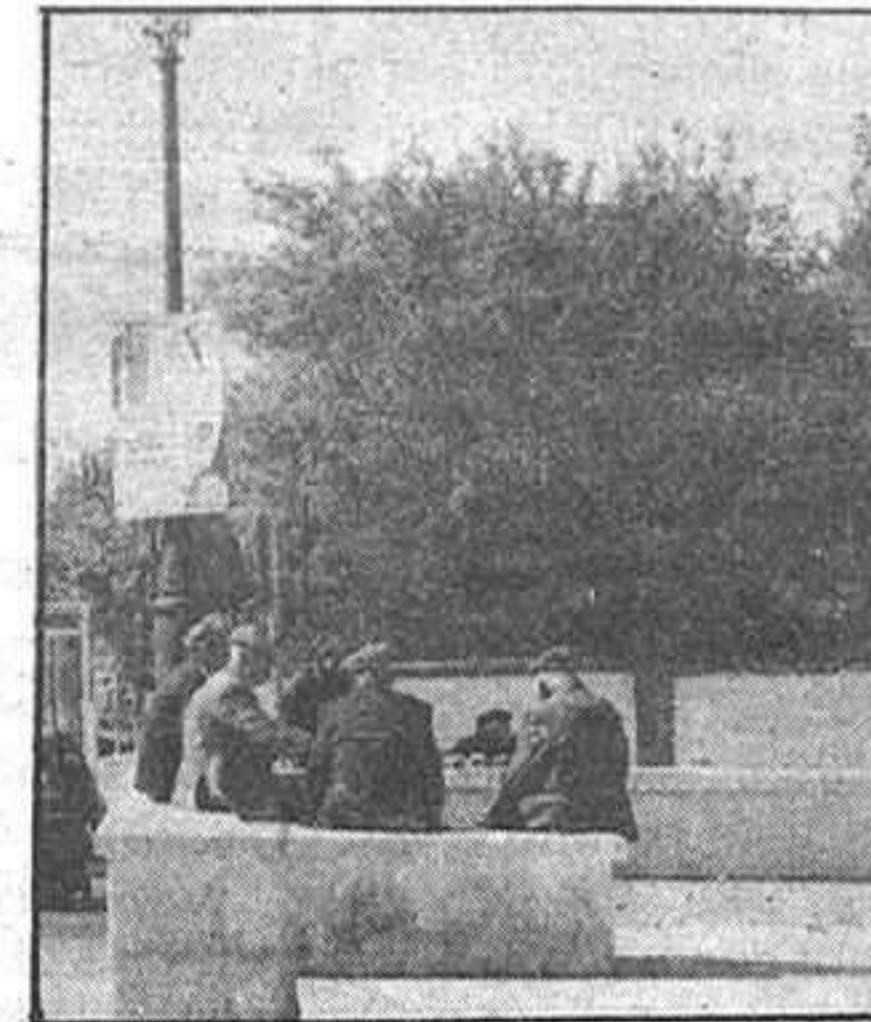
La participación de los ancianos en actividades para la Tercera Edad se reduce a un 10 por 100, y siempre de forma simplemente receptiva.

Siguiendo su intervención, informó que Guadalajara es una