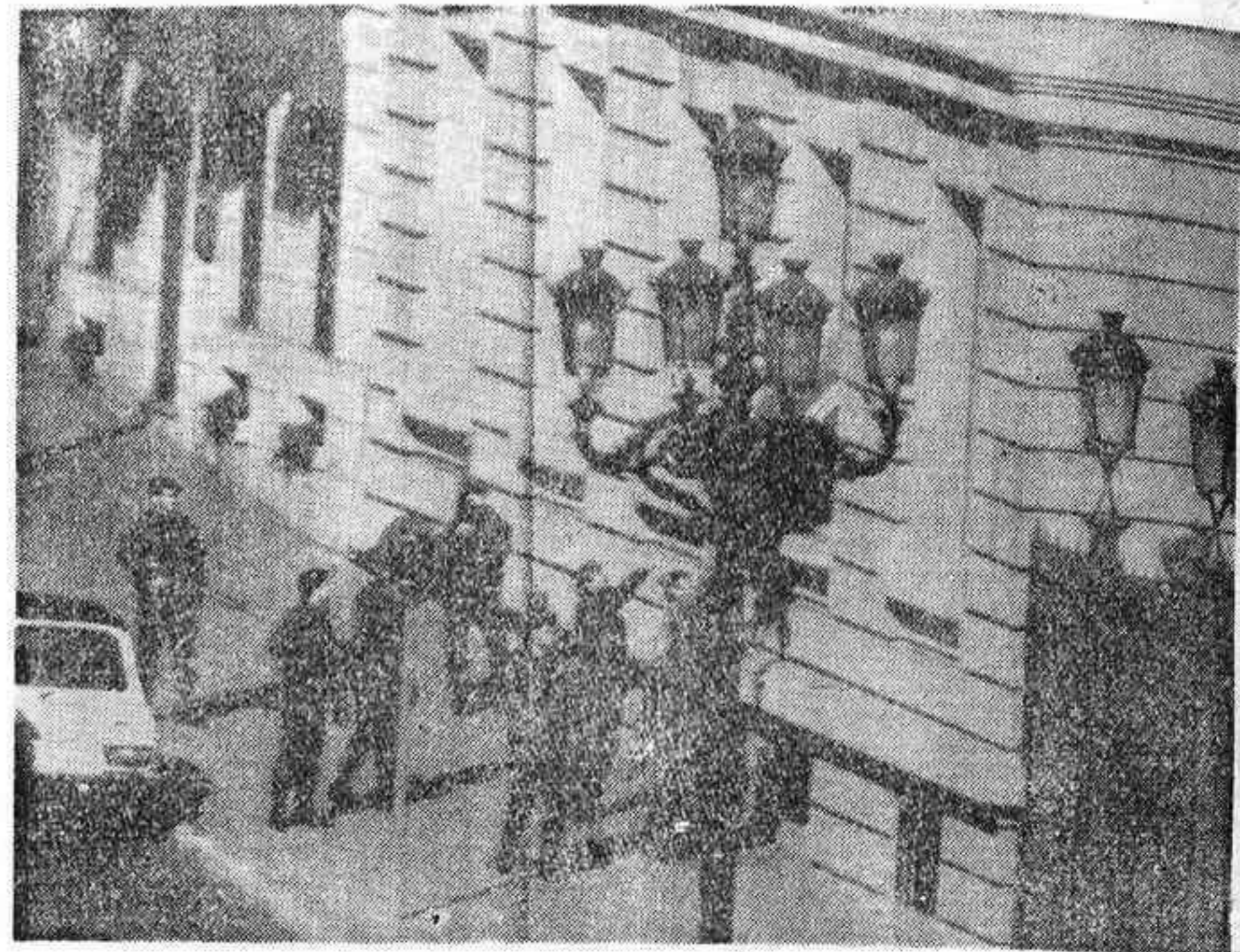
Varios guardias civiles saltan por la ventana de la sala de prensa y se entregan a la Guardia Civil.

El señor Abril Martorell tenía la radio escondida y facilitaba información a sus compañeros de cuando en cuando.