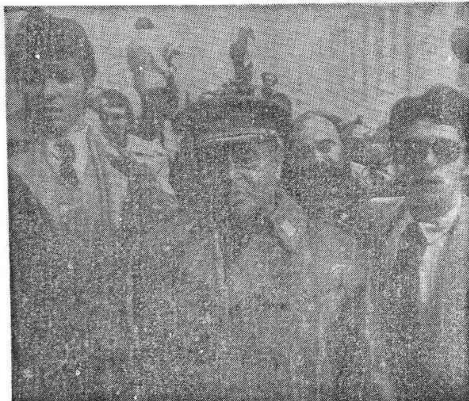
El Director General de la Guardia Civil General Aramburu Topete a su llegada a la Carrera de San Jerónimo, donde inspeccionó la zona, durante algunos minutos.

No sería justo, a la hora de hacer el balance de estas angustiosas diecisiete horas, omitir la valentía y la serenidad de un Rey que ha hecho valer su magisterio, dando una lección de patriotismo y de fortaleza. Una lección que este país no debe olvidar nunca.