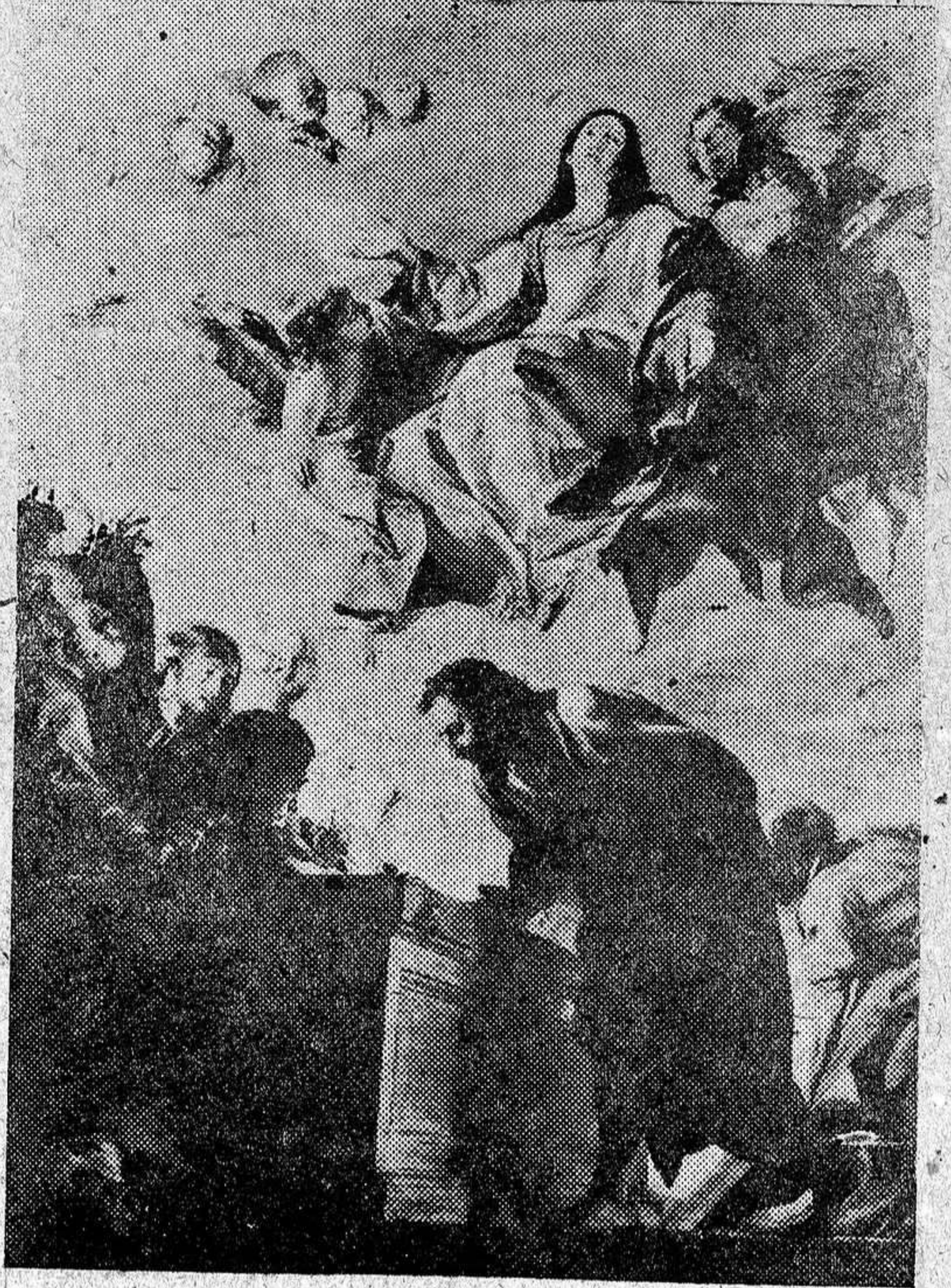
15 de agosto. Día de la Asunción de la Virgen. Cuadro de Cerezo, que figura en el Museo del Prado. Guadalajara ha jurado defender y propagar este sacrosanto misterio, que ha sido propuesto al Papa Pío XII para su declaración como Dogma de fe por la Acción Católica Española.