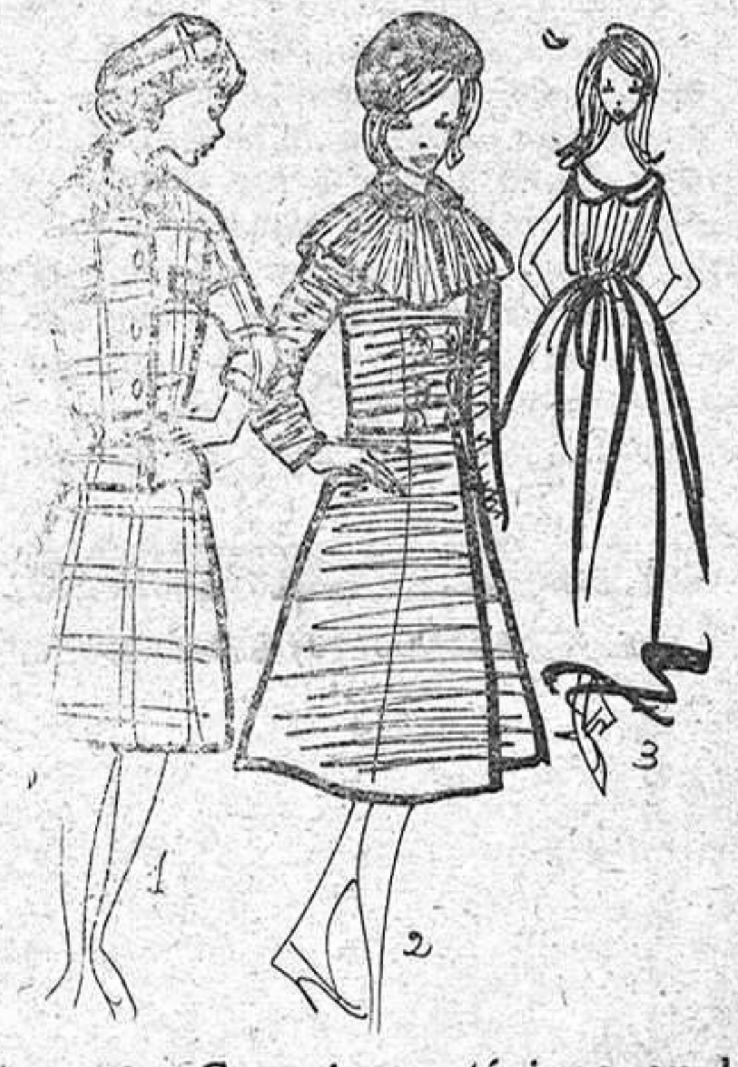
1, 2, 3. Creaciones típicas en la colección de Coco Chanel. Boina y traje chaqueta en escocés rojo y blanco, con cintura en su sitio (1). Abrigo púrpura con pelerina, cuello y botones de terciopelo en azul marino (2). Muselina blanca con cintura de satén azul cielo (3).

gro drapeados a lo sultana o sujetos con una rosa a lo Poiret, los larguísima trajes chaqueta-tubo, las plumas y los moños sobre todo, sensacionales y audaces. Hay moños de 15 a 20 centímetros de altura en las formas más diversas, adornados con tules, plumas y joyas, y todo... creación del genial Alexandre.