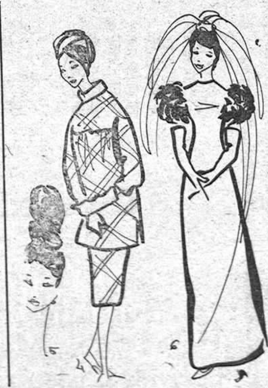
4, 5, 6. De la colección de Yves Saint Laurent. Blusón normando en escocés marrón y negro (4). Uno de los altísimos moños que Alexandre creó para los maniqués de Saint Laurent (5). Traje de novia delicioso realizado en satén con mangas sustituidas por plumas de cisne. Guantes larguísima (6).