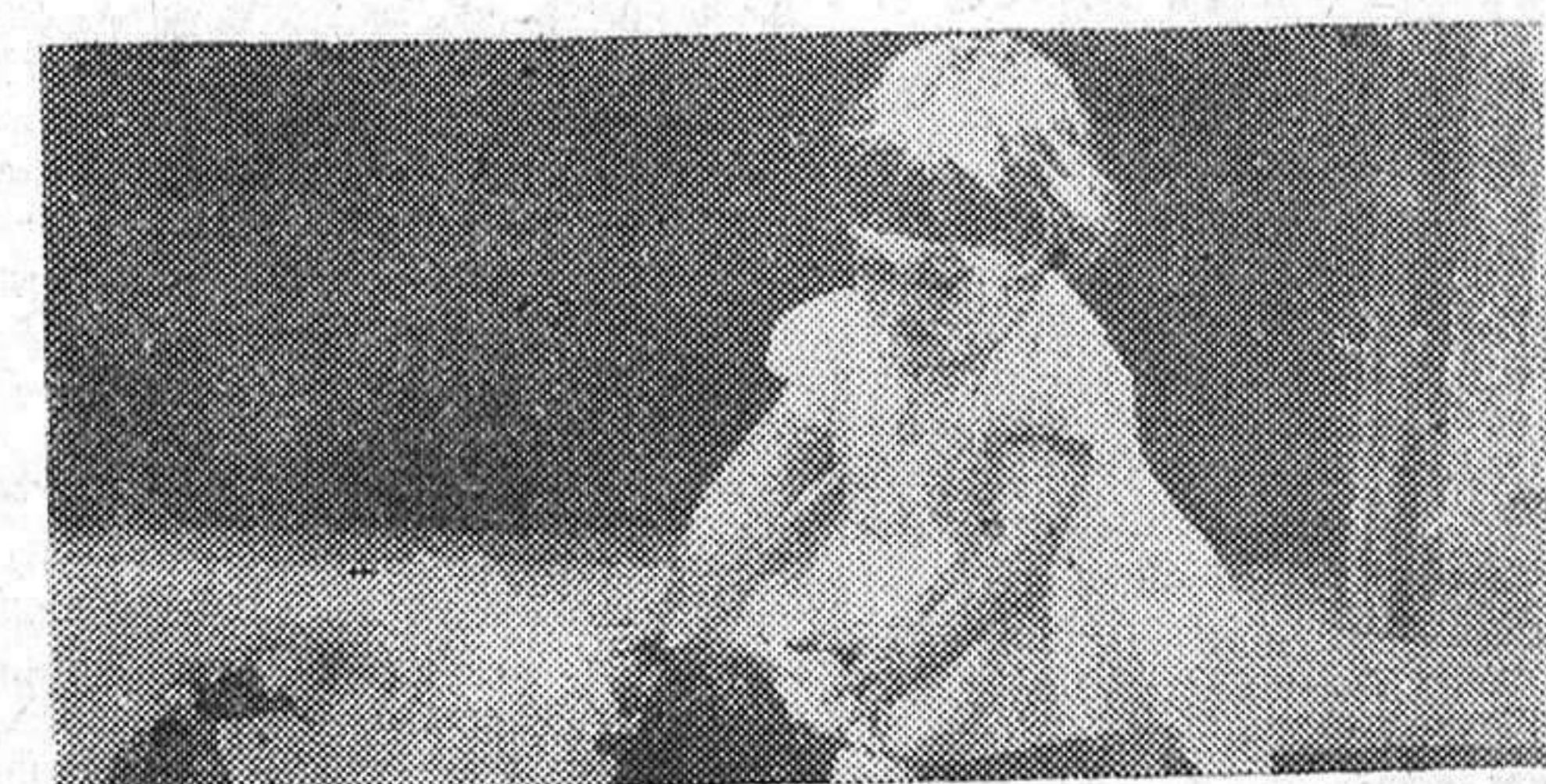
Durante la estancia en Oviedo de los marqueses de Villaverde ha sido captada esta fotografía en la que aparece la nieta del Jefe del Estado en una actitud graciosa y llena de encanto infantil.