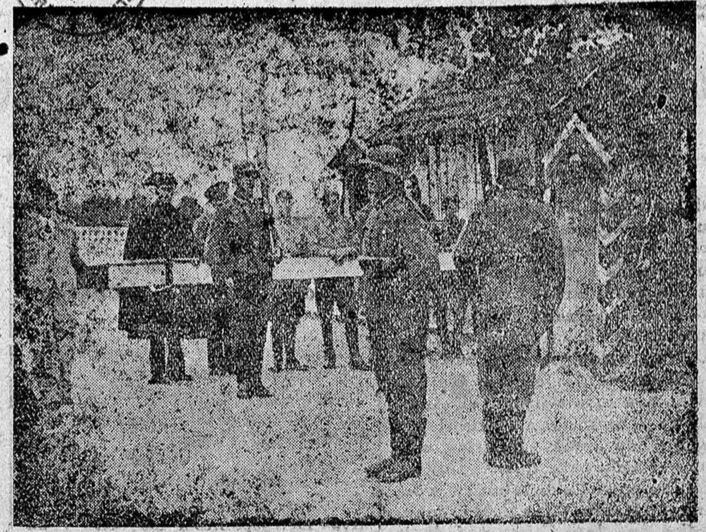
Relevo diario de la guardia alemana en la frontera franco-española.

Esta concesión no alcanza a los oratorios públicos o privados. La asistencia a dicha misa sirve para cumplimiento del precepto del día siguiente festivo.