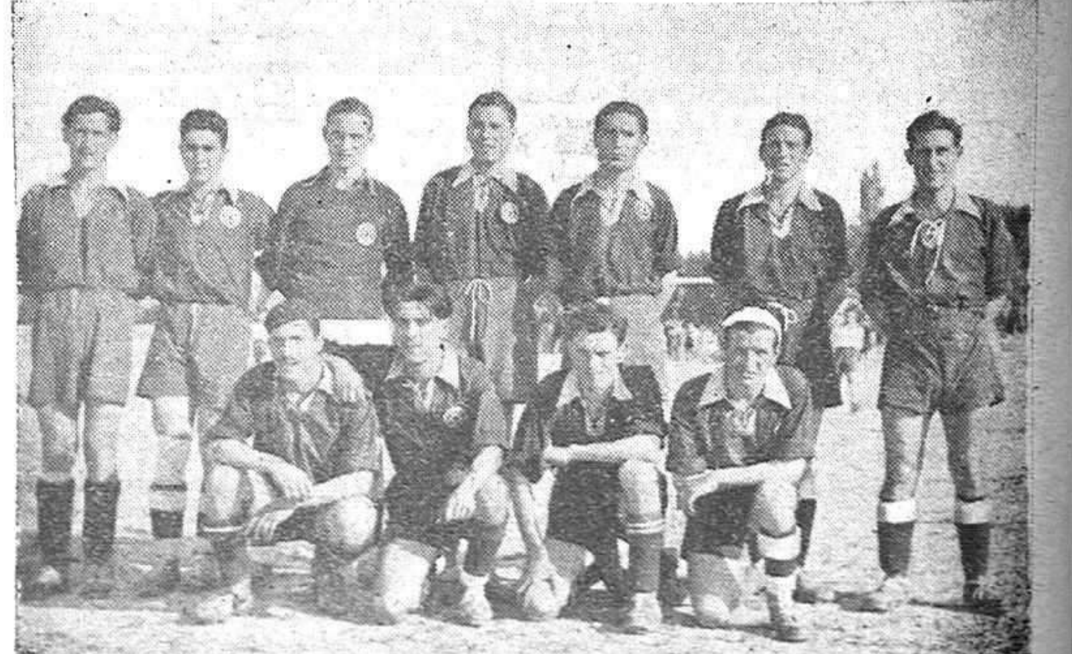
Los futbolistas de "Educación y Descanso".