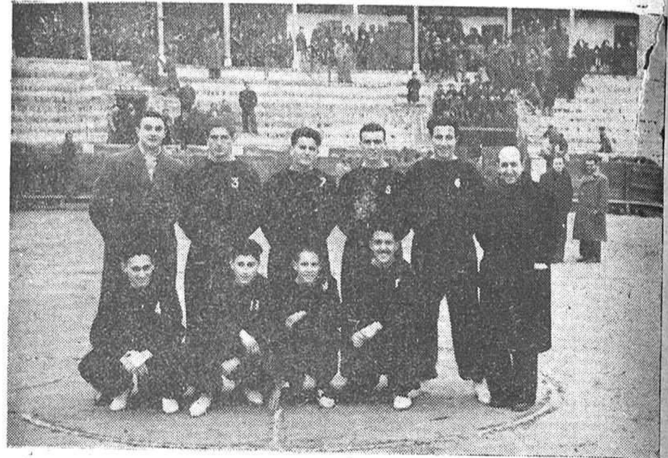
Sonrientes, los muchachos de baloncesto de la Obra posan ante nuestro fotógrafo para NUEVA ALCARRIA.

El estadio de la Obra, que lleva en proyecto cerca de dos años, también se construirá en breve. Su retraso se debe a que ha habido que