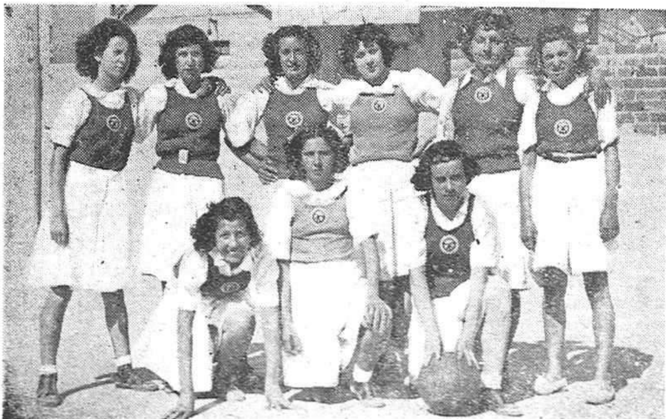
Equipo femenino de baloncesto que venció al I. N. P. de Madrid.