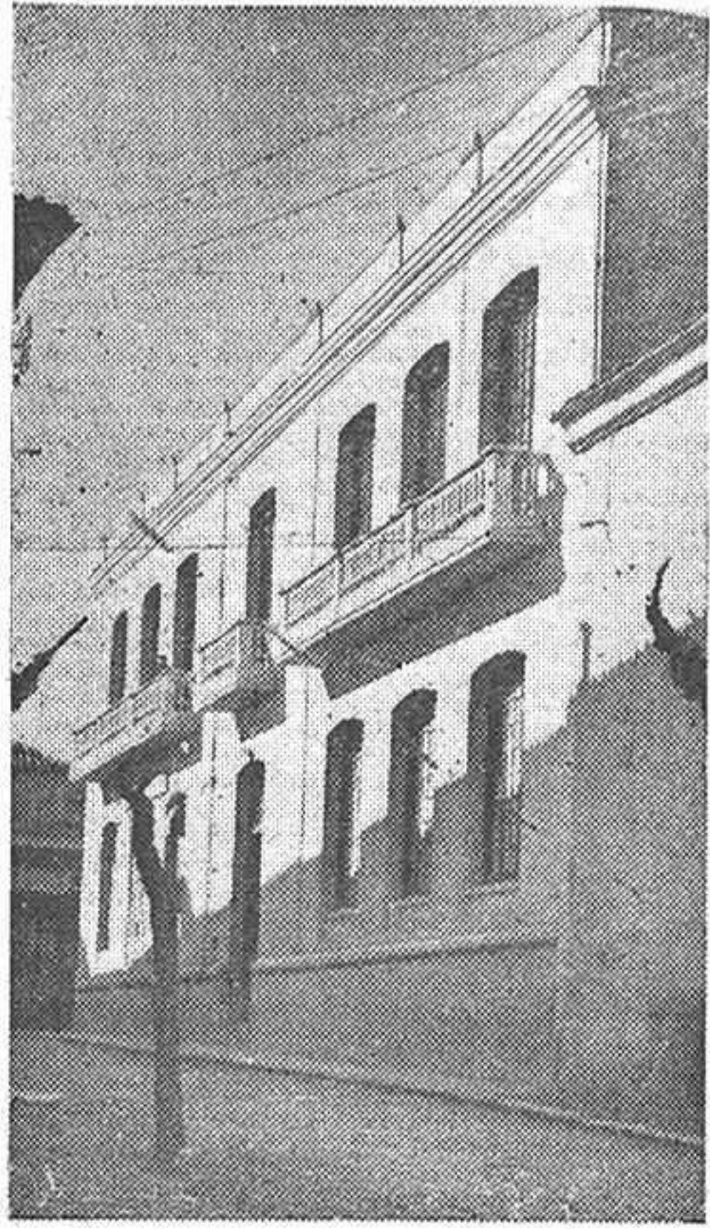
Hogar de la Obra "Educación y Descanso".

Lo fundamental es que la Obra está en marcha, su difusión vendrá se-