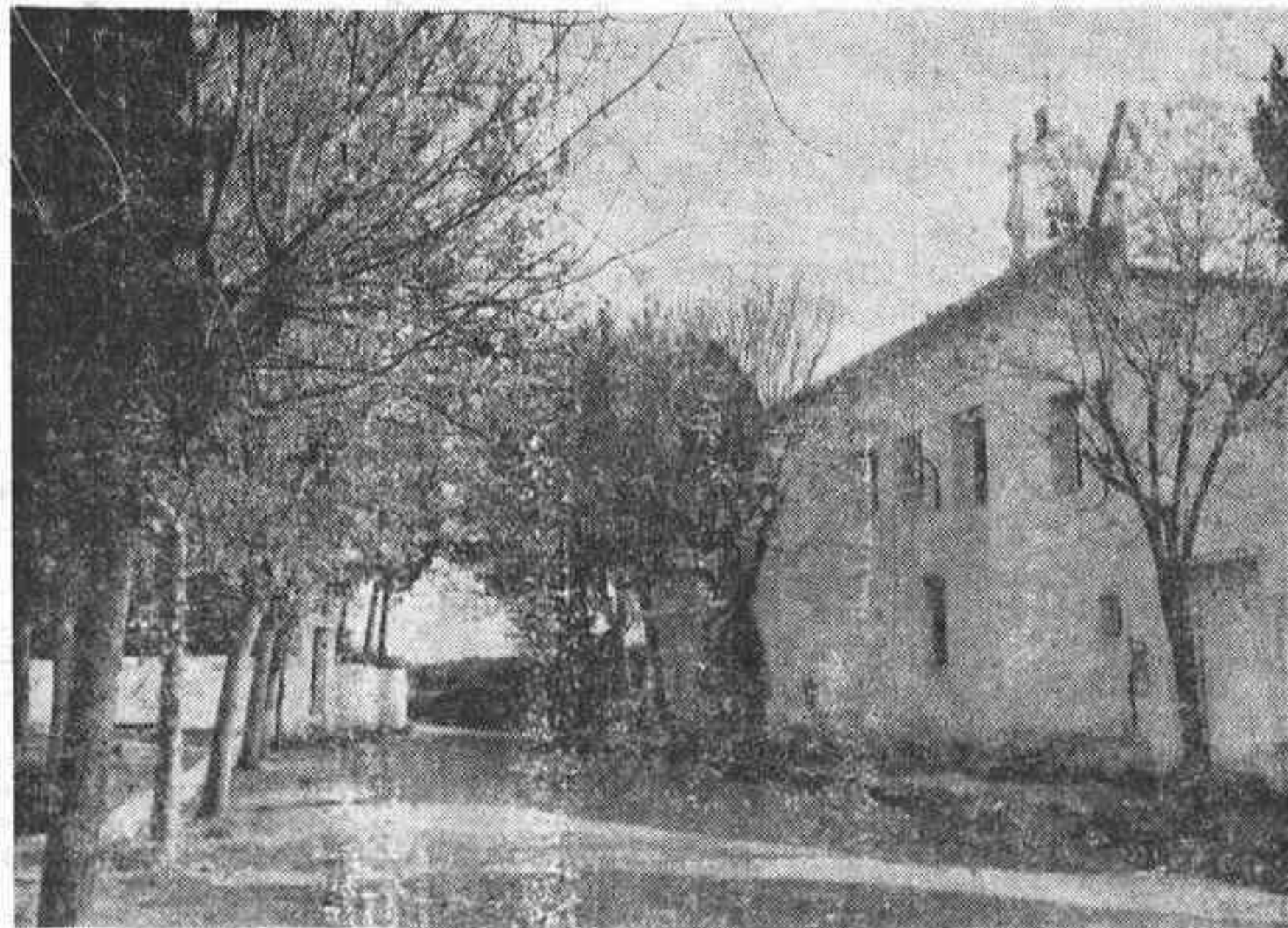
El proyecto de acondicionamiento del Camino Fadrell ha recibido una inyección de 13 millones de pesetas de la Comisión Interministerial de Planes Provinciales.

Importantes acuerdos de la Comisión Interministerial de Planes Provinciales