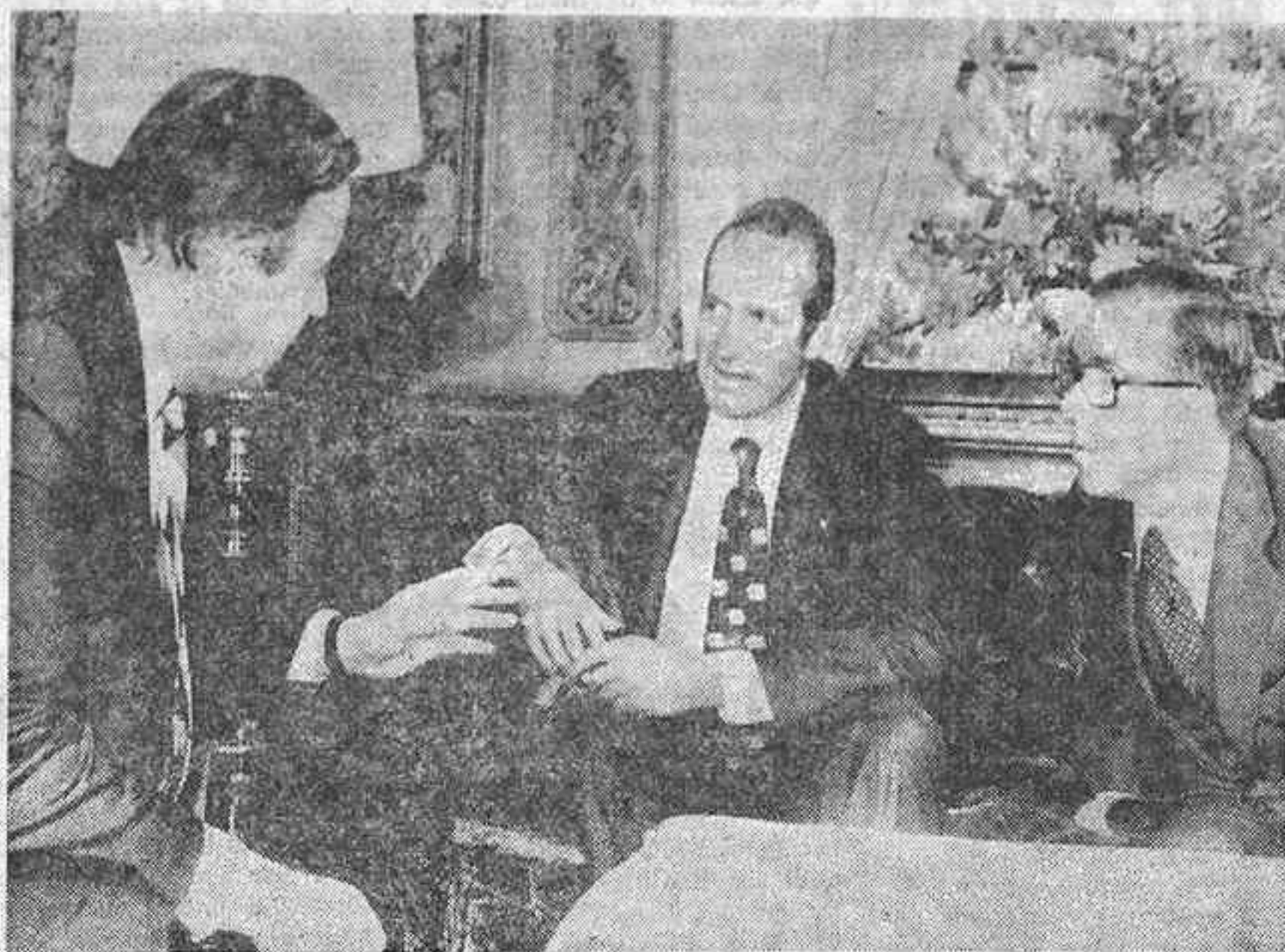
En la primera fotografía, momento de la llegada de los Reyes de España a Bonn, donde fueron recibidos por el Presidente alemán, Walter Scheel y esposa. En la fotografía inferior, la entrevista que don Juan Carlos sostuvo con el Ministro de Asuntos Exteriores, Hans Dietrich Genscher, y a la que asistió el Ministro español, señor Oreja Aguirre.