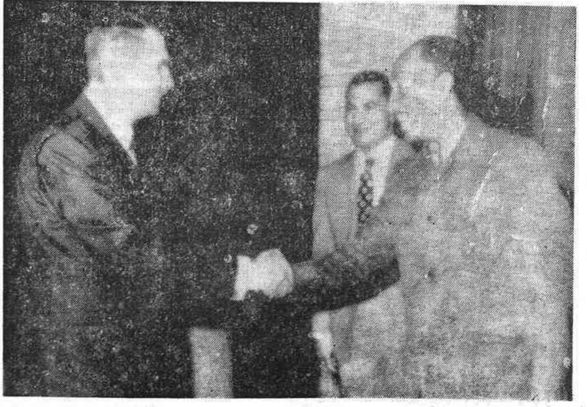
EL CAIRO. — El presidente de Egipto, Anwar Sadat (dcha.) saluda al embajador USA en su país, Hermann Eilts (izq.), mientras el vicepresidente Hosni Mubarak observa. El encuentro tuvo lugar en la casa de descanso de las Pirámides de Giza. Un portavoz del gobierno dijo que las noticias de radio Bagdad sobre un atentado fallido contra Sadat carecían de fundamentos.