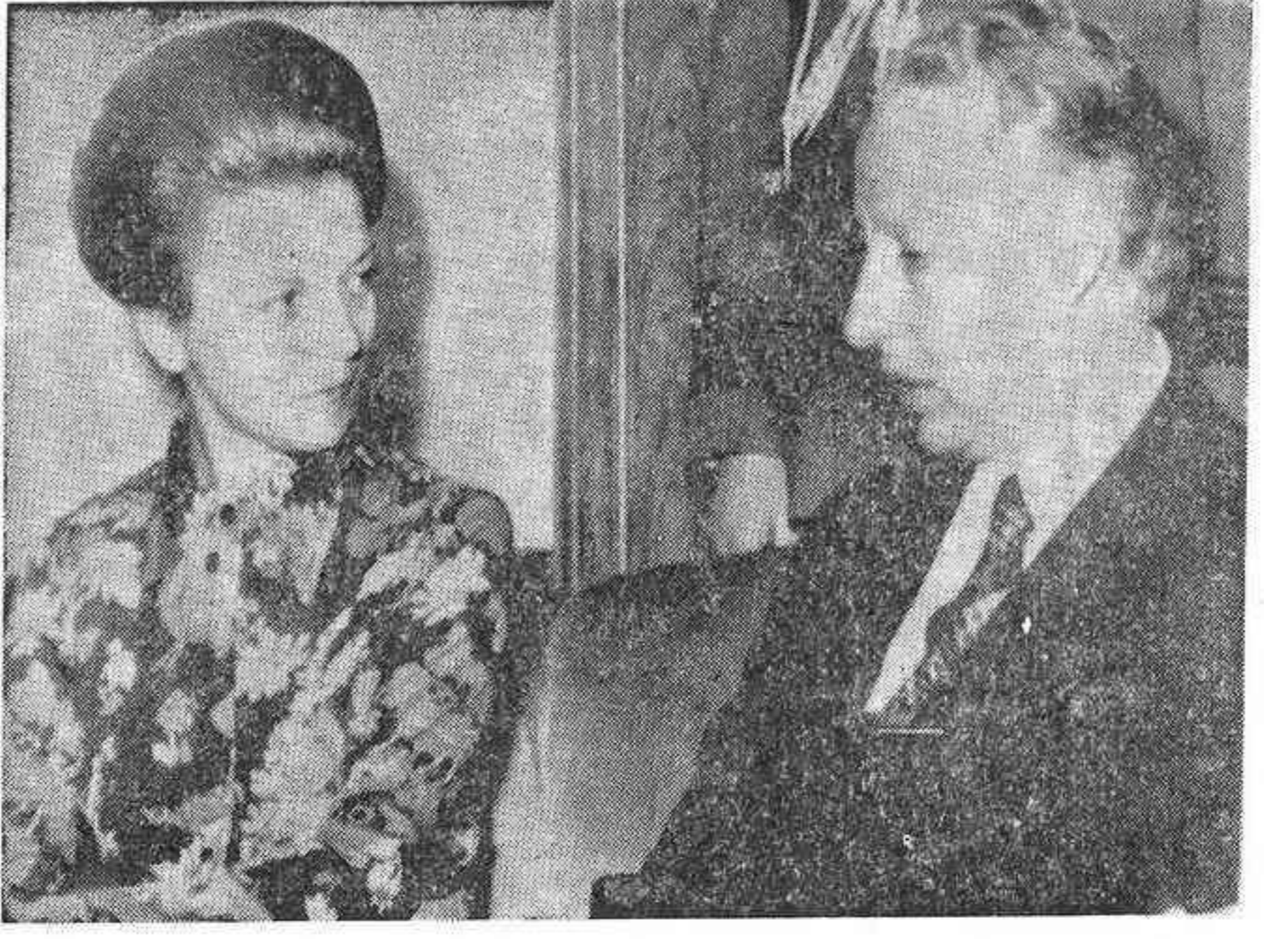
BUENOS AIRES. — La presidenta argentina María Estela Perón delegará temporalmente el poder por cuarenta días para tomarse un descanso. — En la fotografía tomada el pasado julio, María Estela junto con Italo Luder quien ocupará la presidencia interinamente.