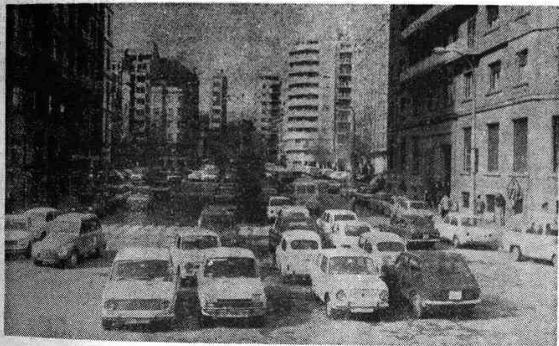
La plaza Huerto Sogueros, permanentemente ocupada por los vehículos estacionados

Su construcción se llevará a cabo en tres fases. La primera corresponde a la zona de Avenida Rey don Jaime situada entre Calvo Sotelo y el cruce con la calle Echegaray. Esta parte del aparcamiento tendrá dos plantas con cabida para 302 vehículos. La segunda fase comprende también la zona de Avenida, desde Echegaray hasta el cruce con la calle Colón. Es la sección más pequeña, también con dos plantas y una capacidad de 267 vehículos. Finalmente la tercera fase se desarrollará en la Plaza Huerto Sogueros. Esta parte del aparcamiento tendrá