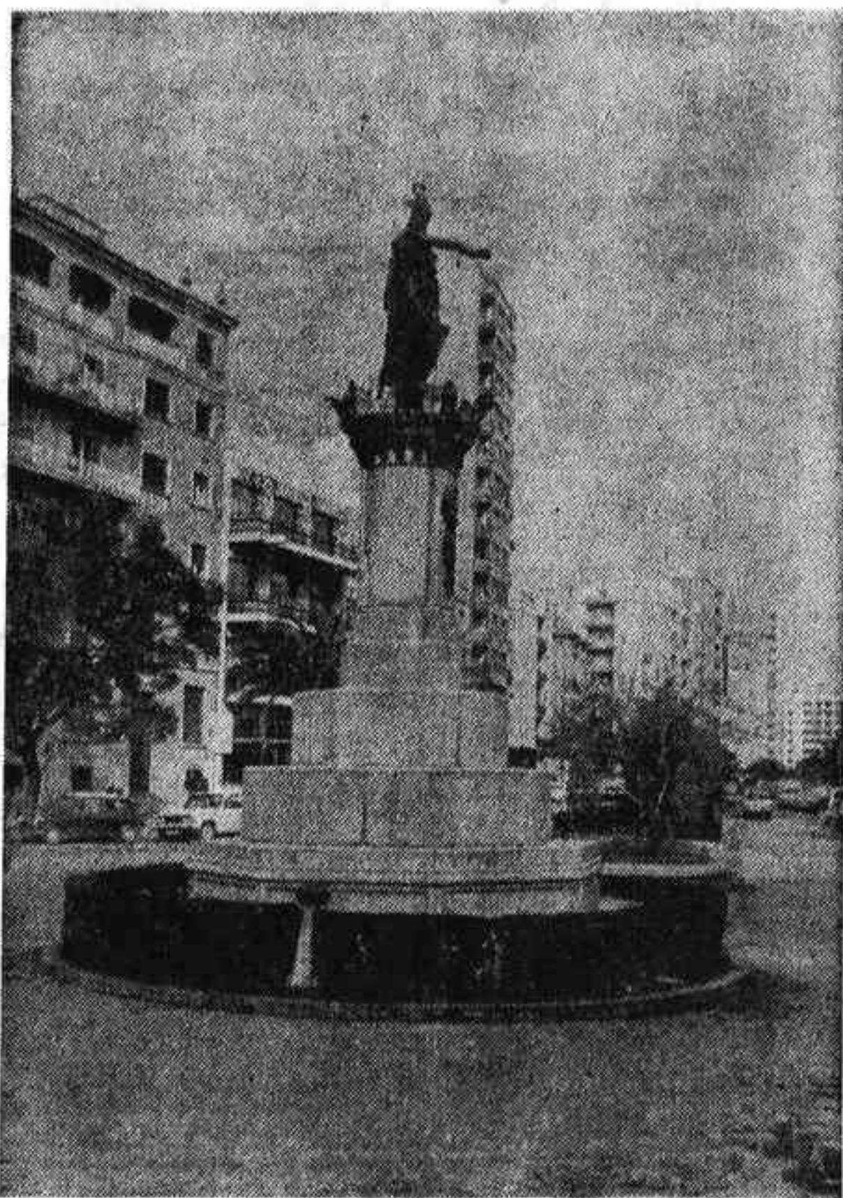
El proyecto modificado por el Ayuntamiento, pretendía mover de su emplazamiento tradicional la estatua de Jaime I

Resulta un poco difícil precisar con total exactitud porque, un proyecto que se debió tramitar con bastante rapidez, dada la necesidad que tiene nuestra capital de plazas de aparcamiento, sobre todo en la zona de Huerto Sogueros, donde se concentraban dependencias tan visitadas como el ambulatorio de la Seguridad Social y la Delegación de Hacienda, está atravesando los distintos trámites administrativos con la lentitud por todos conocida. Pero en líneas generales pueden resumirse en dos grupos. De una parte figura la poca prisa que demuestra la