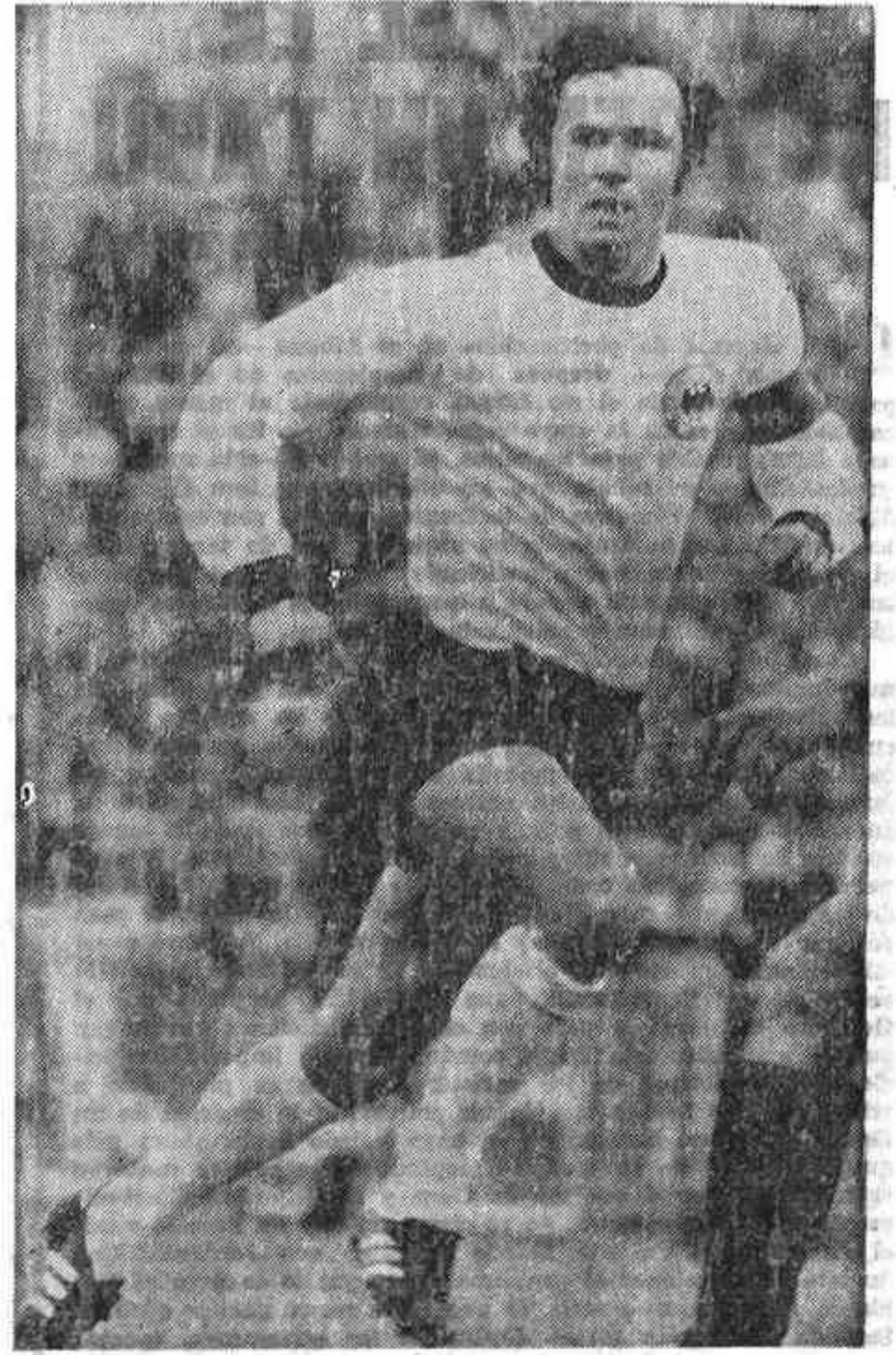
MUNICH (DaD).—El "kaiser" o "emperador" del fútbol alemán, Franz Beckenbauer, capitán de la selección nacional y del Bayern de Munich, tricampión europeo, ha sido elegido en París, por segunda vez, por periodistas deportivos de 28 países, el mejor futbolista continental del año 1976.