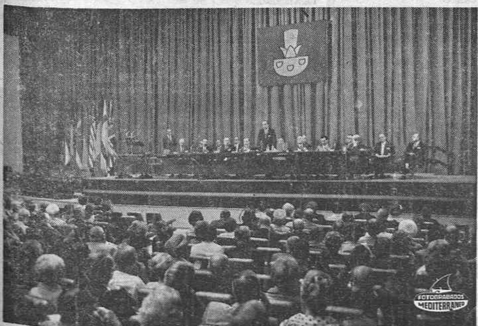
MADRID. — Ha dado comienzo en la Casa Sindical de Madrid el XIII Congreso Internacional de Artes Gráficas con la participación de 950 congresistas de 19 países. En esta foto vemos un aspecto de la sesión inaugural del mismo.

Escoja la funda que desee para TAPIZAR SU COCHE en 20 minutos la colocaremos Avda. Rey D. Jaime, 98 (Frente Instituto). Telf. 216452