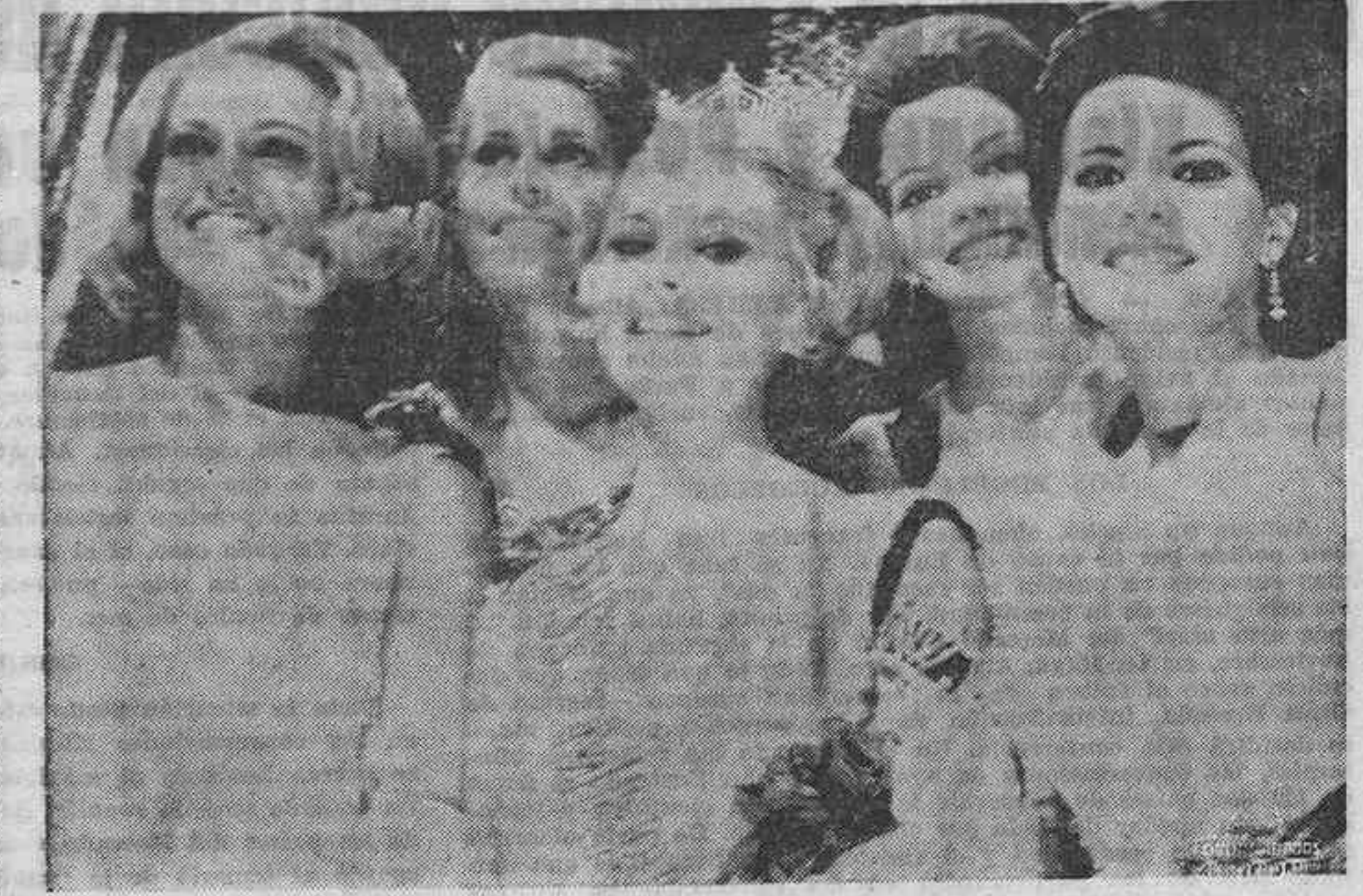
ATLANTIC CITY. —La señorita Pamela Anne Eldred, de 21 años, de Detroit, Michigan, ha sido elegida hoy "Miss América 1970" frente a un nutrido número de compatriotas representantes de otros Estados de la Unión...