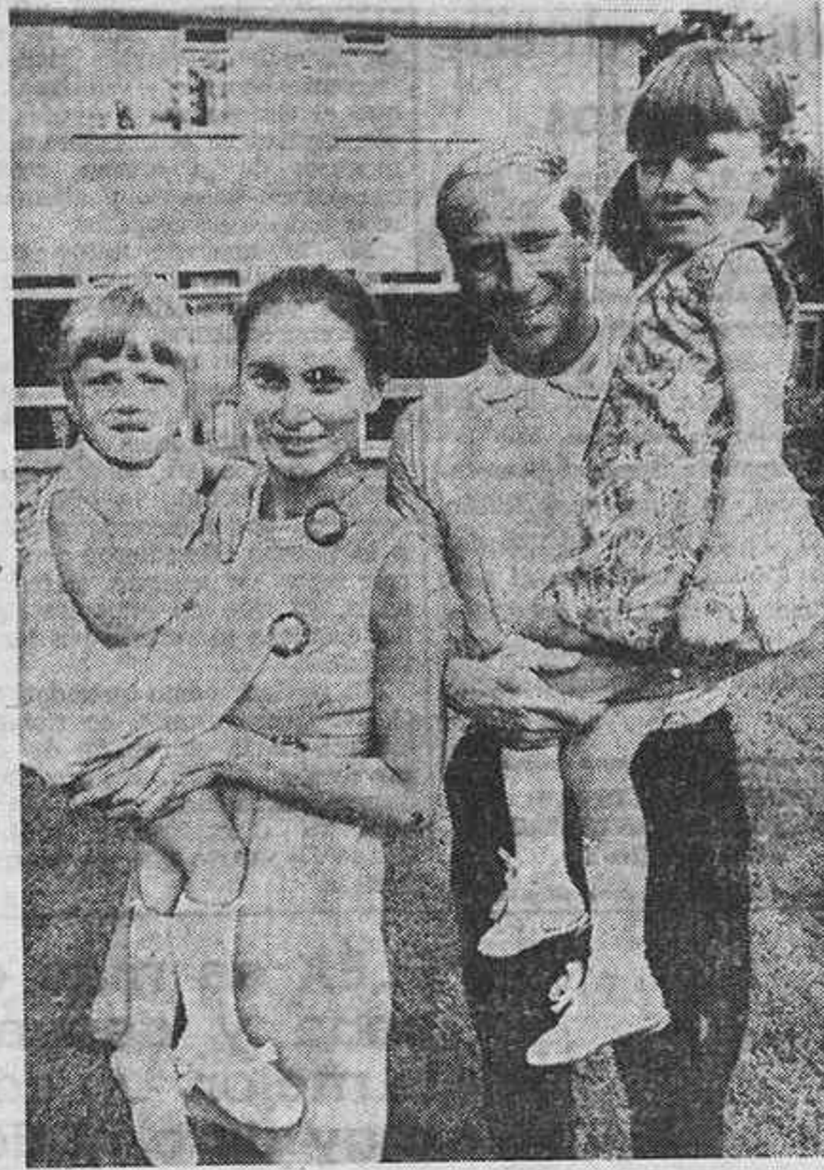
Boby Charlton, el divo del Manchester United y de la selección nacional de Inglaterra, fue apartado al comienzo de la Liga inglesa del equipo titular del Manchester...