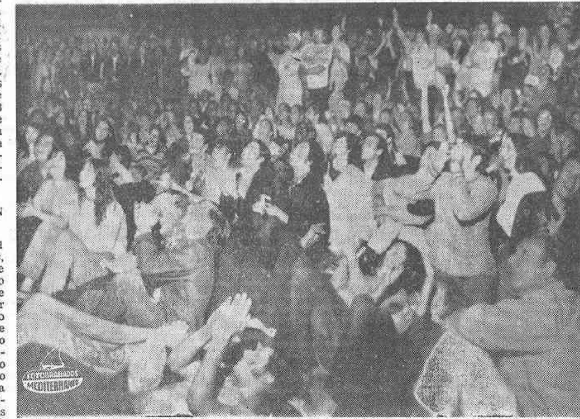
NUEVA YORK.— En Manhattan, los millares de espectadores de la transmisión por televisión de la hazaña espacial de Armstrong, Collins y Aldrin, gritan alborozados en el momento cumbre. Una gran pantalla fue instalada en el Central Park.

CASTELGANDOLFO, 21 (Efe).— "Gloria a Dios en las alturas y paz en la Tierra a los hombres de buena voluntad". Estas palabras que salieron de los labios del Papa Pablo VI en el momento de presenciar, ante la pantalla televisiva, desde el observatorio astronómico vaticano de Castelgandolfo, la llegada del módulo lunar a la superficie del satélite. Seguidamente, en presencia de un pequeño grupo de colaboradores y de técnicos de televisión, italianos y norteamericanos que habían seguido con el Pontífice las fases