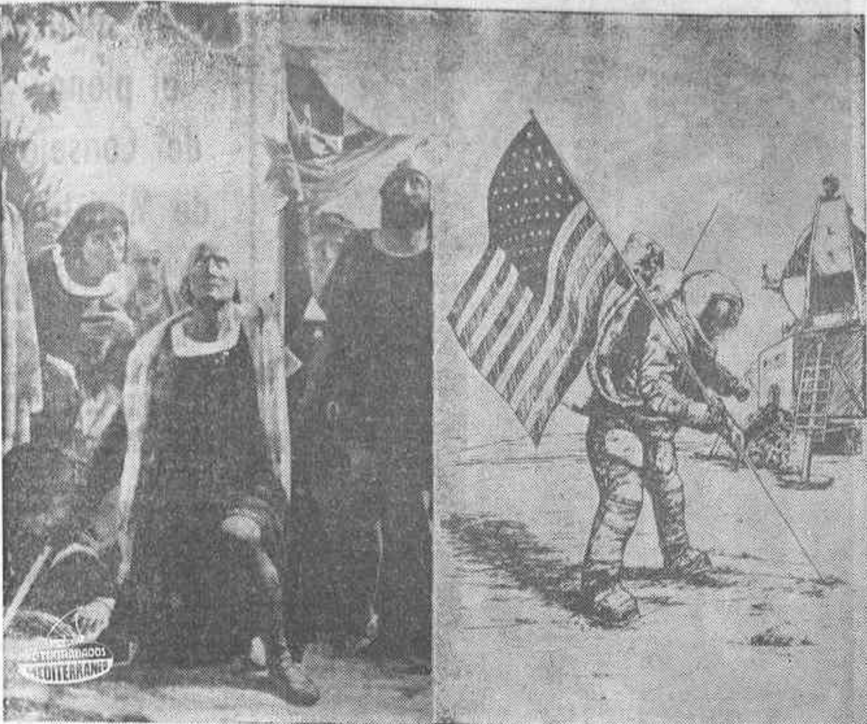
22 de Octubre de 1492: Cristóbal Colón descubre América. 477 años después, exactamente el 20 de julio de 1969, el norteamericano Neil Armstrong coloca un pie sobre la superficie de la Luna. Ambos acontecimientos, que marcan las nuevas eras en la historia de la Humanidad, están simbolizados en estas dos imágenes. En la de la izquierda Colón toma posesión para los Reyes de España de las nuevas tierras descubiertas y el pendón de Castilla ondea por primera vez en ella. En la de la derecha, Armstrong levanta la bandera de un país surgido en aquellas tierras que Colón descubriera, los Estados Unidos de América, sobre la superficie de la Luna.

los previstos y si la maniobra ha constituido un éxito o no, se conocerá en Tierra sólo media hora después de realizada, cuando el vehículo espacial con Armstrong Aldrin y Collins salga de la cara oculta de la Luna donde la maniobra habrá sido llevada a cabo. Será esa media hora de silencio entre las estaciones de seguimiento de Tierra y el vehículo espacial el último momento de incertidumbre y suspense antes de que los astronautas regresen en la atmósfera de la Tierra.