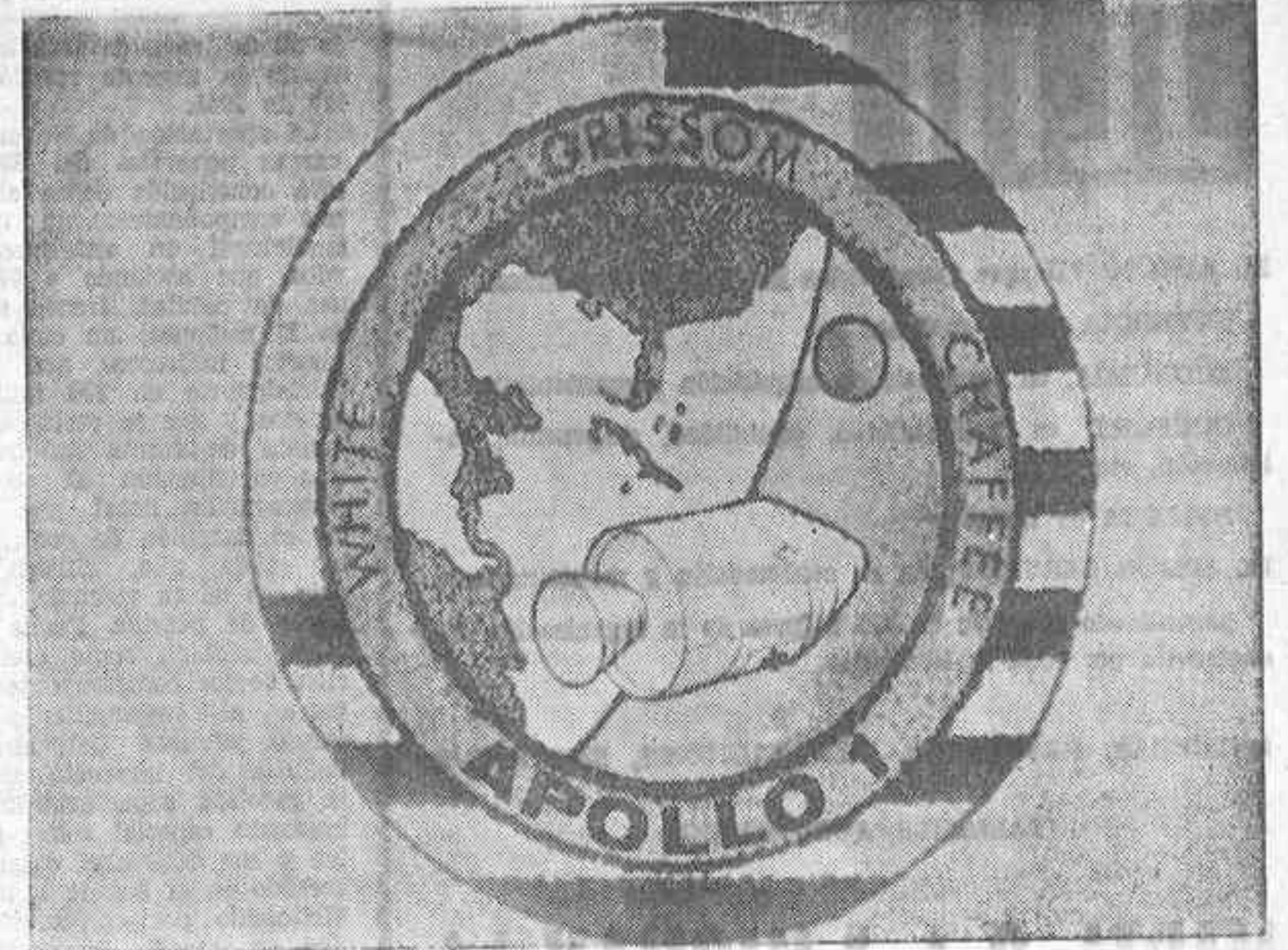
HOUSTON (Texas).— Escarapela que los astronautas del Apolo XI depositaron en la superficie de la Luna. Es la misma que debían haber llevado en sus pechos los astronautas Grissom, White y Chaffers, que murieron en el incendio que se produjo en la base de lanzamiento cuando llevaban a cabo un entrenamiento. La escarapela y tres réplicas en metal fueron depositadas en la Luna.— (Foto UPI-CIFRA).

Tres ligeras correcciones de trayectoria tras la cara oculta de la Luna llevaron al Águila hacia el punto apropiado para la cita y acoplamiento con el Columbia. Desde unos ocho minutos antes de que los dos módulos quedaran acoplados, el Águila y el Columbia marcharon en formación, tras haberse avistado en el espacio. "O. K., estamos dispuestos", radió Armstrong a Collins desde el Águila al conseguir la cita con el Columbia. La maniobra de acoplamiento se ha realizado según los cálculos que quedo completada a las 22:35 h.