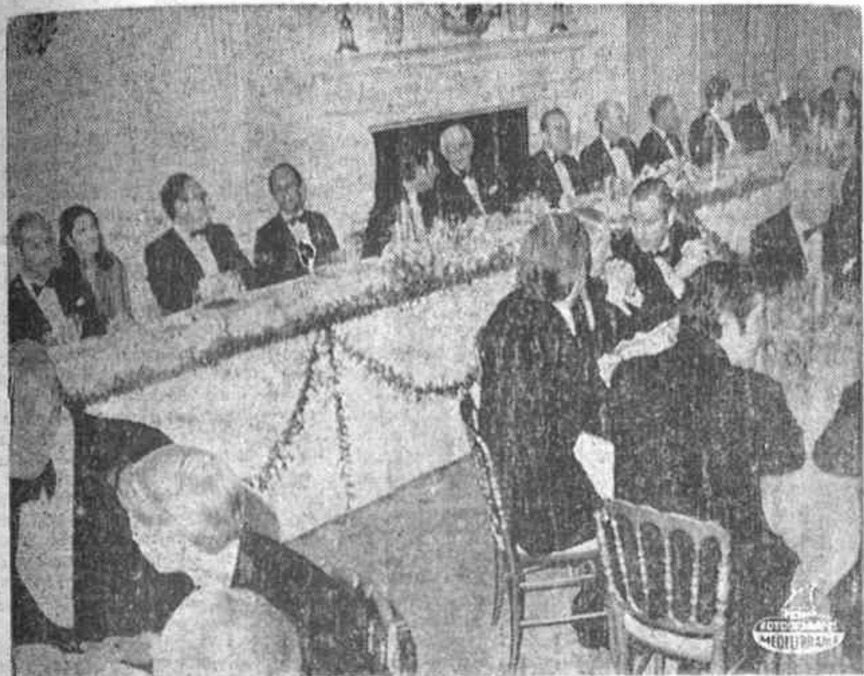
WASHINGTON. — El presidente Nixon ha ofrecido una cena, en la Casa Blanca, a los delegados de la Conferencia Internacional sobre Energía. En la foto, la mesa presidencial.

Francia se ha quedado sola en su postura de no aceptar la hegemonía norteamericana sobre Europa en el campo energético