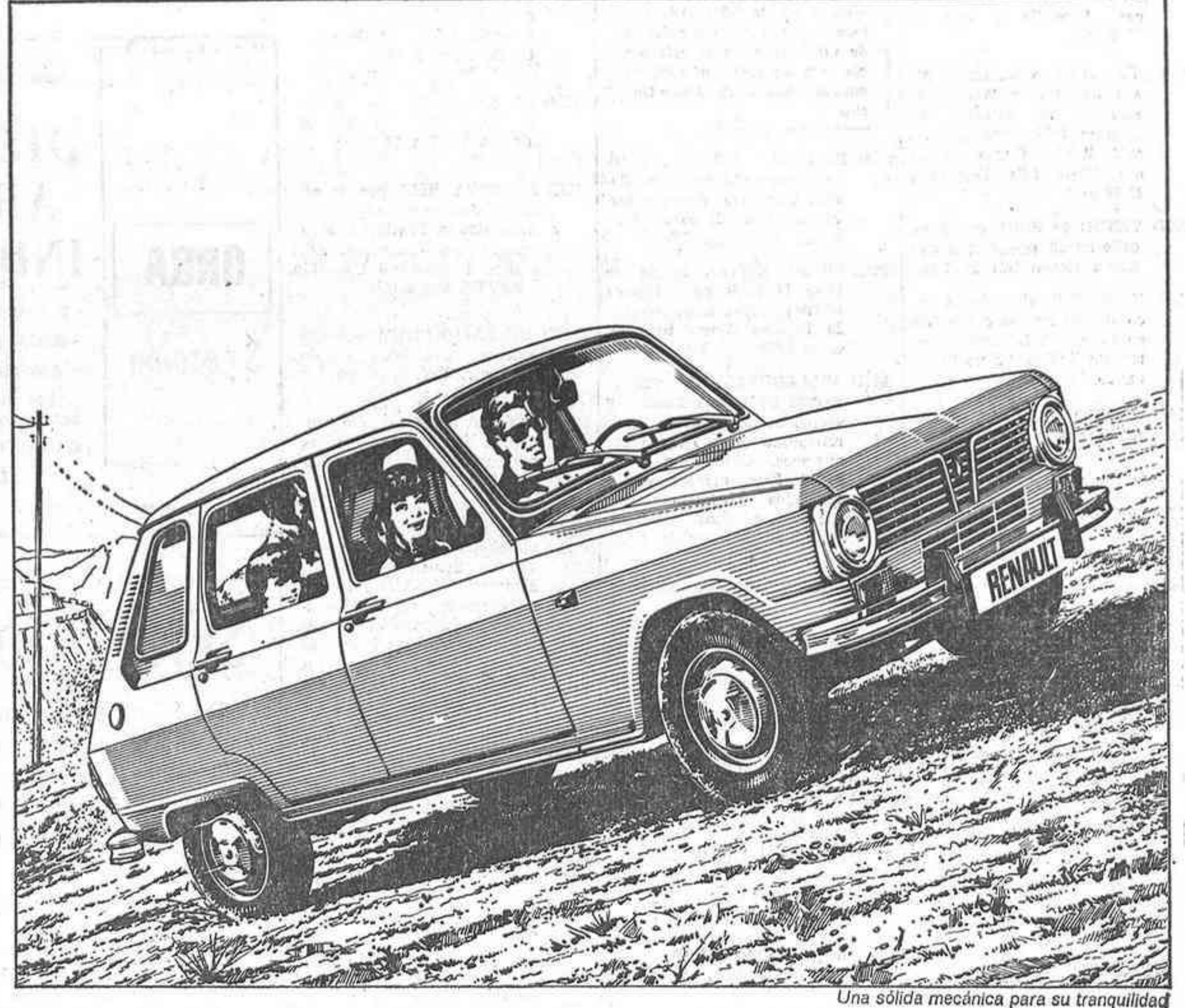
Una sólida mecánica para su tranquilidad