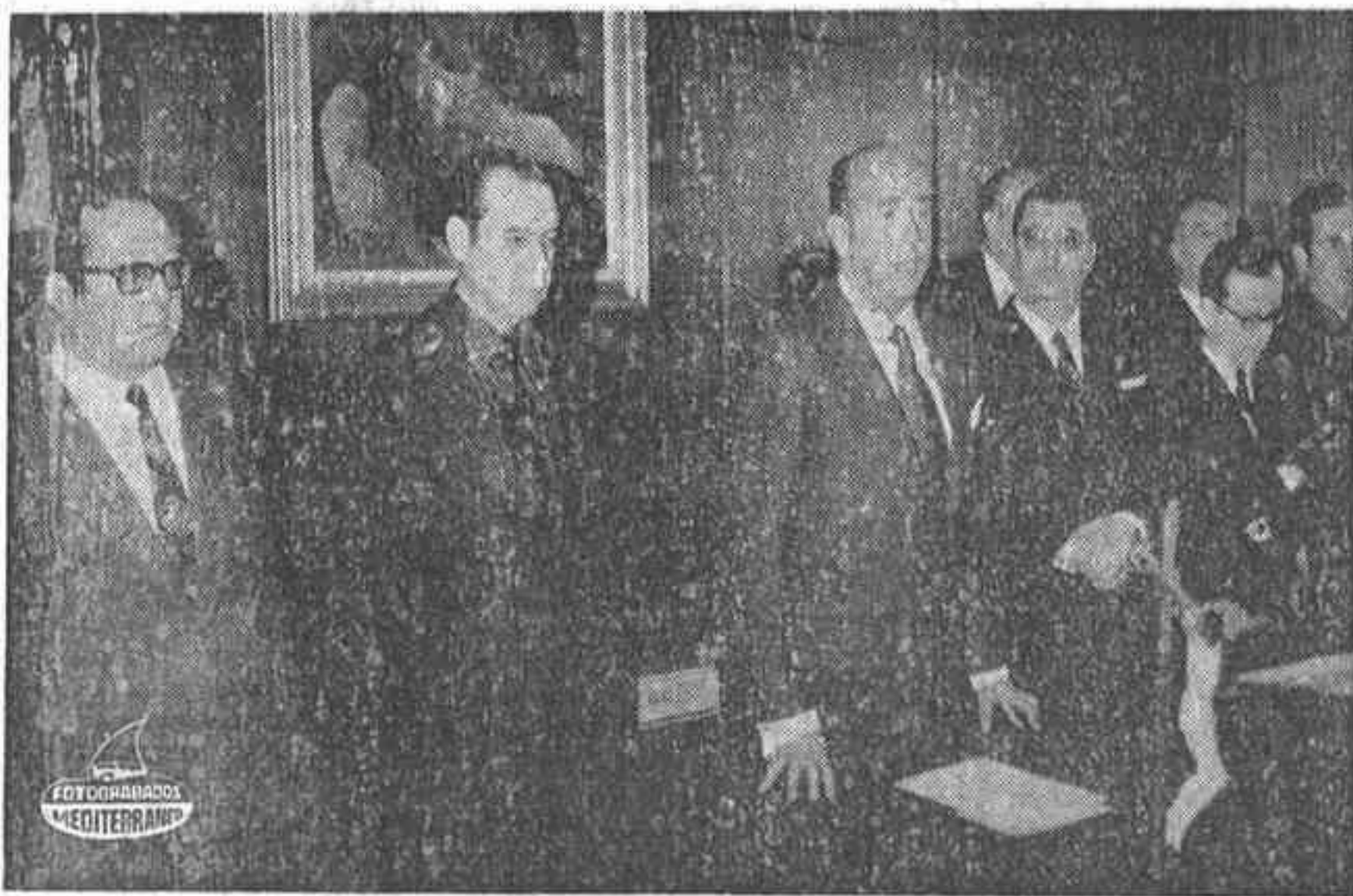
MADRID. — El Ministro Secretario General durante su discurso al dar posesión a los nuevos Mandos de la Secretaría General del Movimiento.