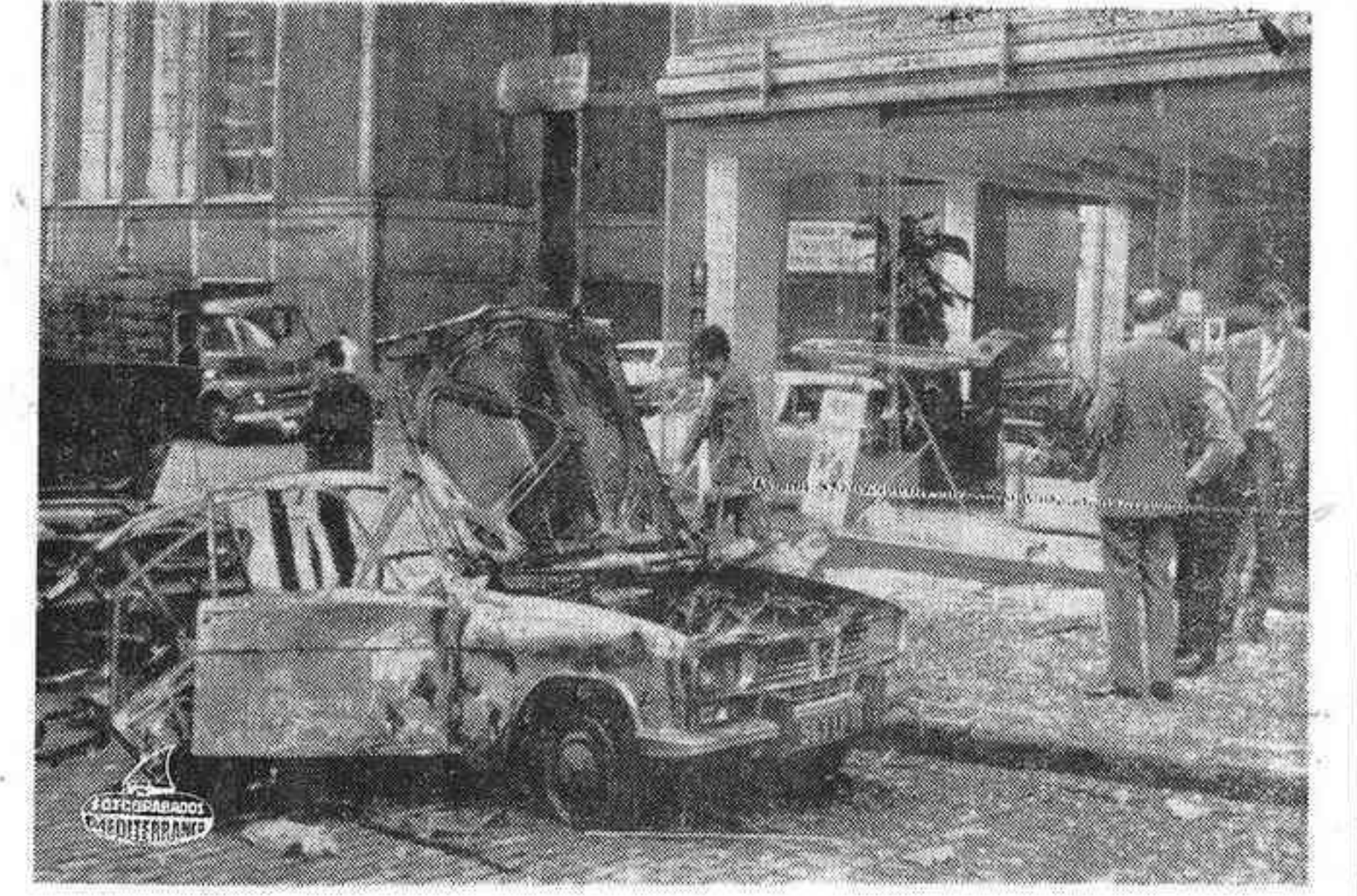
BRUSELAS. — Policias y expertos en explosivos inspeccionan los destrozos causados por una explosión registrada ante las oficinas de IBERIA en Bruselas. El artefacto, se encontraba en el automóvil que aparece totalmente destruido, en primer plano, dañando dos vehículos más y varias ventanas de edificios cercanos.