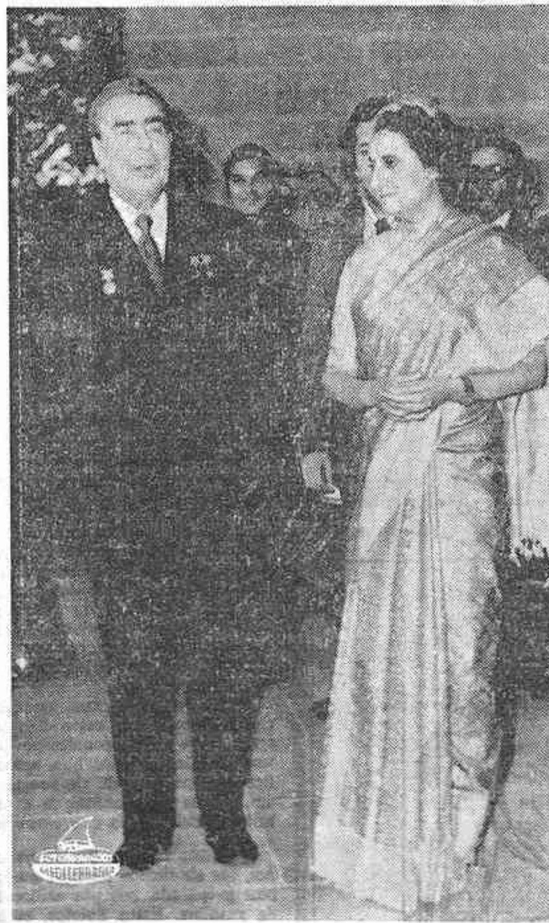
NUEVA DELHI. — La Primera Ministra india, Indira Gandhi, acompaña al jefe del partido comunista soviético, Leonid Brezhnev, a su despacho, donde iniciaron sus conversaciones, poco después de la llegada del dirigente ruso.