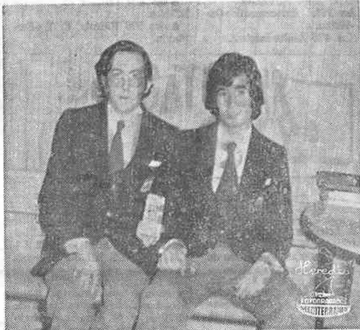
Primer premio en Física. Fueron los encargados de recoger los premios en Málaga.

—No, domingos no, pero sí muchas tardes dedicadas completamente a esto.