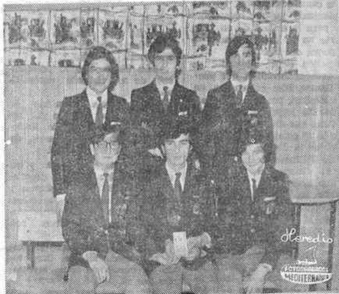
La clasificación de «ósiles», les valió el Segundo premio en Ciencias Naturales.

del colegio Santiago Roda Beltrán, sus experiencias, los estudiantes, ya están esperando las bases para el concurso del próximo año.