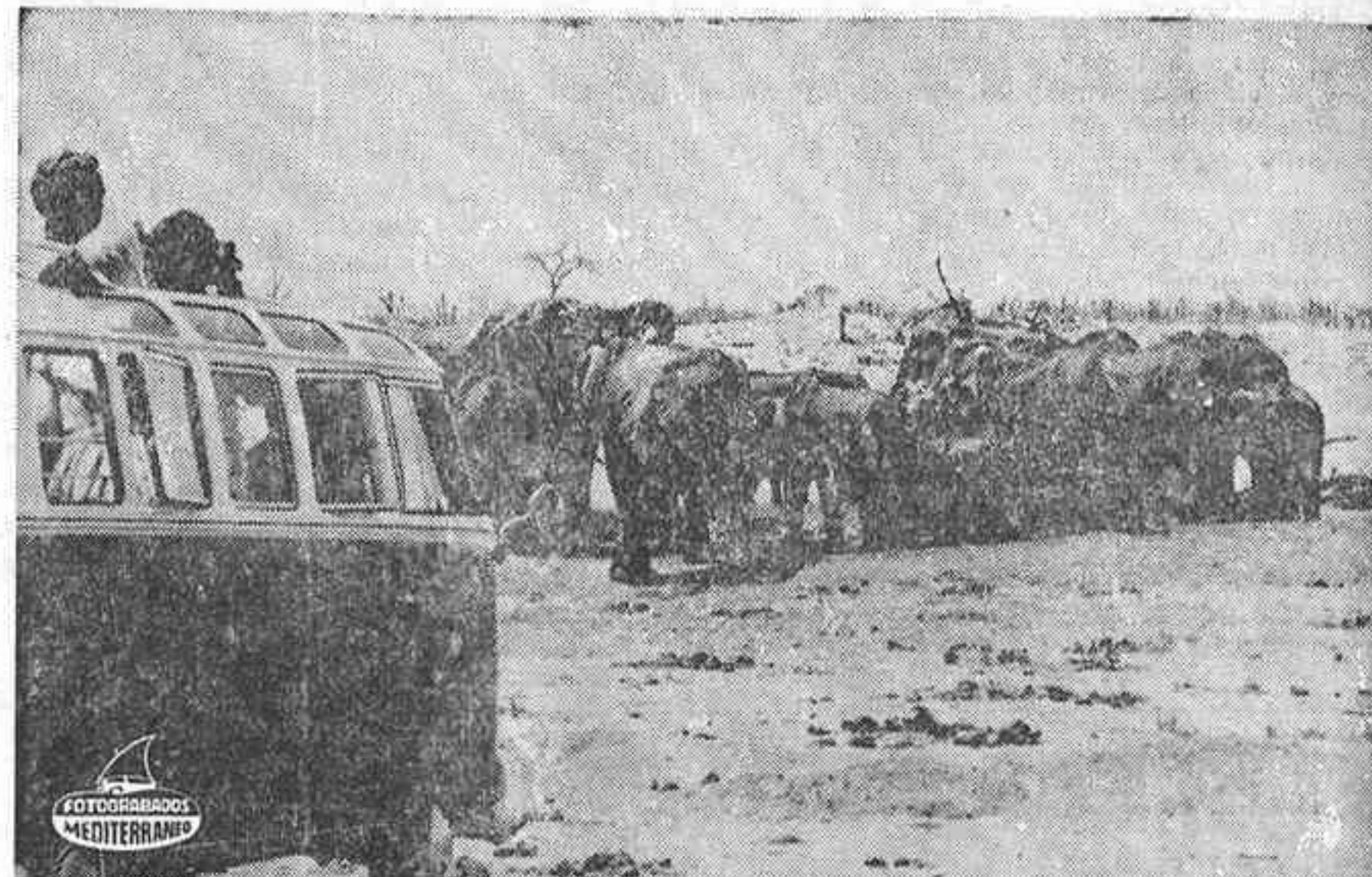
Un grupo de turistas fotografian a un grupo de elefantes que beben y se bañan en un charco de agua