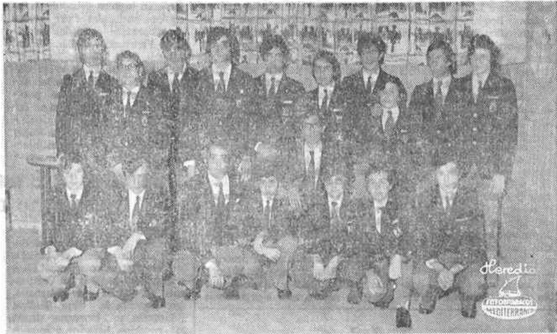
Los ganadores del Concurso Nacional de Ciencias.

Los diferentes trabajos seleccionados, realizados durante todo un curso escolar, sacrificando muchas horas del tiempo libre, dedicadas a la investigación, no fueron vanas. El entusiasmo, la inquietud siguen. Y mientras, comenzaron a descansar de todos los esfuerzos emprendidos para presentar en Málaga, con la coordinación del preceptor