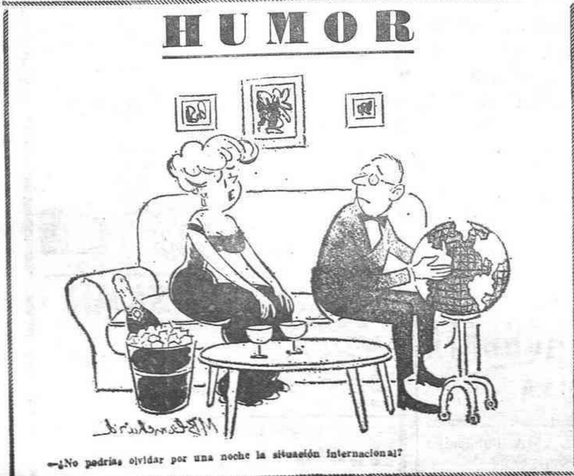
—No podría olvidar por una noche la situación internacional?

ADDIS ABEBA, 29. — Cierta número de personas han muerto en las provincias etíopes del este de Addis Abeba de una enfermedad contagiosa identificada como una forma virulenta de disentería. Un funcionario de sanidad ha declarado que no hay indicación alguna de que la enfermedad sea cólera o relacionada con el cólera.