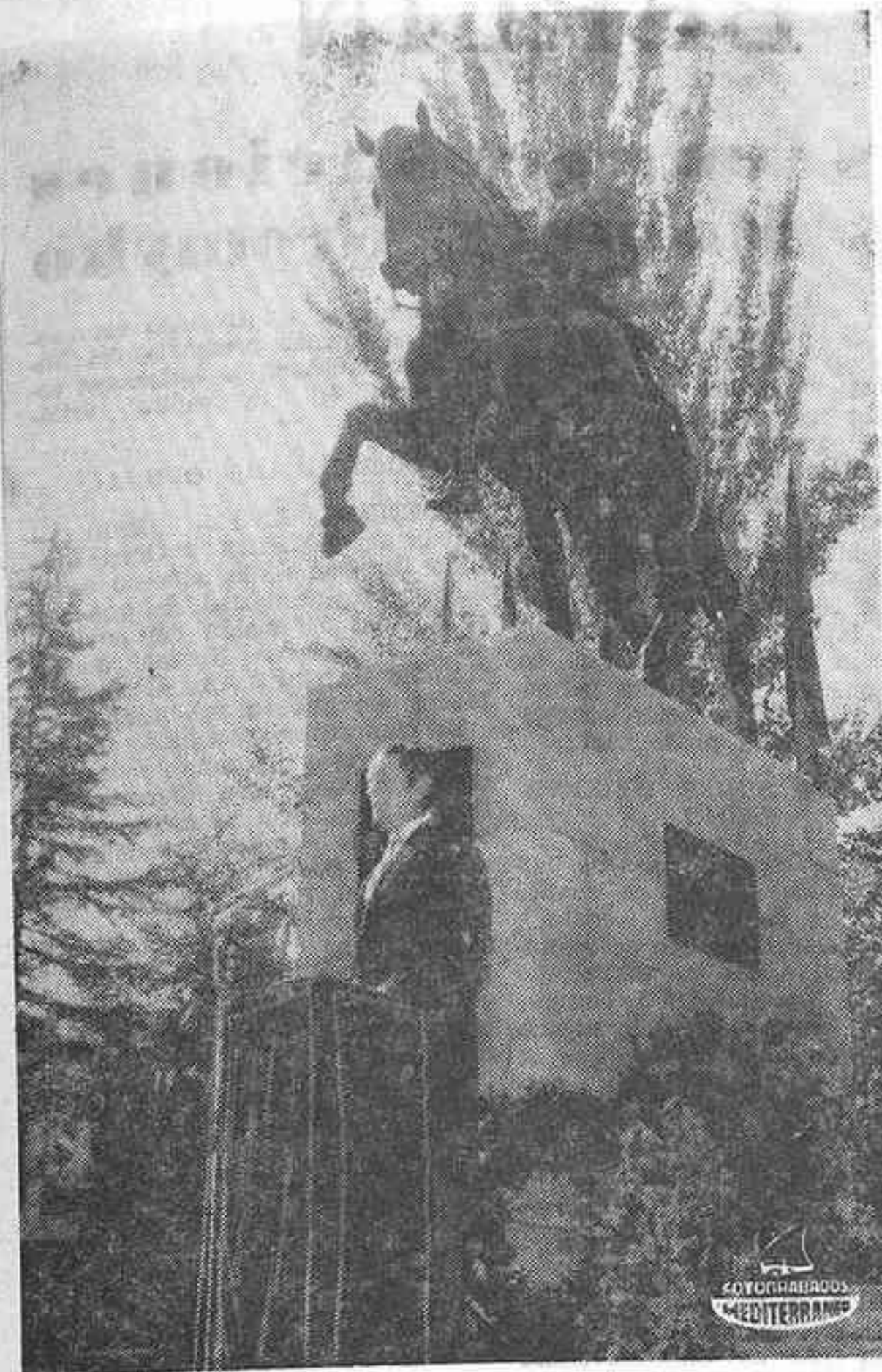
MADRID. — Con asistencia de miembros del Gobierno español y la participación de las delegaciones bolivarianas se ha celebrado en el Parque del Oeste la solemne inauguración del monumento a Simón Bolívar, en cuyo acto desfilaron los cadetes hispano-americanos llegados para este acto junto con los cadetes españoles. En la foto, el ministro español de Asuntos Exteriores, Sr. López Bravo, durante su discurso en dicho acto.