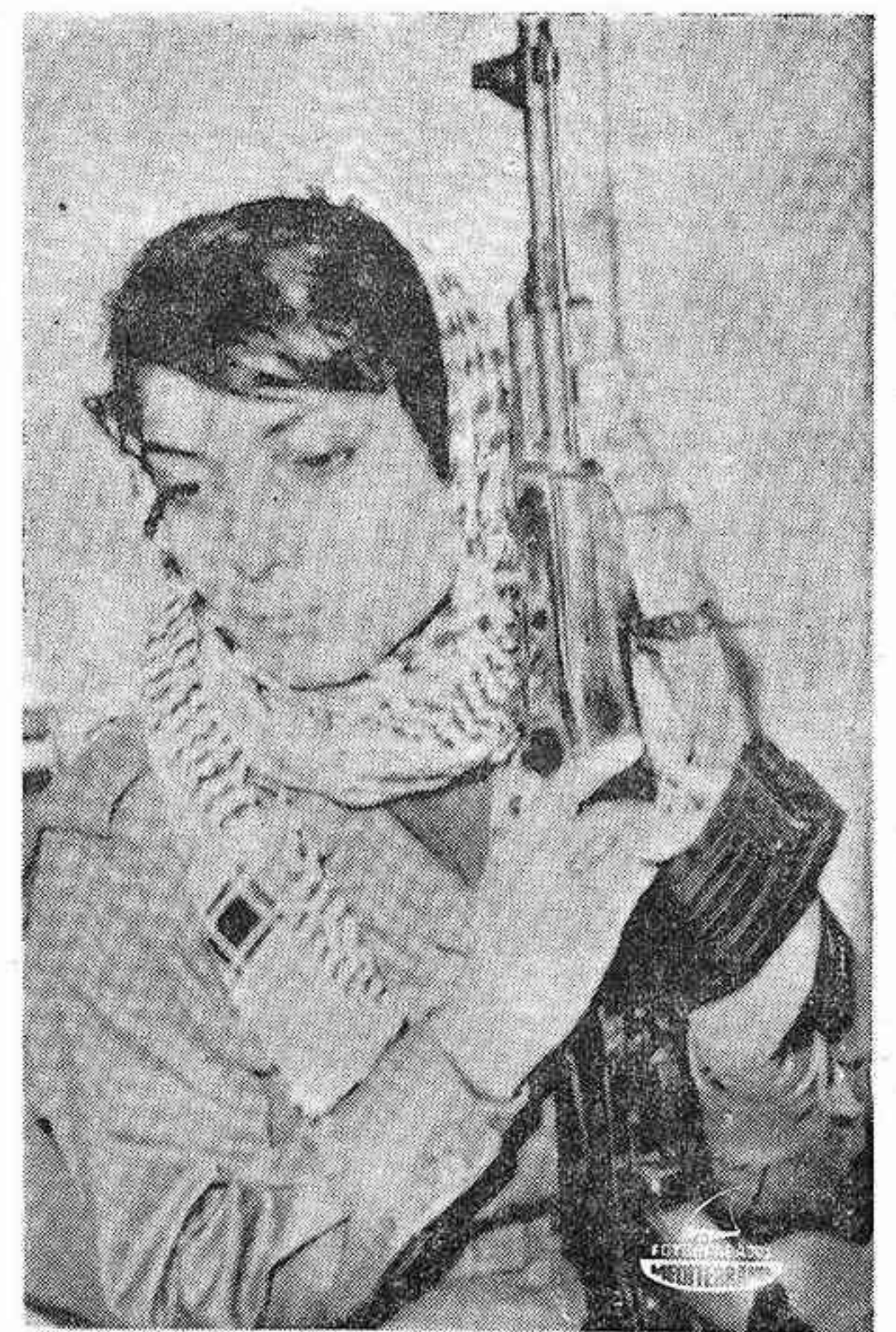
LONDRES. — Foto de archivo de la joven guerrillera palestina Leila Khaled, que tomó parte en el secuestro del avión israelí de la Compañía El Al, poco después de despegar del aeropuerto de Amsterdam.

El problema ha alcanzado ya proporciones que harán muy difícil su solución, pero si se quiere que la navegación aérea comercial continúe desarrollándose y prestando su gran servicio a la comunicación de los hombres, no hay otra salida que afrontarlo con eficacia, para la cual una vez más se hace imprescindible una acción internacional sin fisuras, que es precisamente lo que nuestro mundo removido por crisis de violencia y egoísmo, no puede lograr de verdad.