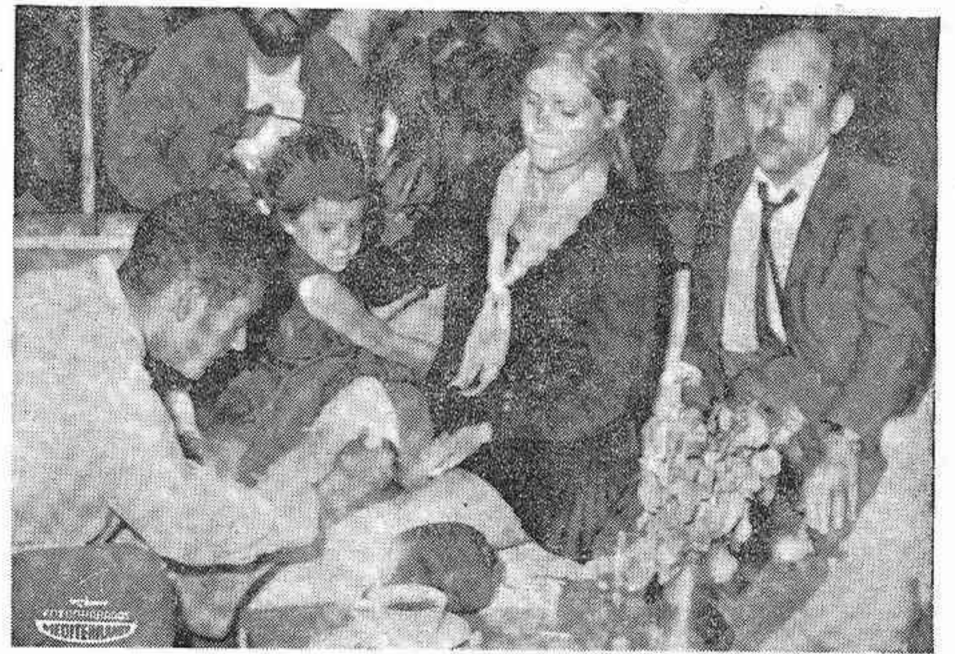
EL CAIRO. — Pasajeros del Jumbo jet de la compañía Pan-Americana, reciben los primeros cuidados a sus heridas, en el aeropuerto de El Cairo. Los pasajeros abandonaron el avión ocho minutos antes de que fuera volado por tres guerrilleros, usando bombas de relojería.