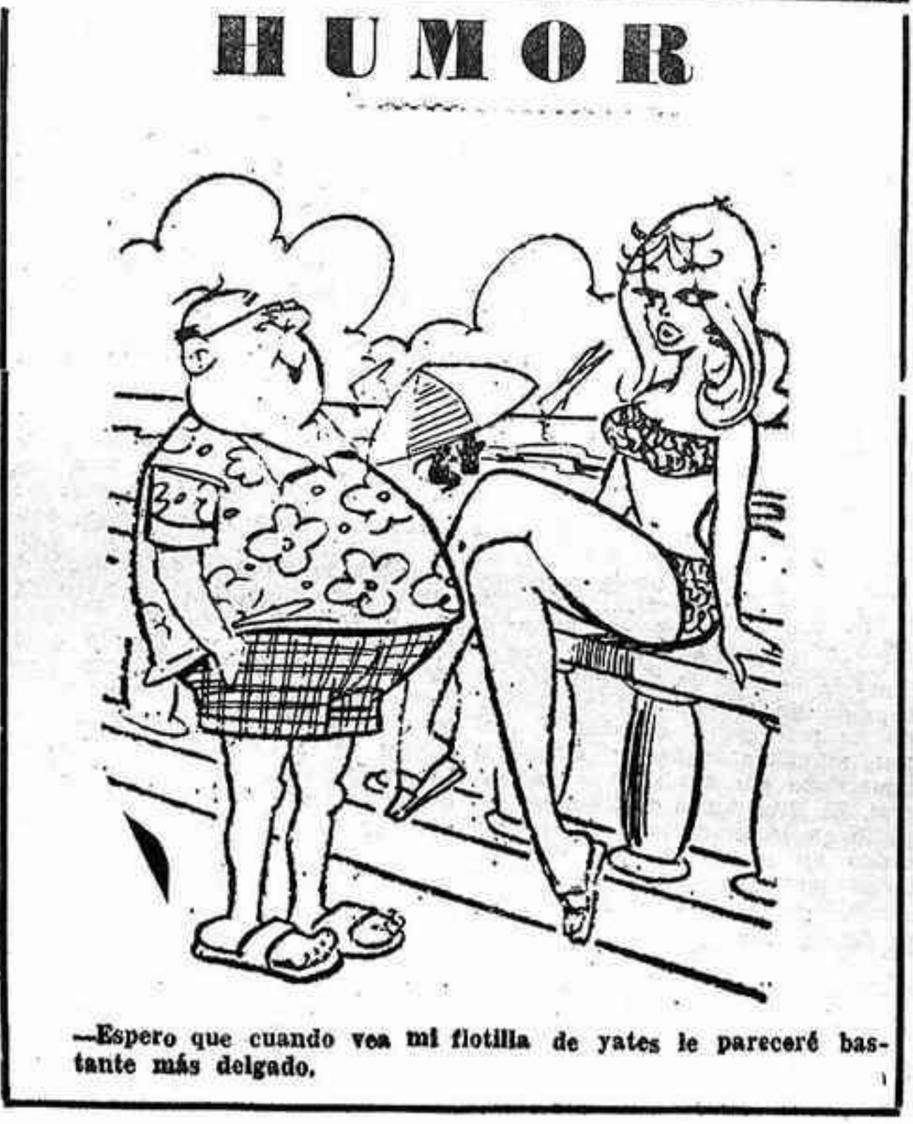
—Espero que cuando vea mi flotilla de yates le pareceré bastante más delgado.

El número de extranjeros residentes en España en marzo de 1970 era de 141.005, según los últimos datos publicados por el Instituto Nacional de Estadística.