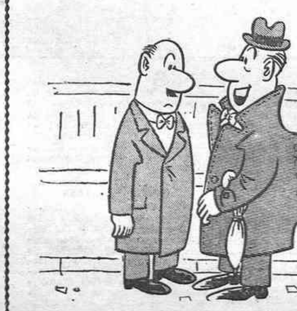
—¿Es que no has visto nunca un abrigo de piel de camello?