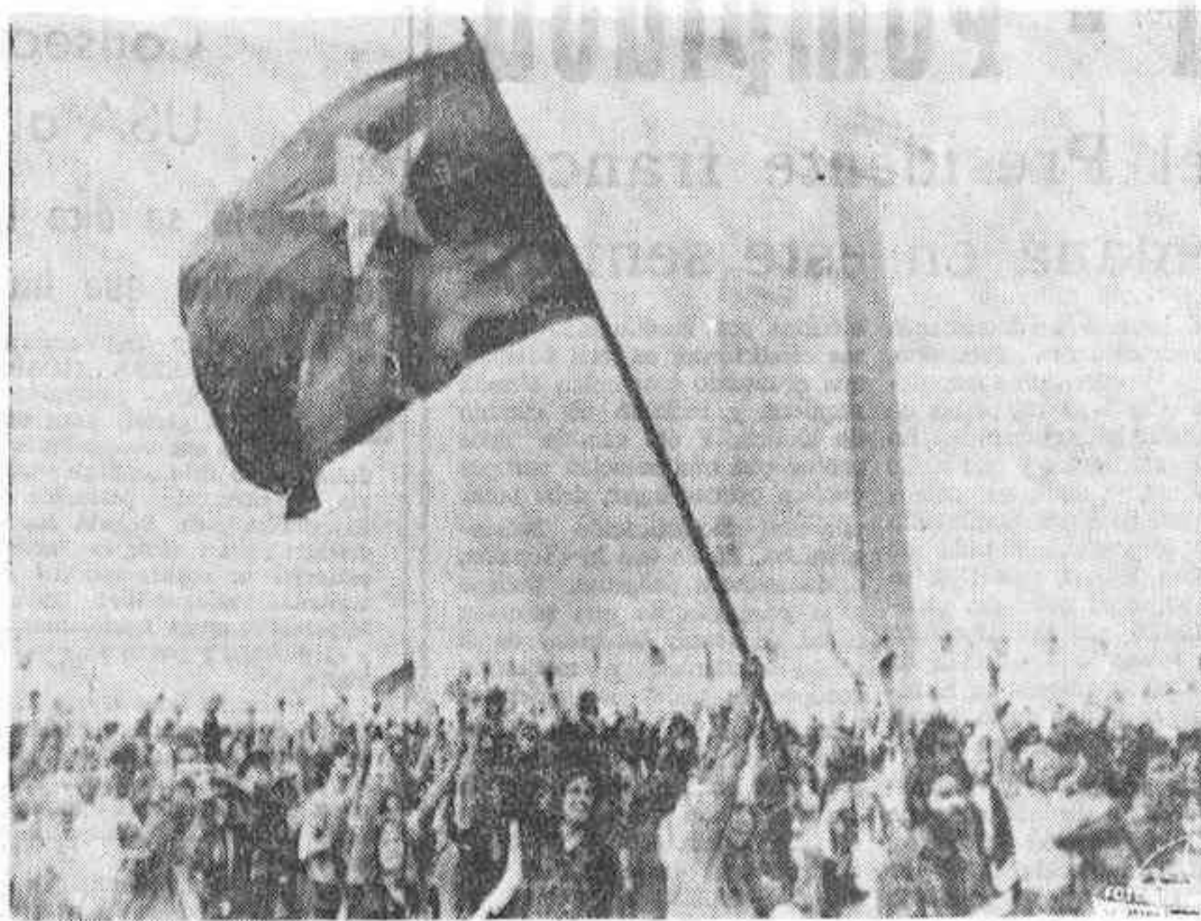
WASHINGTON.— Grupos de manifestantes contra la guerra, algunos portando banderas del Vietnam, se manifestaron ante el Monumento a Washington, el martes, antes de iniciar una marcha de protesta hacia la Casa Blanca. Pretendían presentar al Presidente Nixon un «aviso de desahucio».