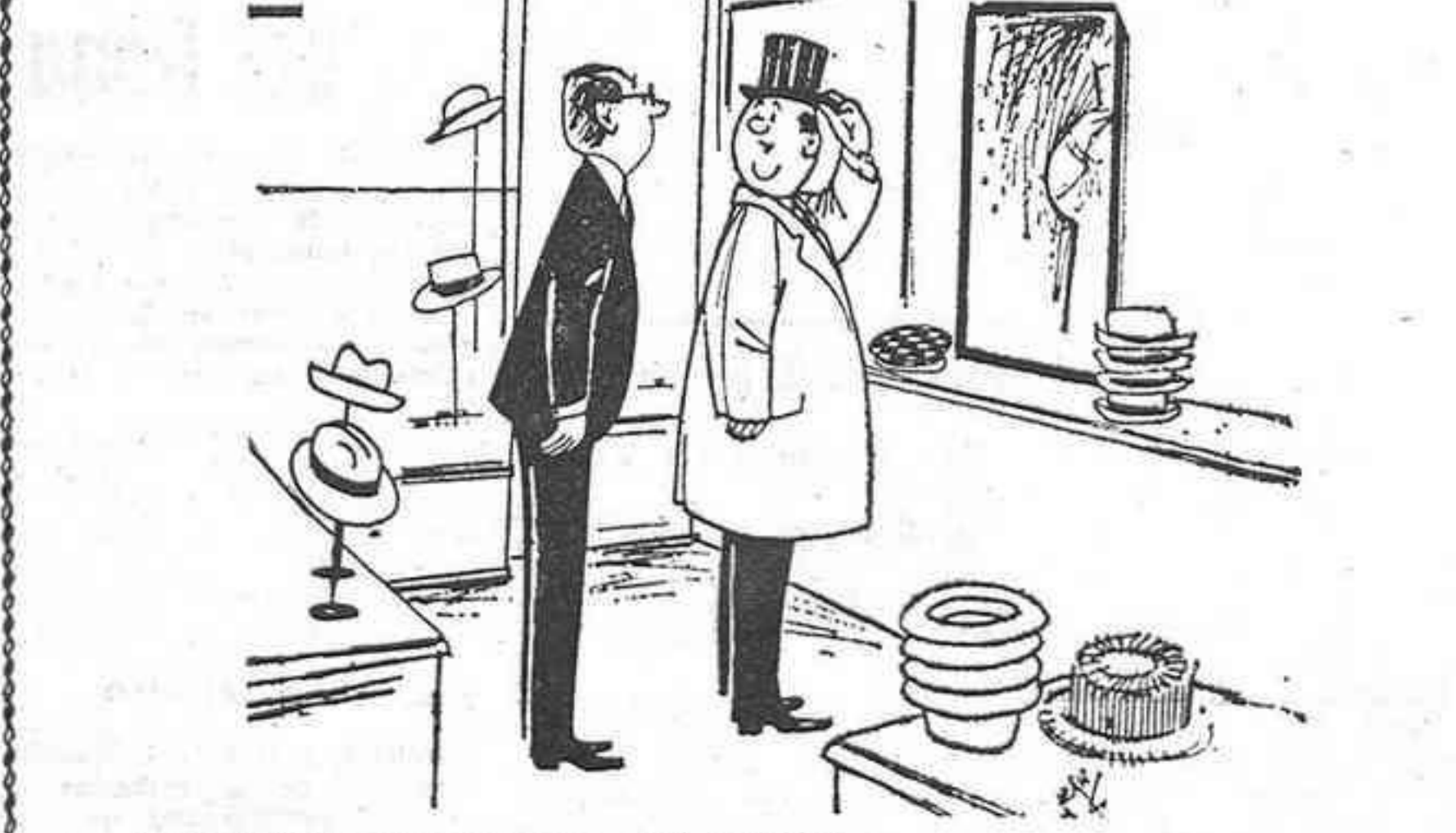
—Estoy dudando entre ésto y una gorra a cuadros.