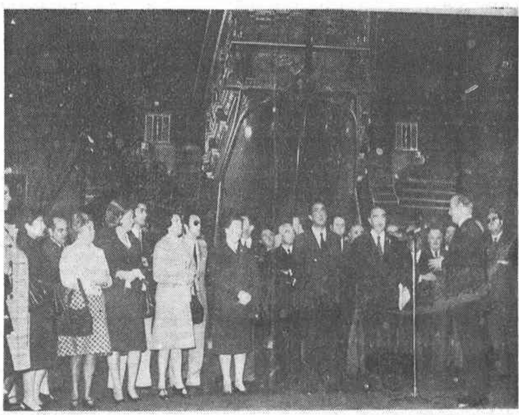
BARCELONA. — En la foto el Ministro de la Gobernación D. Tomás Garicano Goñi, acompañado del Gobernador Civil, D. Tomás Pelayo Ros, en la visita que realizaron a las Atarazanas, para ver la Galera Real y su exposición.