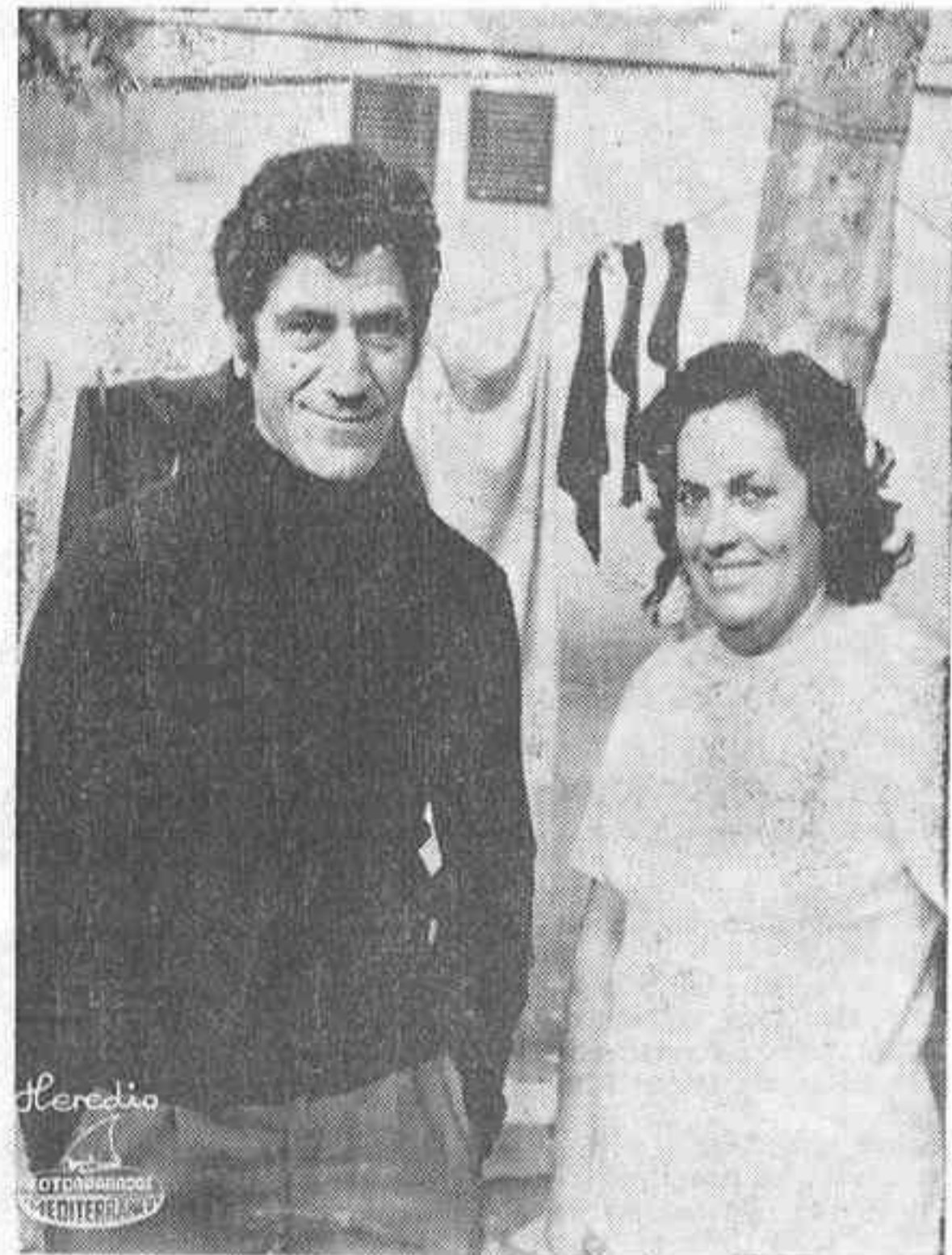
Viene de la anterior

En una fotografía vemos a dos pequeños... —Son los hijos, la niña tiene 10 años y el niño es más pequeño. Viven en Pamplona, con la familia, porque ésta no es vida para ellos. Ahora lo que tienen que hacer es estudiar... —¿Cuánto tiempo llevan en esto de la feria?... —Unos diez años. Es una vida muy sacrificada, pero bastante tranquila... El matrimonio procede de Arza (Navarra) y, durante todo el año, viajan prácticamente por todas las regiones españolas. Recientemente han estado en Gandía y Alcazar de San Juan; ahora se desplazarán a Valencia y después a Alicante, Tarragona... —¿Y qué tal se desenvuelven?... —Con sacrificios, pero nos vamos defendiendo. Tenga en cuenta que esta instalación supone una inversión de más de 1.300.000 pesetas y, además, para atenderla tenemos a dos empleados... —A sus hijos, ¿no les gustaría viajar con ustedes?... —Ya lo creo. La feria les encanta, pero comprendemos que no es vida para ellos. No nos gustaría que fueran feriantes... Esto es muy duro, se trabaja mucho, y si nosotros lo hacemos es precisamente por ellos, para darles lo mejor... Con todo, en esta actividad, según nos dijeron lo peor son los traslados de lugar, el montar y desmontar el negocio... —Por lo demás, se vive bastante tranquilo. En la casa, como puede ver, tenemos de todo, como en un piso... Vivir sobre ruedas... Es el sino del feriante, un personaje en cierto de controversia, pero siempre sugestivo; peregrino impenitente por los caminos de España... FRANCISCO PASCUAL