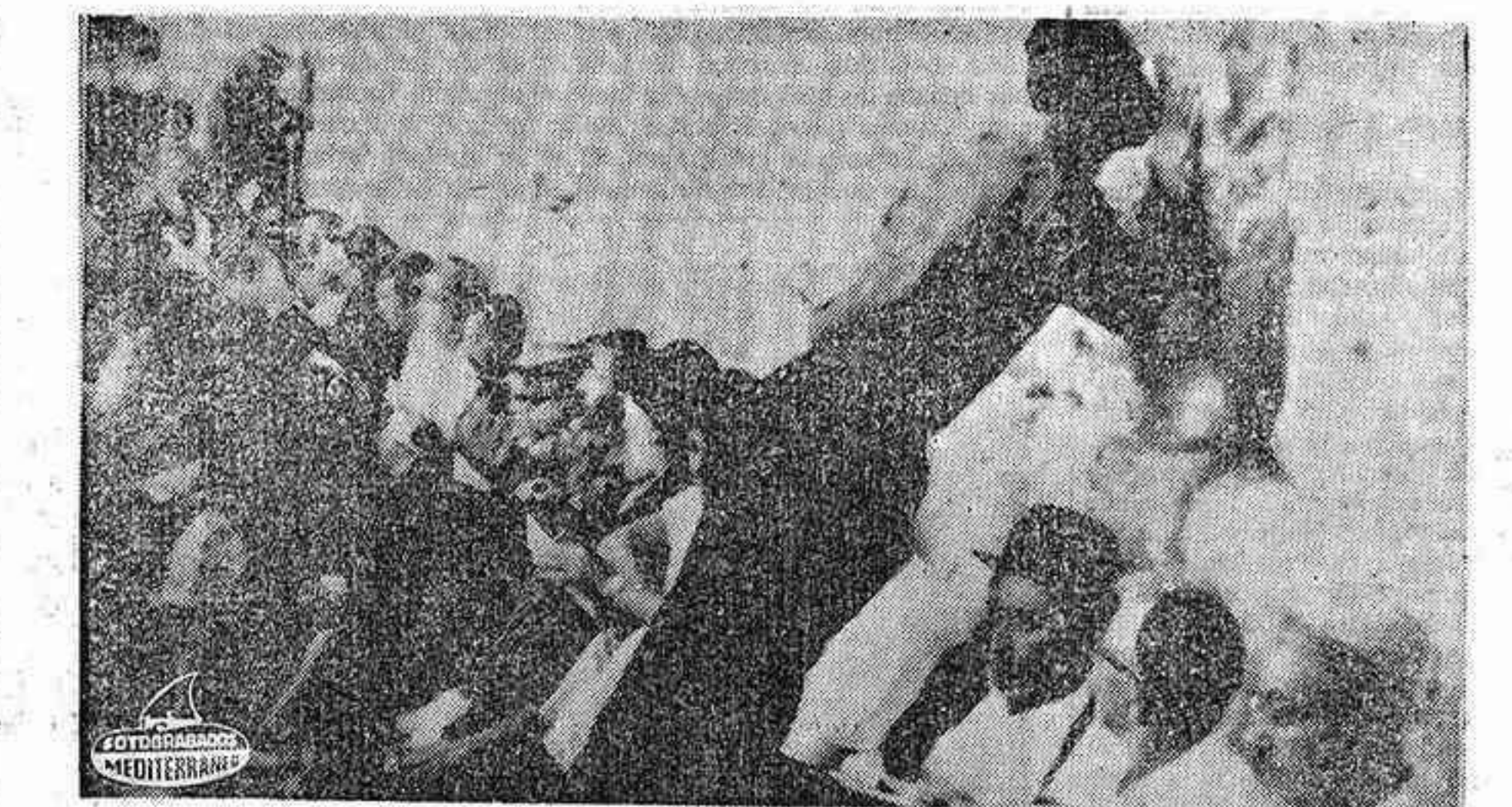
DE NUEVO ANTE EL MURO DE LAS LAMENTACIONES