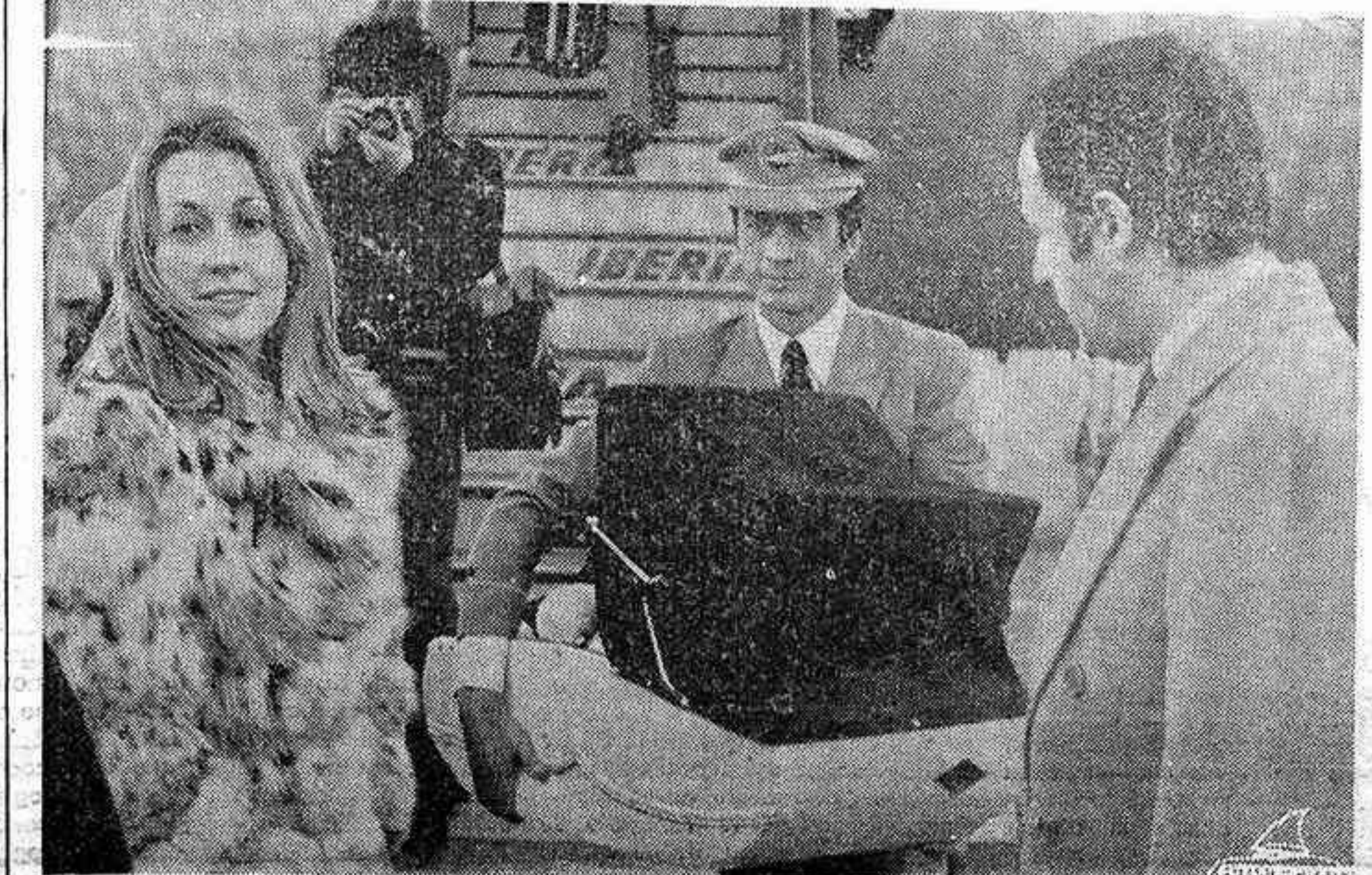
MADRID. — Los Duques de Cádiz, D. Alfonso de Borbón y doña María del Carmen Martínez Bordiu, al llegar al aeropuerto de Barajas, en vuelo especial, procedentes de Estocolmo.