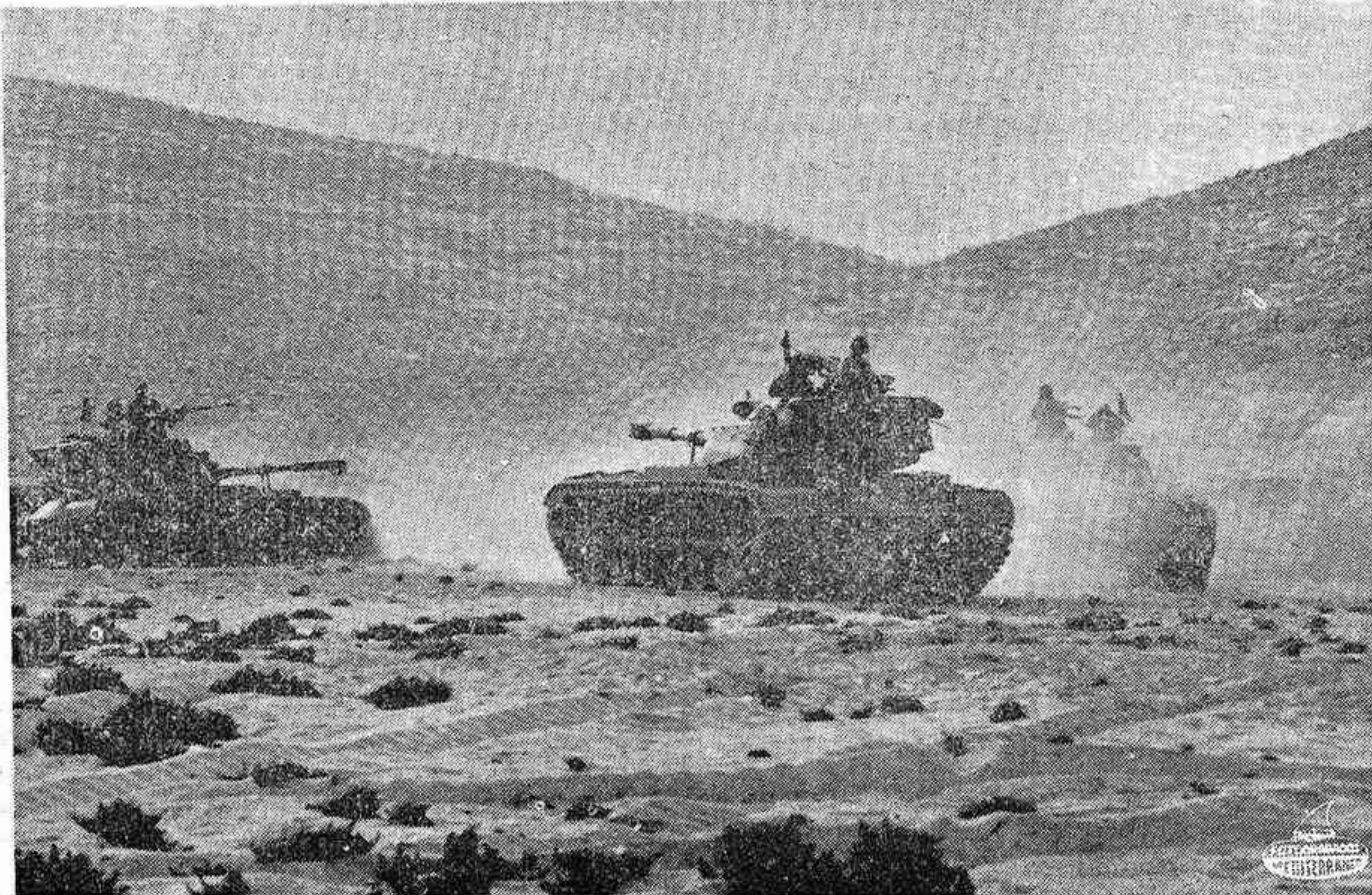
CARBONERAS (Almería). — Un aspecto de las maniobras que se llevan a cabo en Carboneras, en la costa almeriense, con participación de las escuadras española y norteamericana, y unos efectivos de unos 2.500 hombres.

ALMERIA, 13. (Pyresa). — Continúan su desarrollo las maniobras de la colaboración hispano-norteamericana con ejercicios de ocupación y consolidación de las áreas de terreno previamente fijadas. Tal operación, iniciada en la mañana del día 10 con asistencia de altos jefes de la Marina y el Ejército de ambos países, con material terrestre y anfibio y con operaciones aéreas de apoyo a las fuerzas atacantes, ha seguido su normal desarrollo, ocupando los objetivos previstos e iniciando ya el movimiento de concentración para su vuelta y operaciones de reembarque, que deberán quedar finalizadas en las próximas 24 horas. En estas operaciones intervienen los barcos americanos de la VI Flota «Dupont», «Powers», «Shreveport», «Ponce», «Portland», «Fair», y «Country», y por parte de la armada española, «Galicia», «Conde de Benedito», «Poseidón» «R-A-E» y «LO-3».