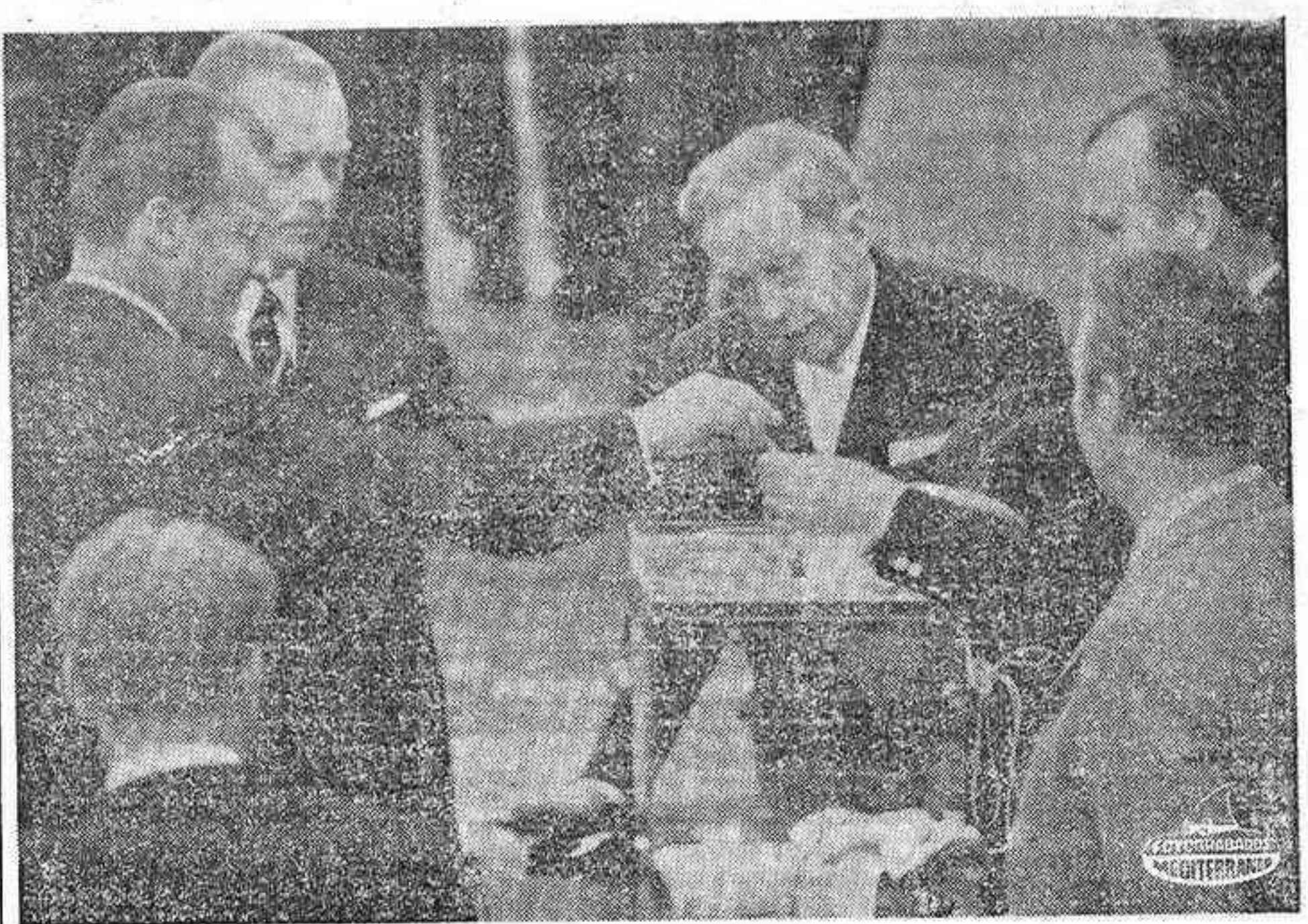
BONN. — El Parlamento de Alemania Federal ha elegido hoy nuevo Canciller durante la segunda sesión de su nuevo período. El único candidato era Willy Brandt, presidente del partido social-demócrata, el cual aparece en la foto depositando su voto en la elección a dicho cargo.

Los miembros del nuevo Gobierno juraron sus cargos ante el pleno del Parlamento federal