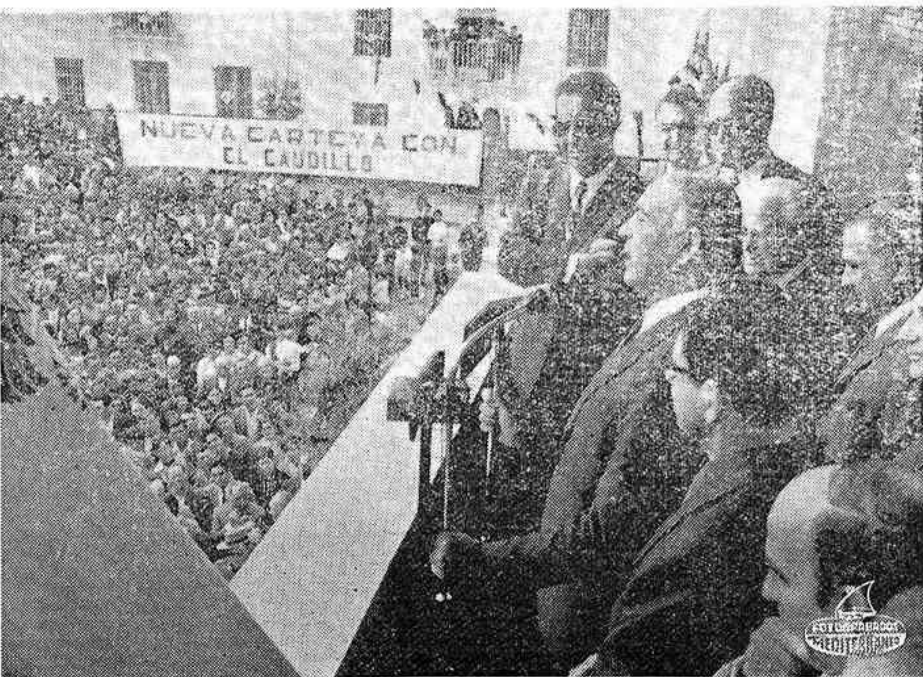
NUEVA CARTEYA (Córdoba). — El Ministro Secretario General del Movimiento, don José Solís Ruiz, donde ha inaugurado el edificio para el ayuntamiento y un grupo escolar que completa un total de 22 centros de enseñanza oficial. En la foto, aspecto del público que escuchó y aplaudió a Solís, quien se dirigió al pueblo desde el balcón central del nuevo edificio consistorial.

Escoja la funda que desee para TAPIZAR SU COCHE en 20 minutos la colocaremos Avda. Rey D. Jaime, 98 (Frente Instituto). Telf. 216452