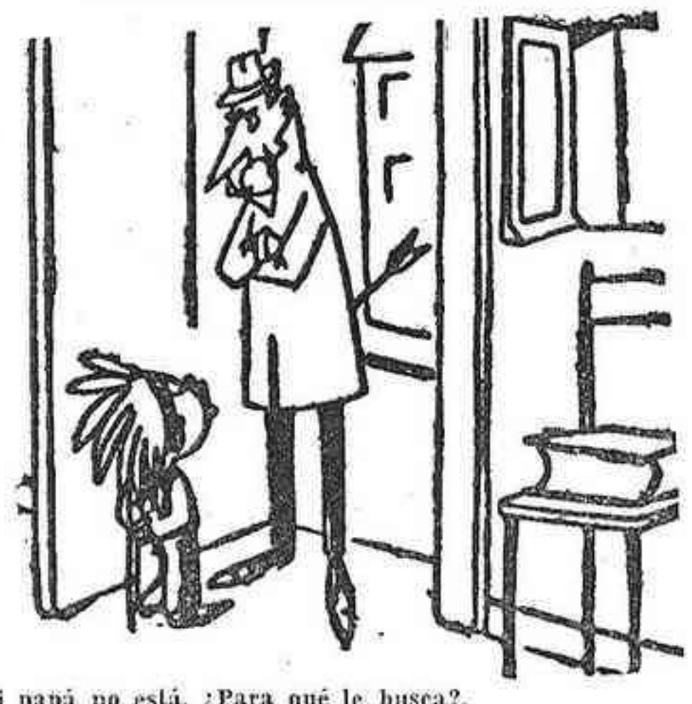
—Mi papá no está. ¿Para qué le busca?.