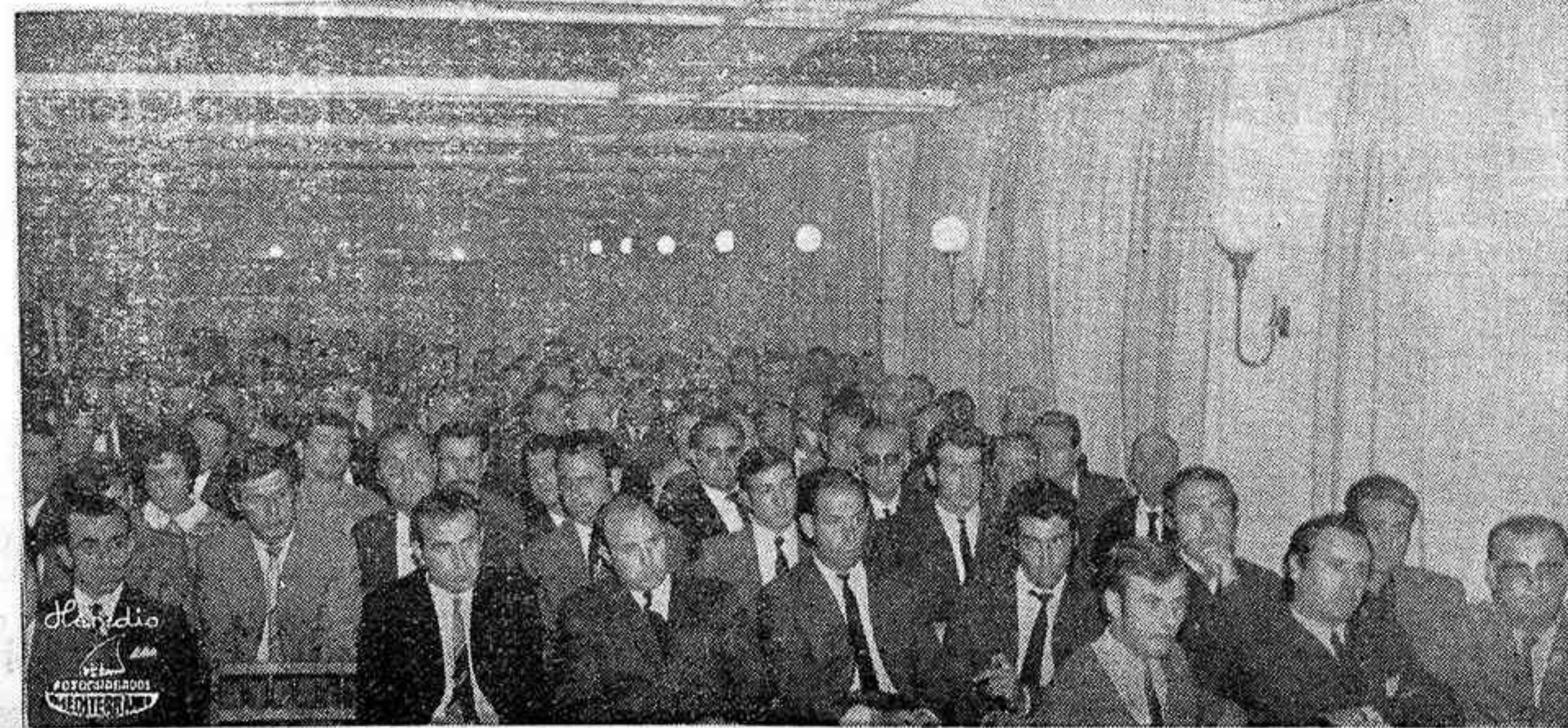
ASPECTO QUE OFRECIA EL SALON DONDE SE CELEBRO LA REUNION