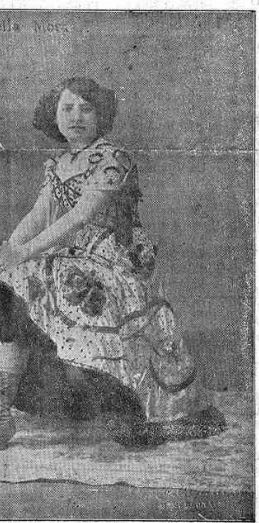
Esta noche se anuncia un magnífico programa, en el que tomarán parte La Torrerica , que contará nuevamente las Follas y nos dará a conocer nuevos números de su repertorio. La Torrerica chica , bailará y el cinematógrafo exhibirá interesantes películas, algunas estrenos muy interesantes.

Unas y otras excepciones, para ser válidas deberán estar autorizadas, a propuesta del maestro respectivo, por el inspector de primera enseñanza de la zona y el inspector maestro de la localidad. En caso de diferencia de criterio lo pondrá el inspector en conoci-