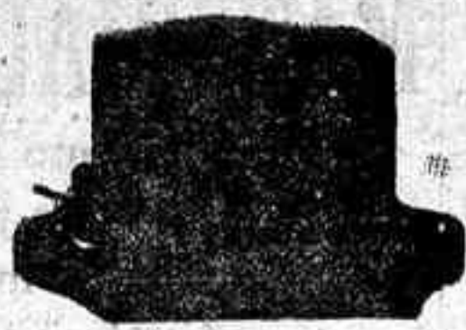
Transformador Philips de gran sensibilidad para todas las frecuencias vocales y musicales entre 50 y 20.000 mil. perfecto por seguridad, tamaño reducido.