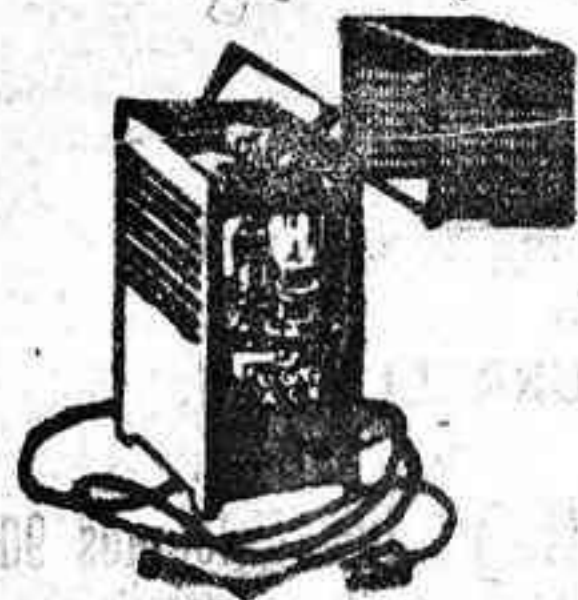
Amplificador Philips para garage. Reproduce — Practico — Economico.