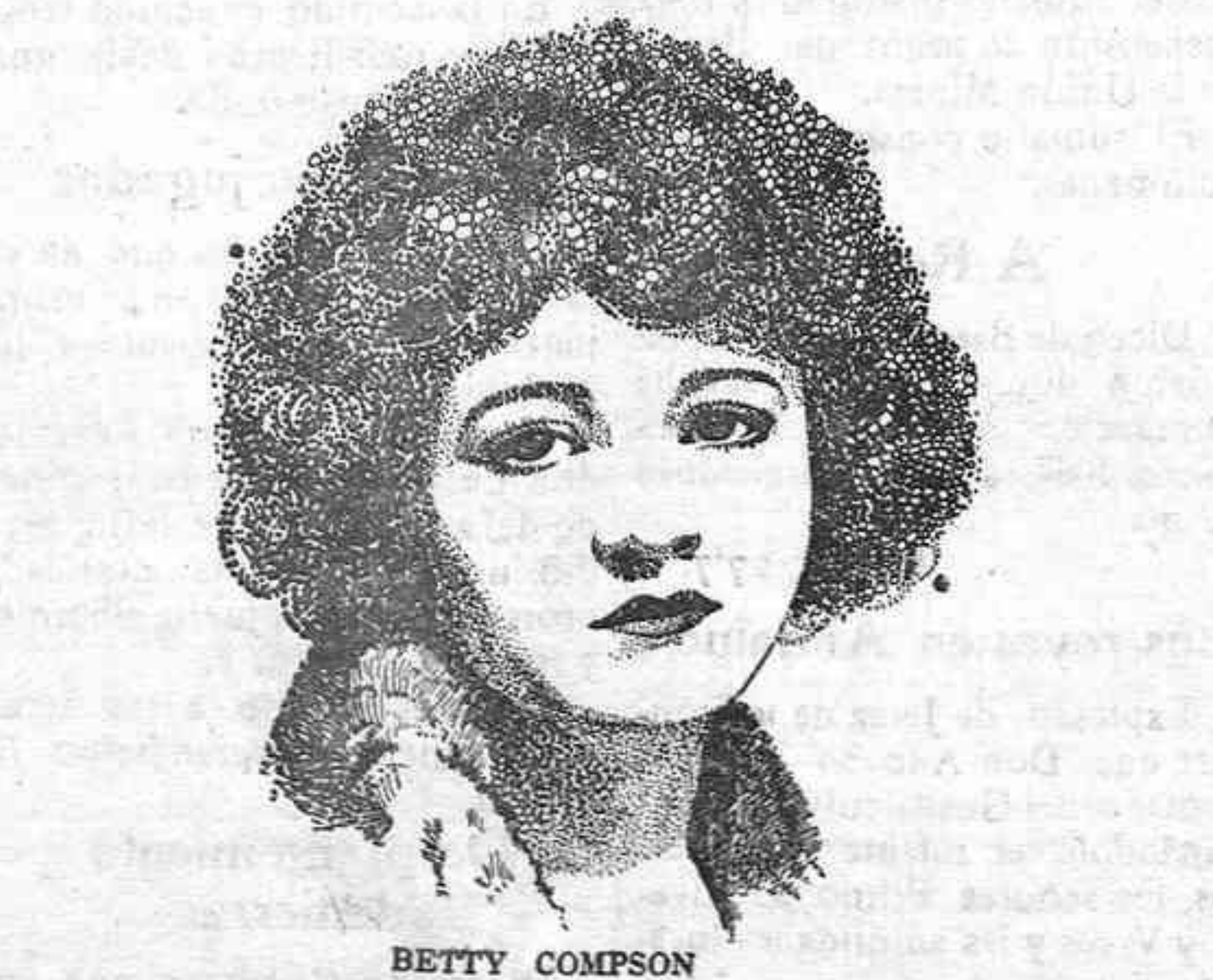
BETTY COMPSON Eminente artista de la pintura que desempeña importantísimo papel en la película «De mujer a mujer», que se estrenará esta noche en el Parque Recreativo.