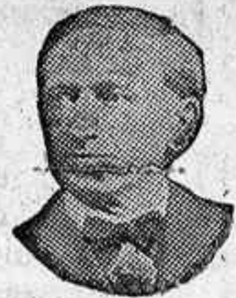
Retrato de G. S. Brooks

quien ha estado curando la quebradura o herida por 30 años a hombres, mujeres y niños. Mi aparato no es un braquero, son cojines de aire, son la última palabra de la Ciencia. No molestan, permiten toda clase de deportes, son lavables, no se rompen. Se hacen para su medida con la garantía de satisfacción, o la devolveré su dinero.