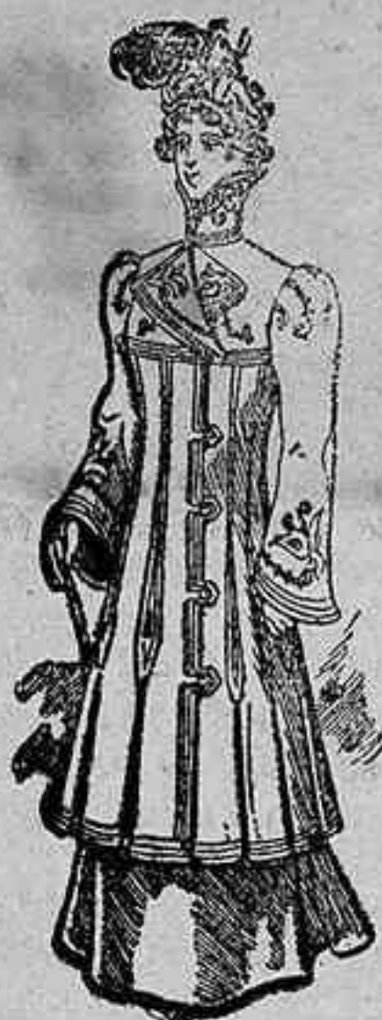
SALIDA DE TEATRO

Hablando con franqueza a mis lectoras (no quiero ser aduladora, pero las supongo guapas, discretas y benévolas) les diré que estos saquitos que se estilan ahora me parecen feos. Si hace cuatro ó cinco años hubiéramos visto a cualquier amiga nuestra melida en una funda de esta naturaleza hubiéramos pensado, sin asomos de malicia, que la difunta era mayor, porque estos abrigos de señora que ahora privan parecen los gabanes de nuestros abuelos, com primidos y arreglados a la época moderna.